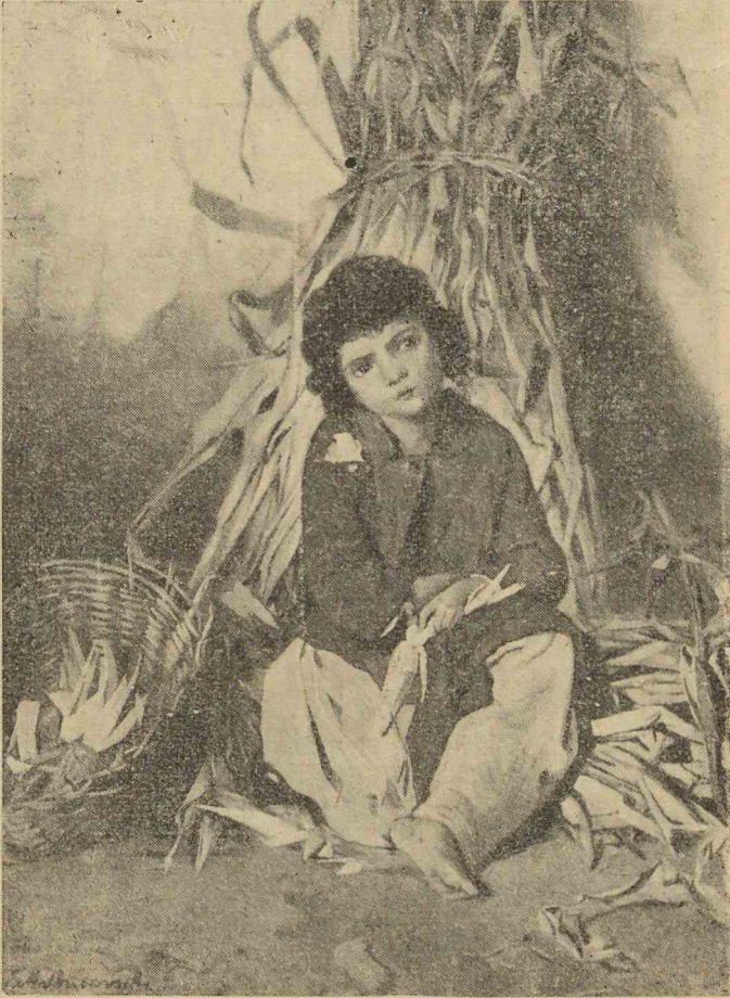
„Dar eu, bietul de mine?“

Pornit dela țară ( capodoperele menționate până acum: In-gândurare , „ Dar eu, bietul de mine? “ și „ Poftiți! Poftiți floricele! “ sunt creațiuni izvodite pe aceste plaiuri bucovinene!)—