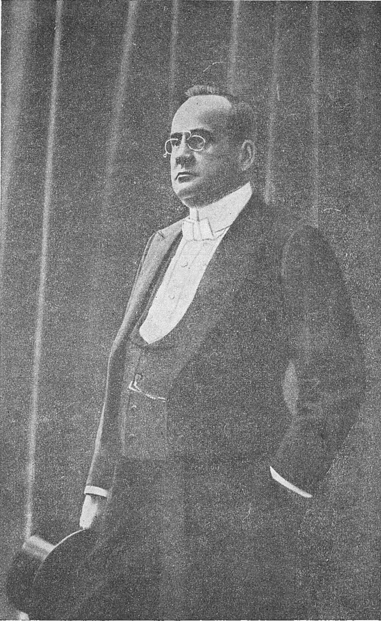
Aurel C. Popovici