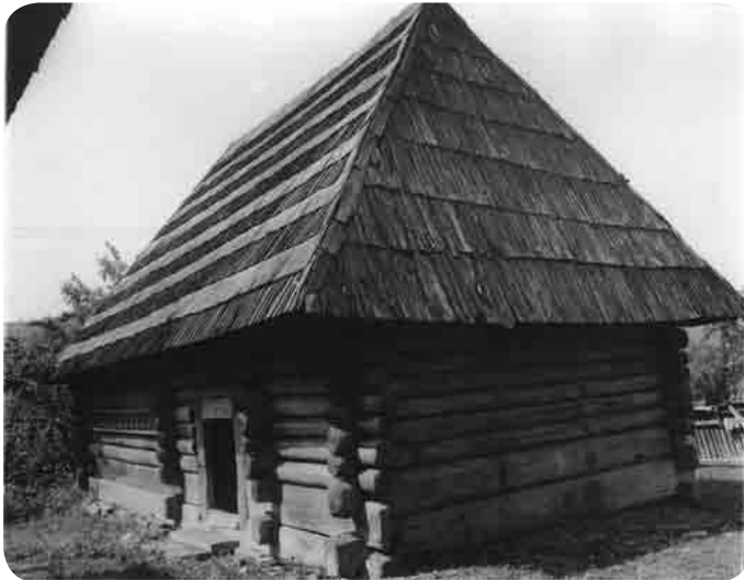
Casa Marincea din Sârbi, 1789