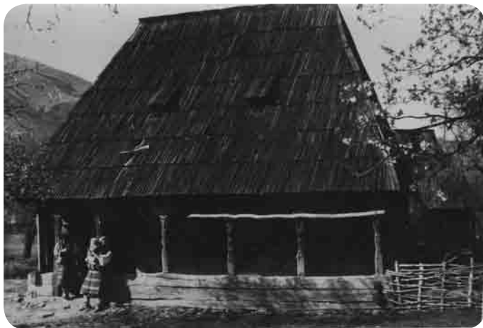
Săliștea de Sus, sec. XVII