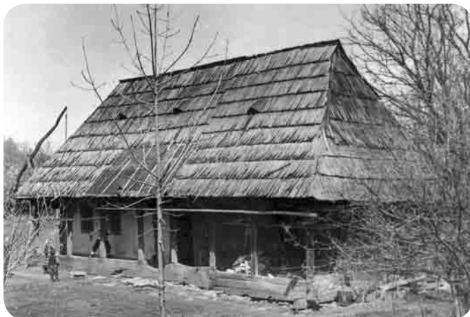
Casa Cupcea din Călinești, 1710