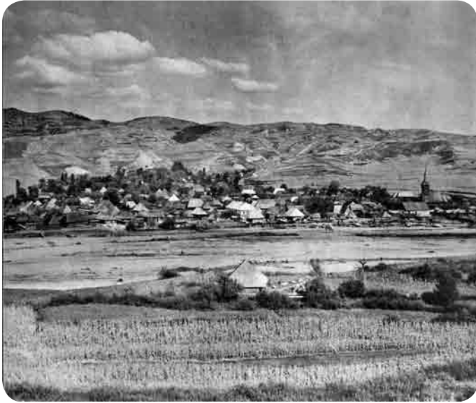
Imagine din sat maramureșean