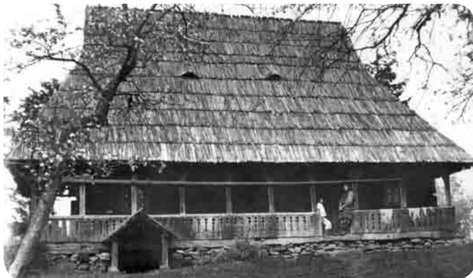
Casa familiei nobile Dunca - Bud din Sârbi, 1676, cu bârne în structură datate 1570