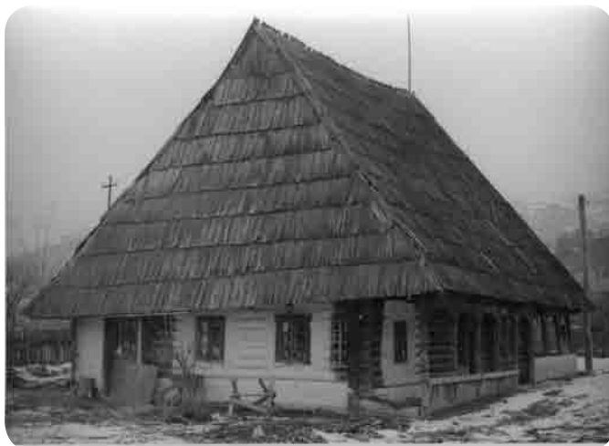
Casa Timiș din Borșa, sec. XVIII - casă neneșească