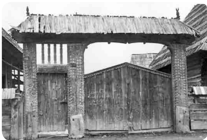
Poartă veche din Petrova