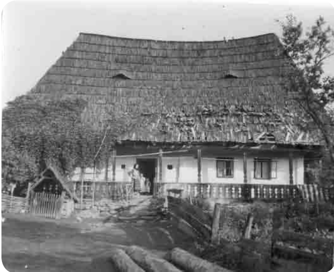
Casa familiei nobile Balea din Ieud, sec. XVII