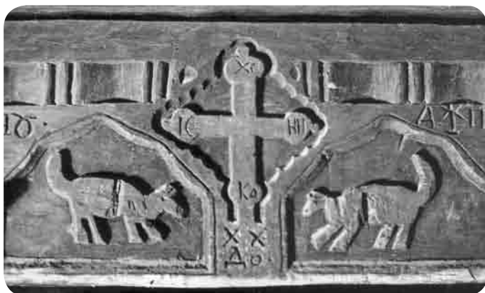
Ancadrament pe ușă cu inscripție în chirilică și datare