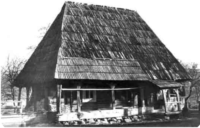
Casa Iurca din Călinești datată cu inscripție „De la facerea lumii văleat 7301”