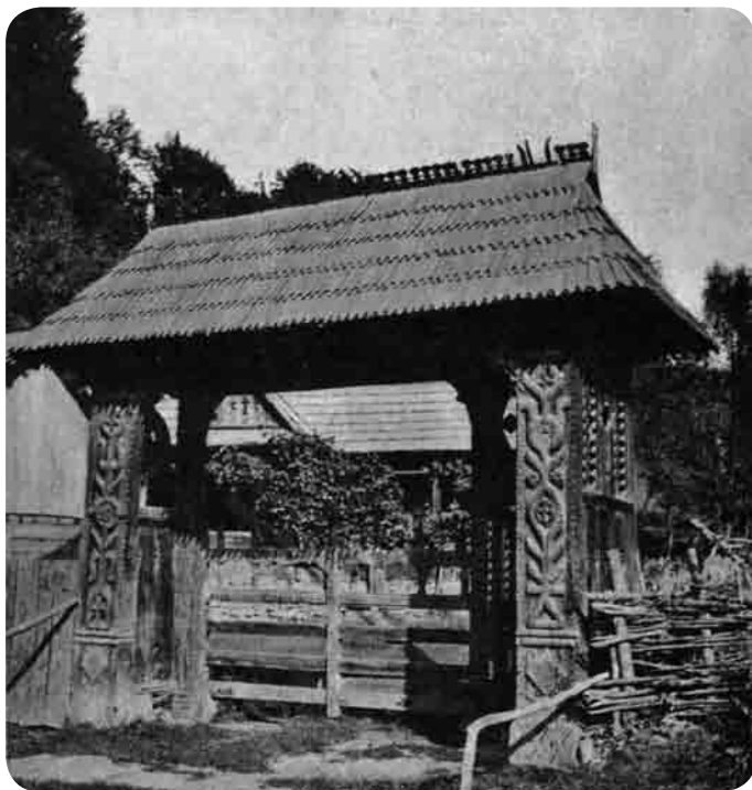
Poartă maramureșeană din Mara