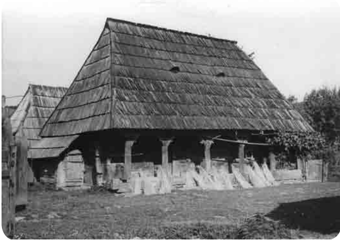
Casă Călinești, sec. XVIII