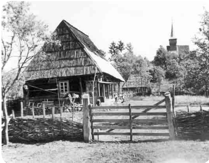
Valea Cosăului - Imagine din sat