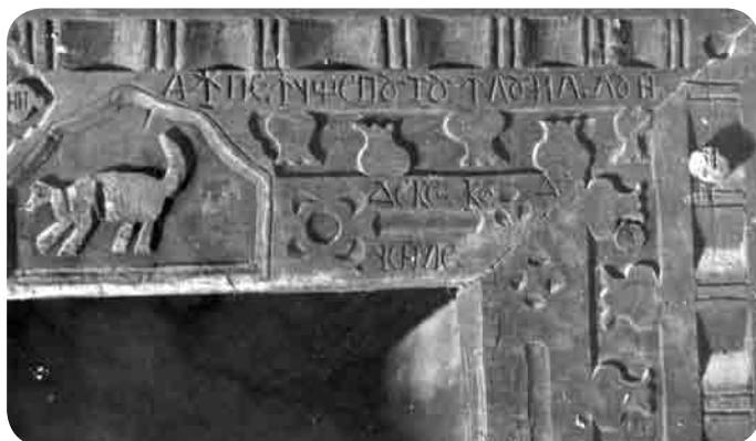
Ancadrament pe ușă cu inscripție în chirilică și datare