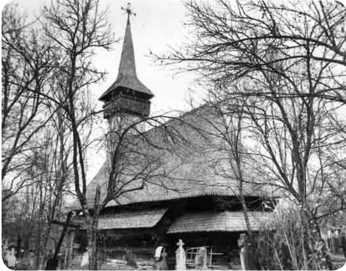
Biserica din Oncești, 1621