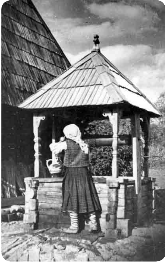
La fântână - Oncești