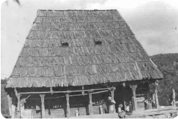
Casa Buftea din Cuhea, 1789