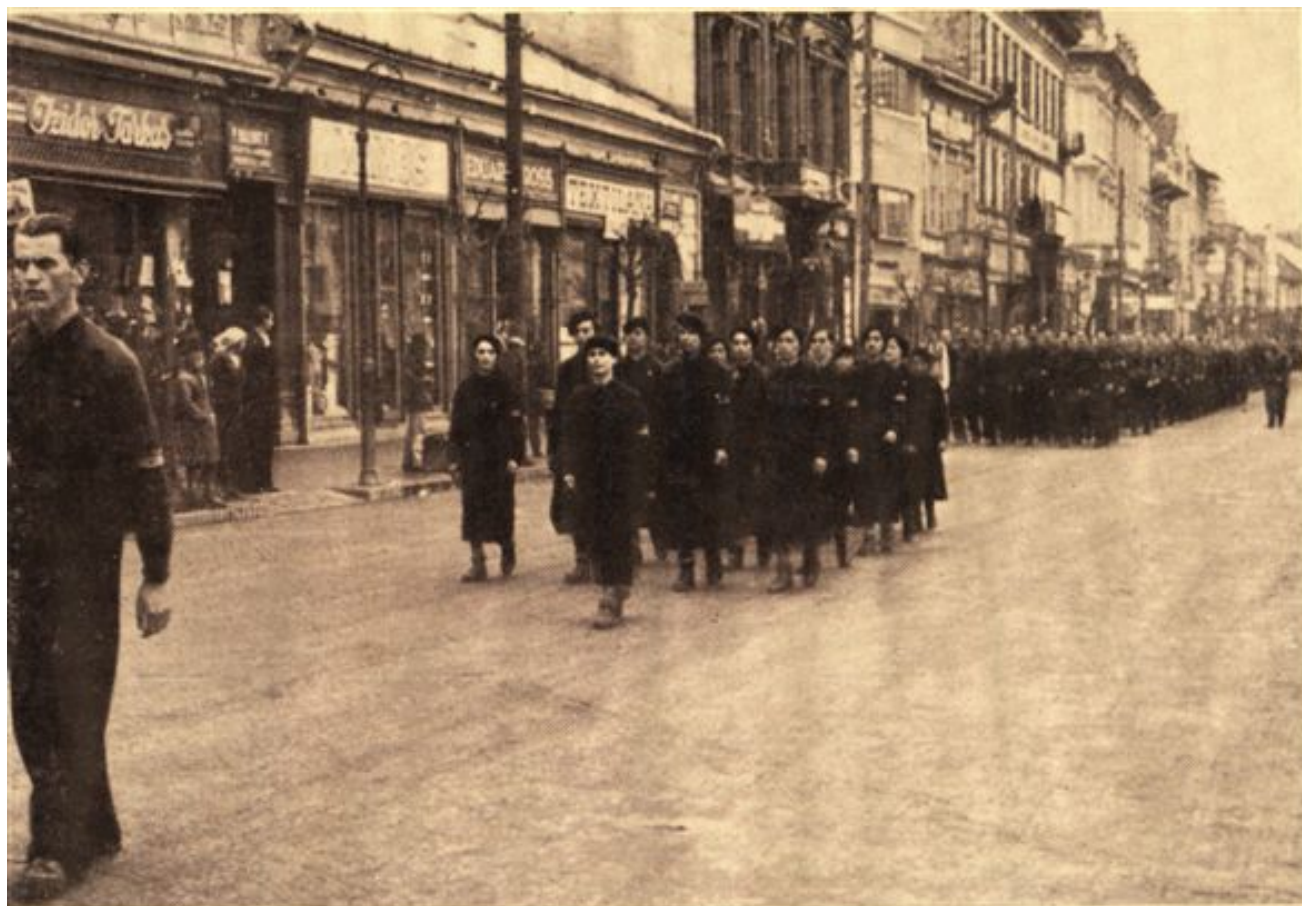
Spre locul de închinare