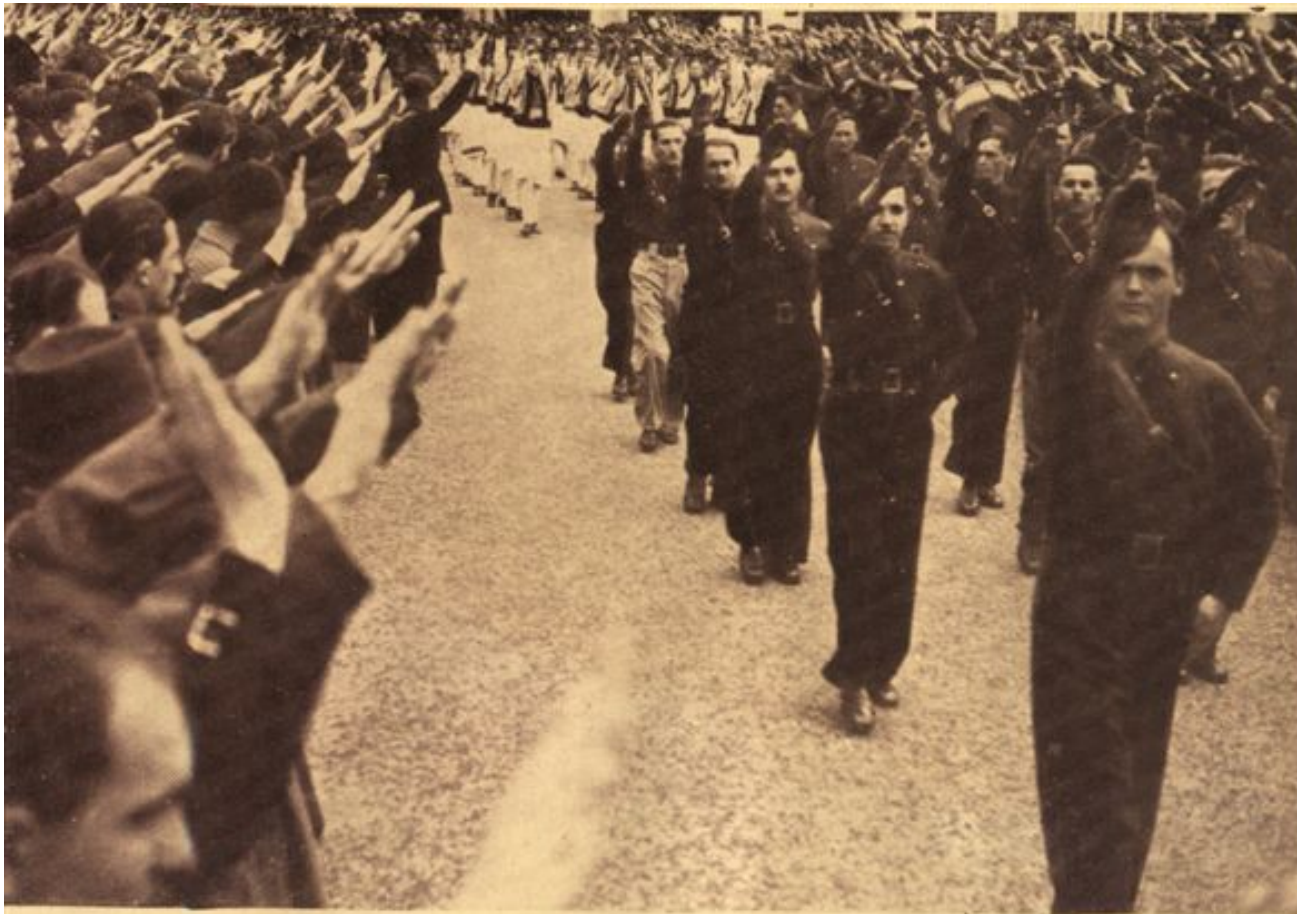
Centrul studențesc „Cernăuți”