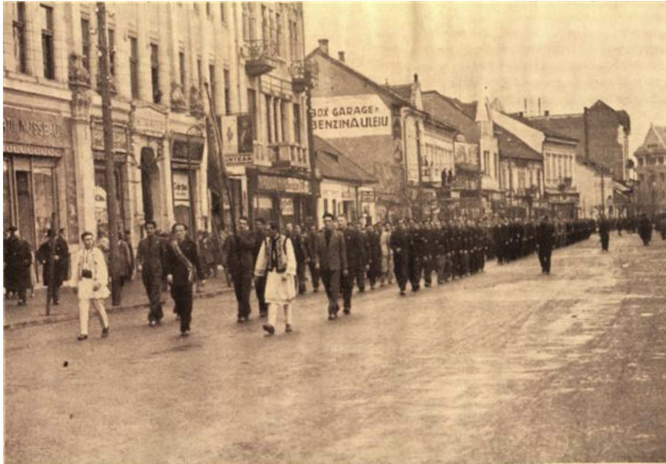
Centrul studențesc Cluj