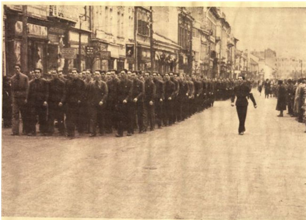
Studenjimea Bucureșteană spre Catedrală