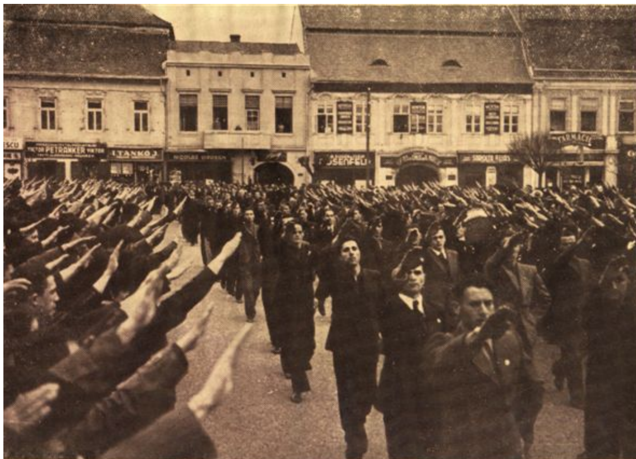
Centrul Studențesc Cernăuți