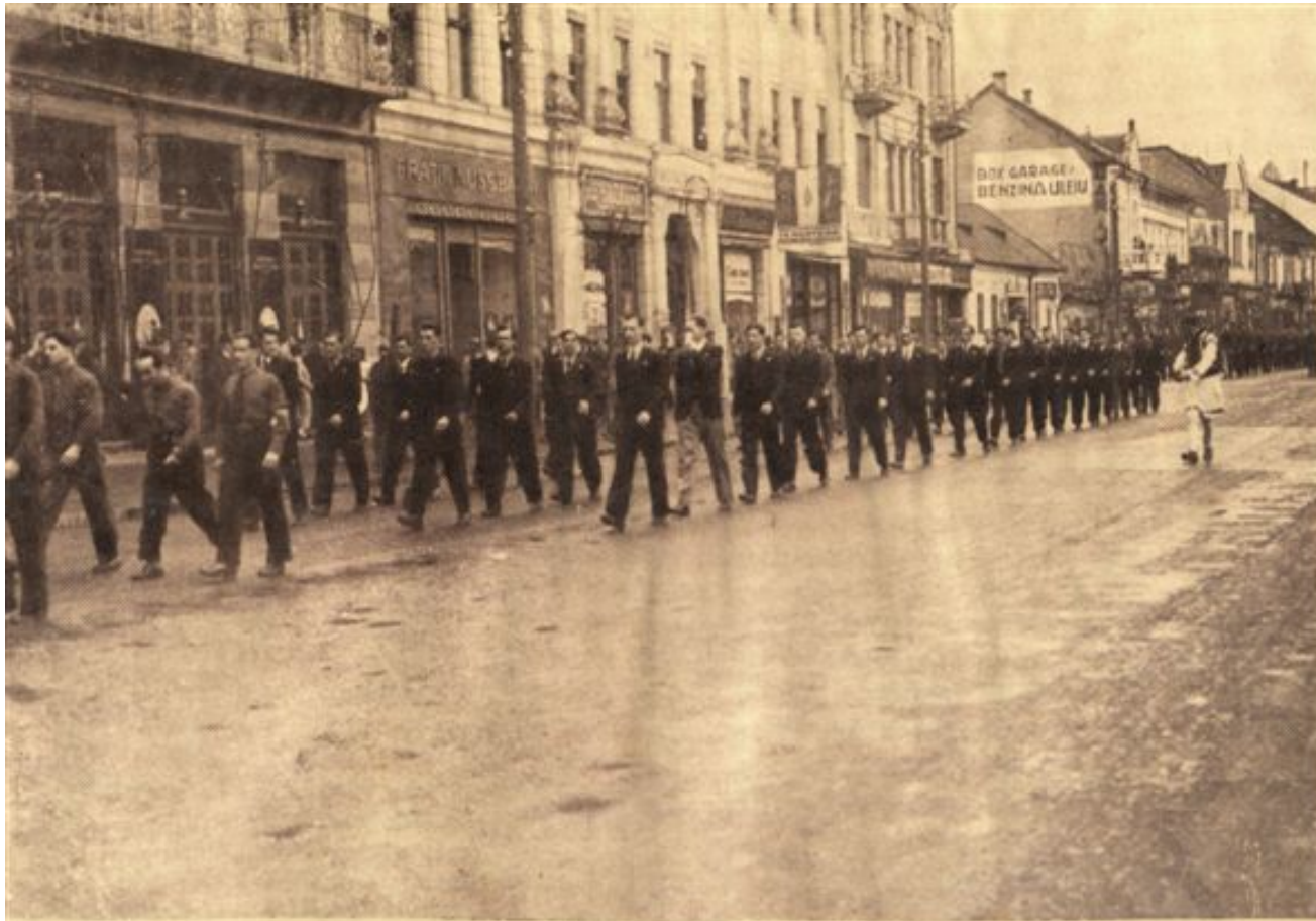
Pe străzile Tg.-ului-Mureș