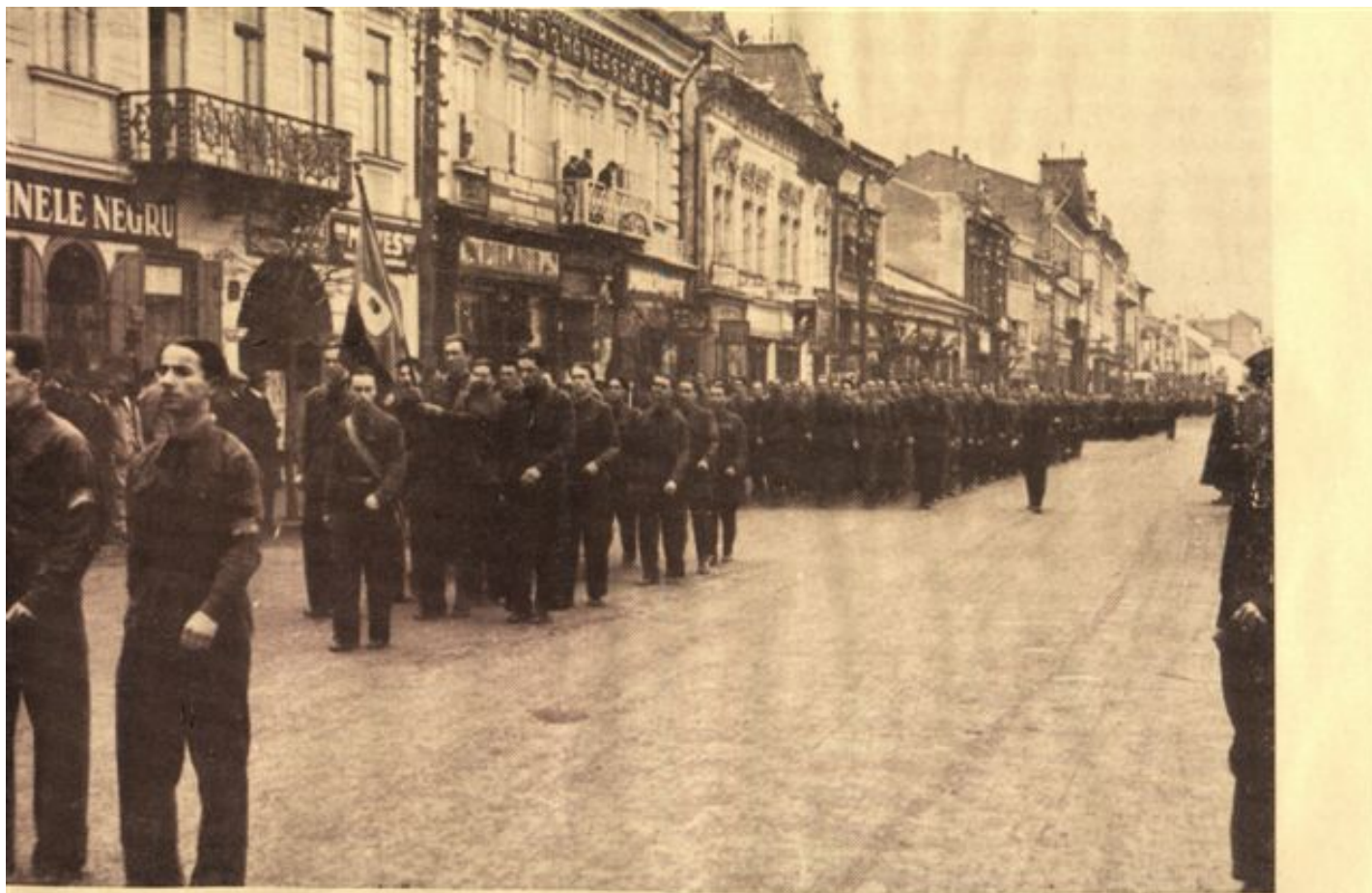
C. S. București spre Catedrală