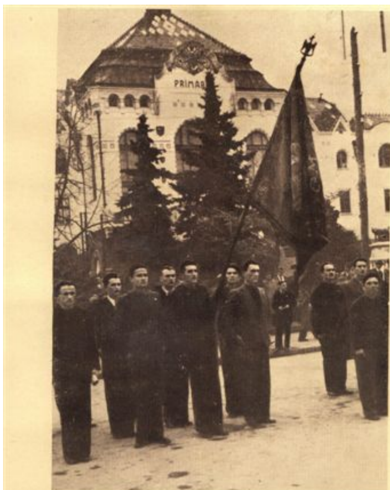
Centrul Studențesc „Cluj” prezintă drapelul