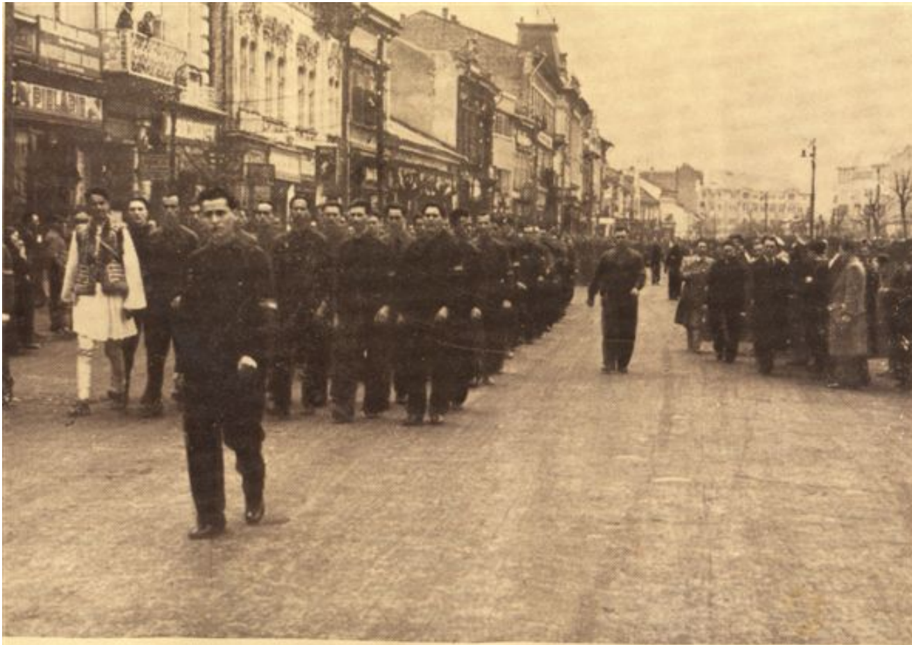
Centrul București spre locul defilării