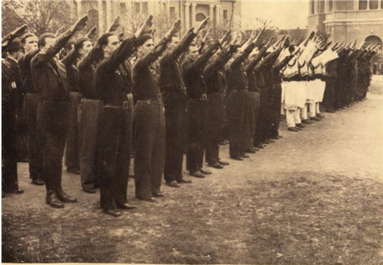
Onorul la Drapel