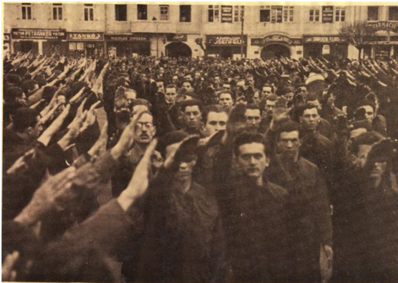
Centrul Studențesc „București”