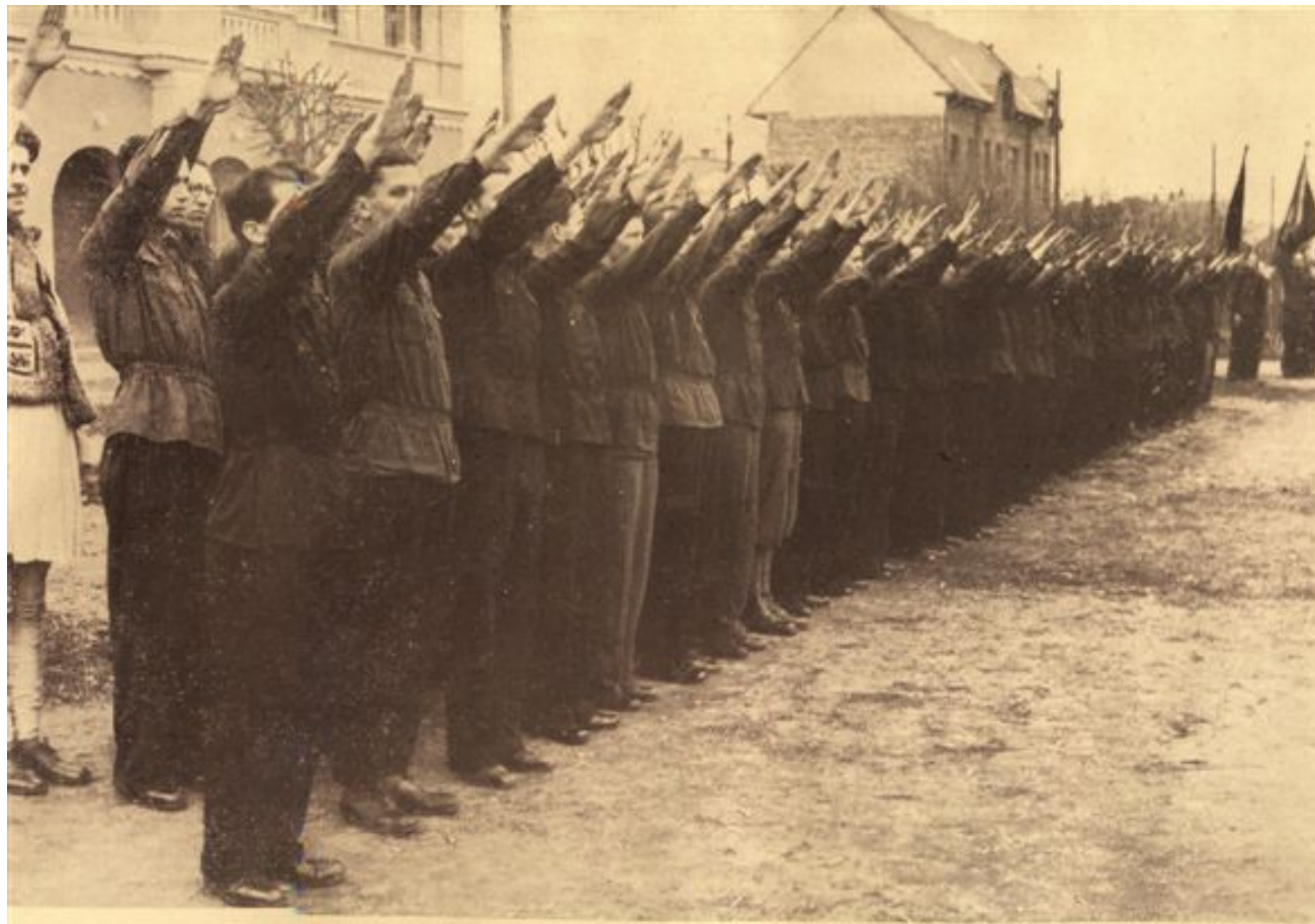
Se dă raportul