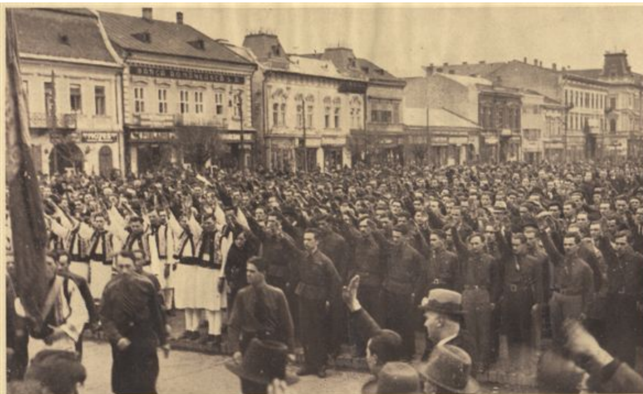
Publicul și studenții în fața Catedralei, la rugăciune