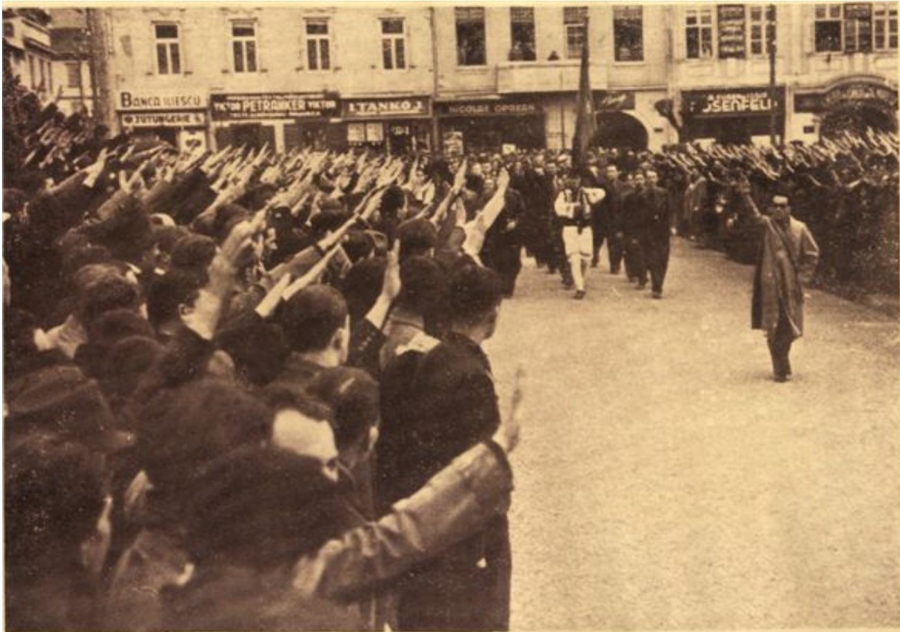
Președ. I. Arghiropol