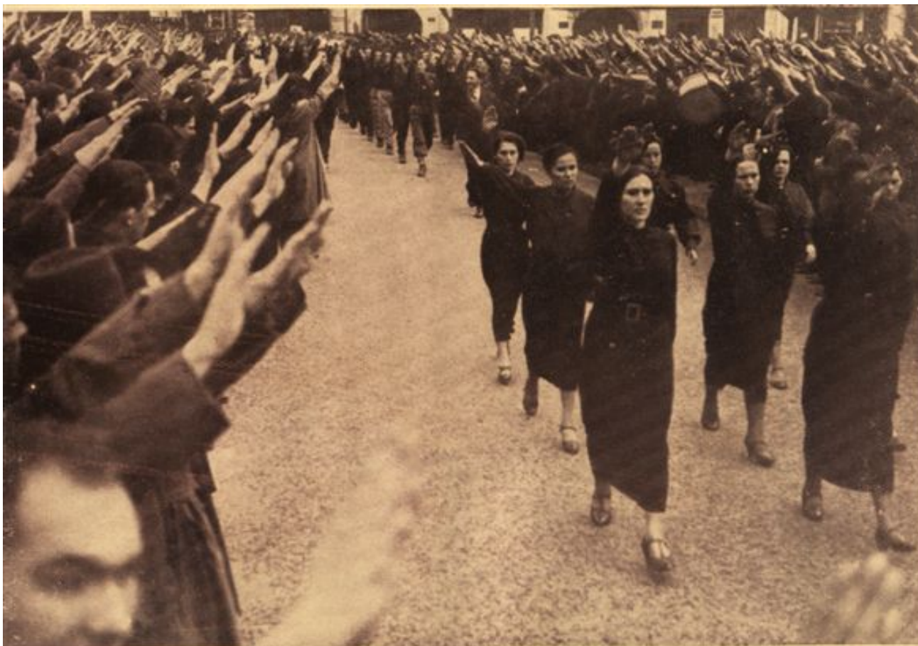
Președ. Filon Lauric