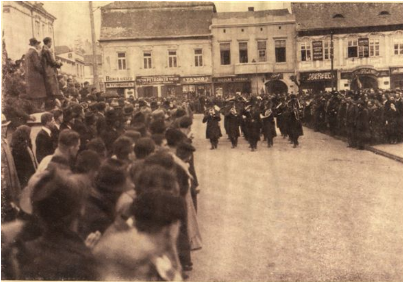
Muzica Militară deschide defilarea