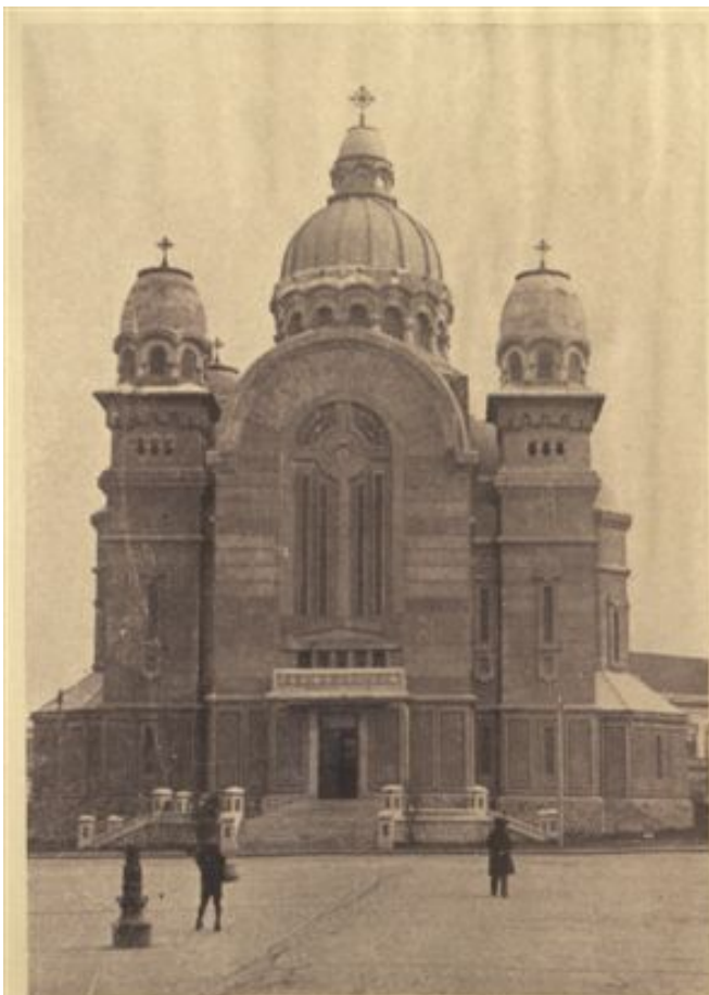
Mândră, monumentală, Catedrala ortodoxă din Tg.-Mureș așteaptă legiunile de credincioși.