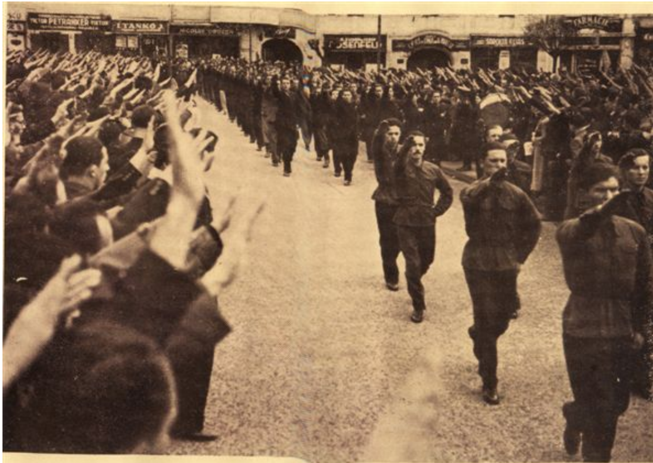
Centrul Studentesc „Cluj”