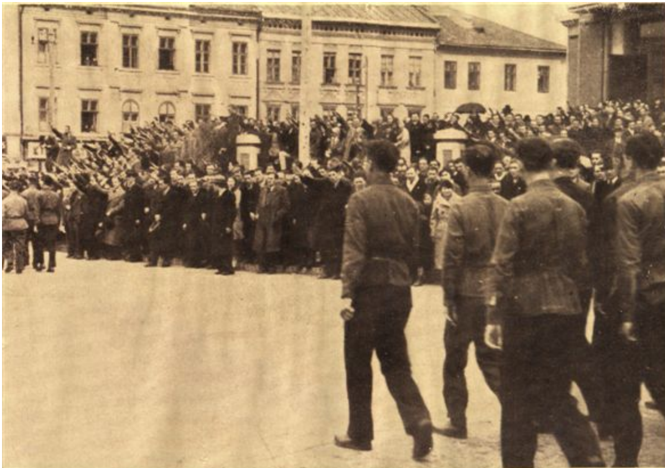
Oficialitățile și Publicul pe treptele Catedralei primind defilarea