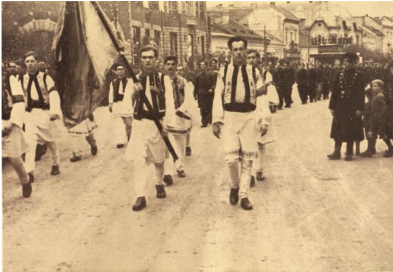
Centrul Studențesc „Iași” prezintă drapelul