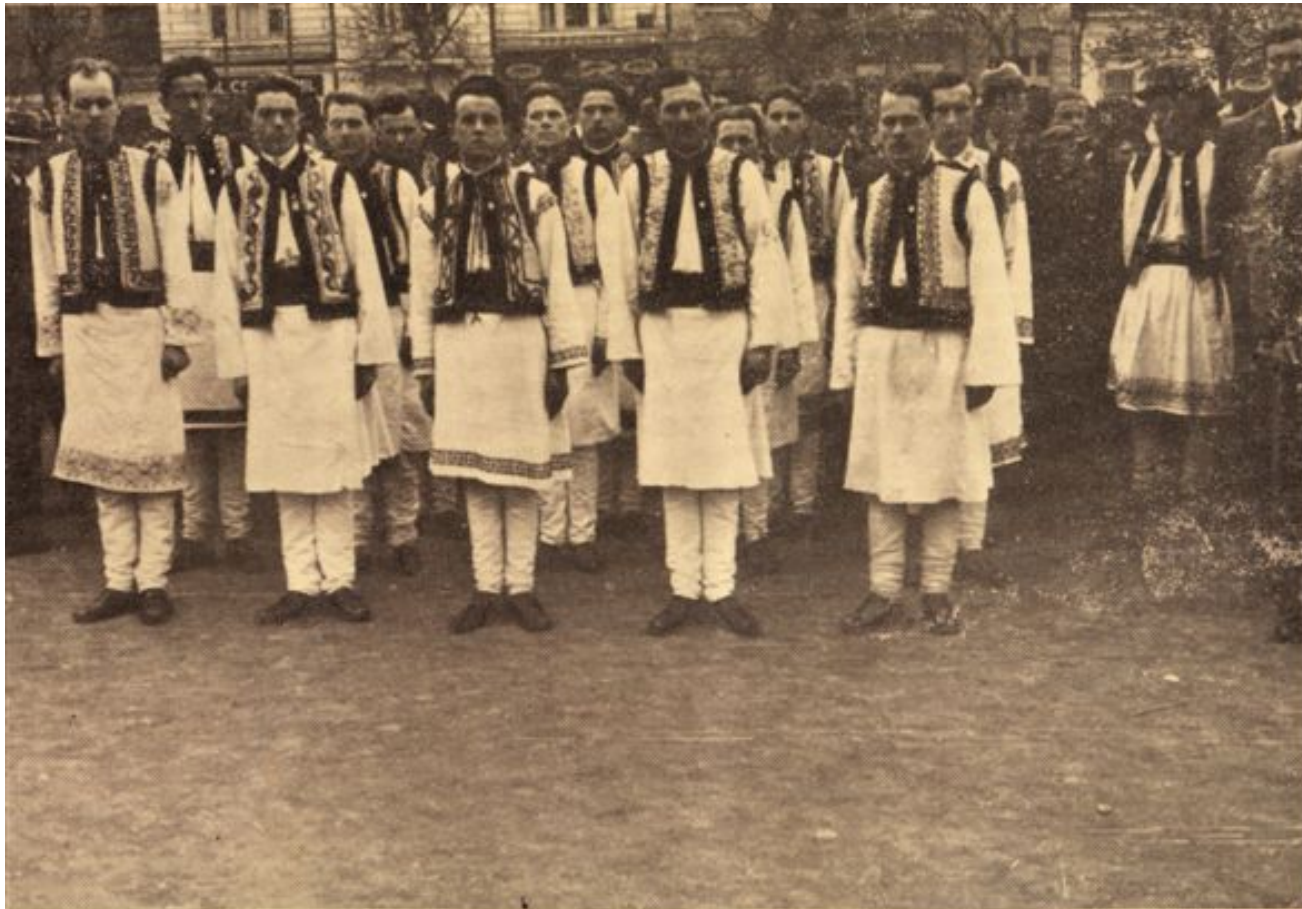
Un grup de studenți leșeni