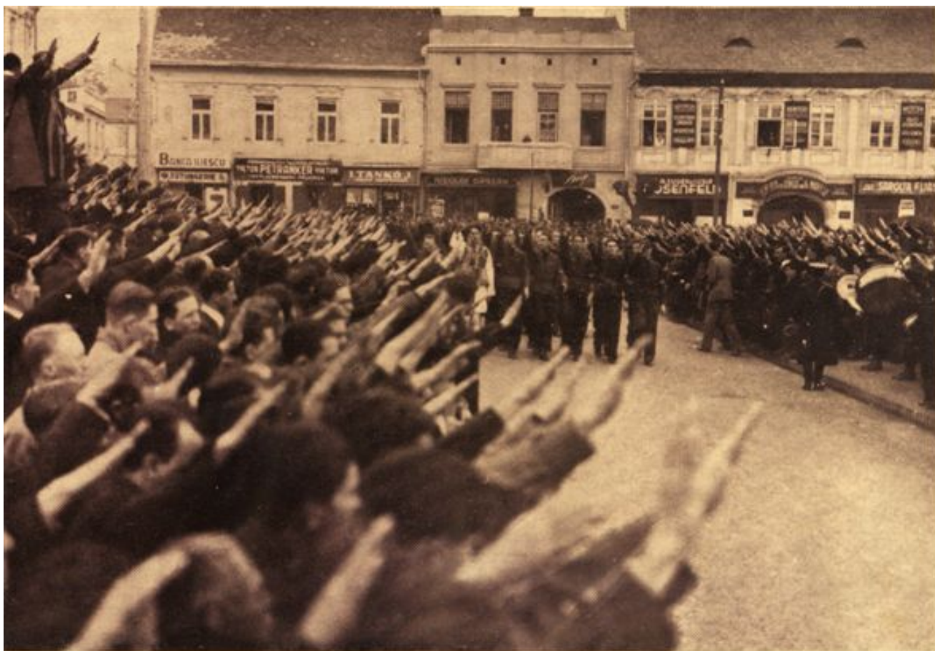
Publicul salutând studențimea Bucureșteană