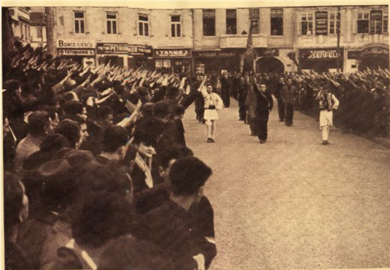
Președ. Tiberiu Vereș