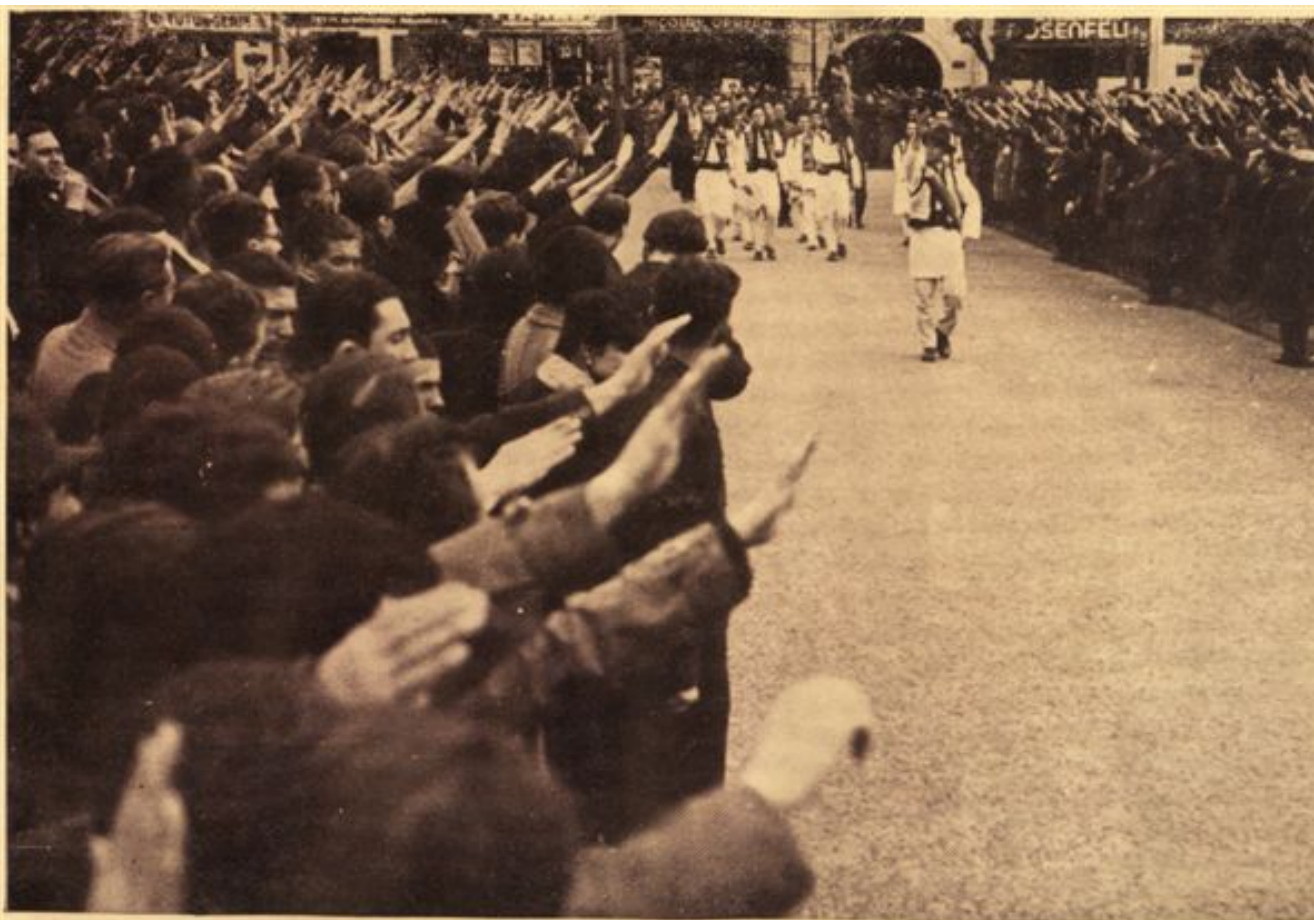
Președ. Teodor Tudose