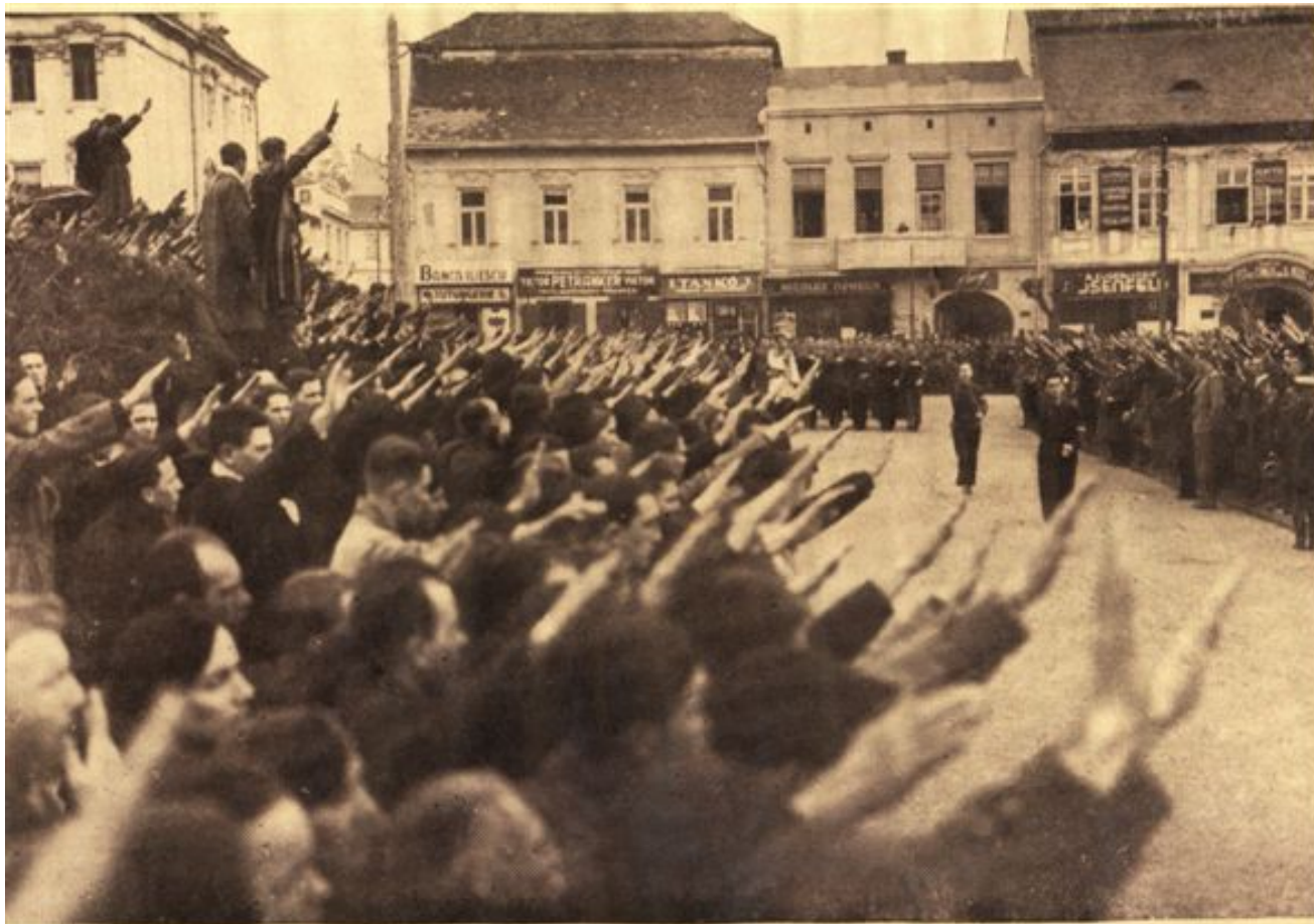
Centrul Studențesc „București”