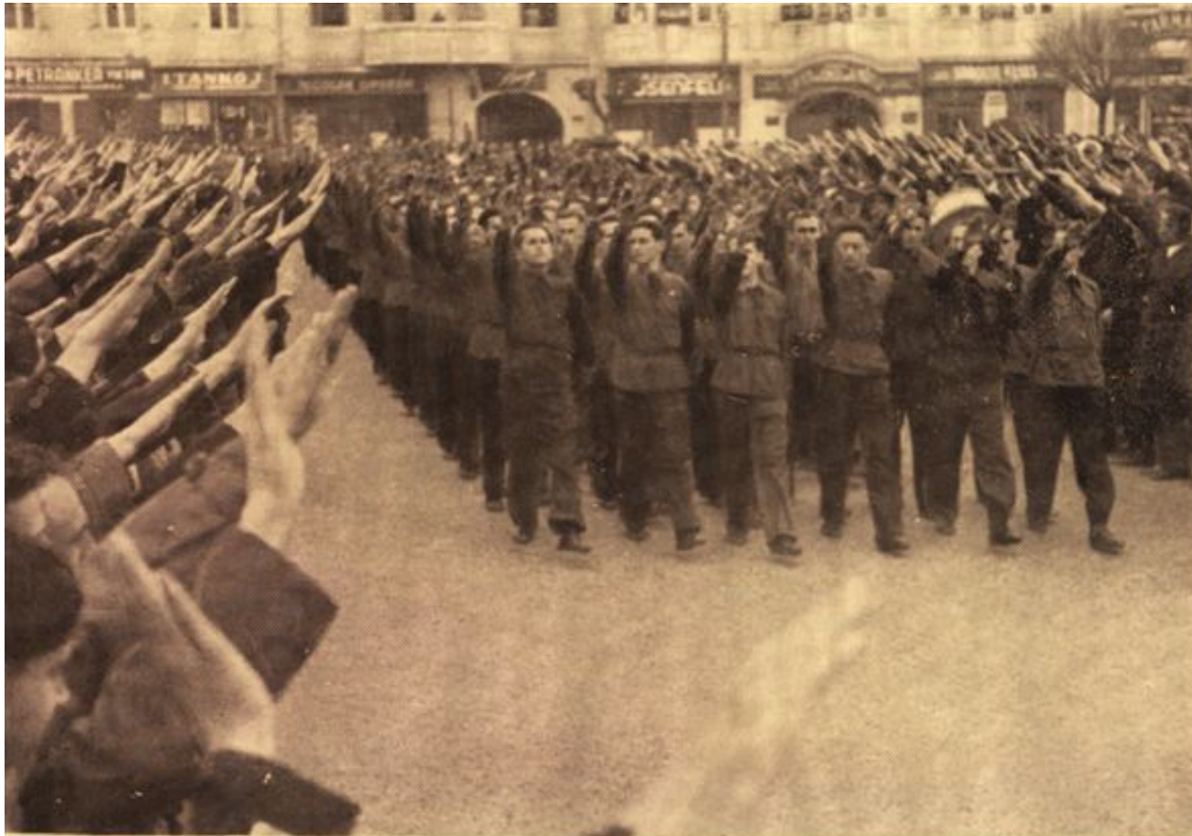
Centrul Studențesc „București”