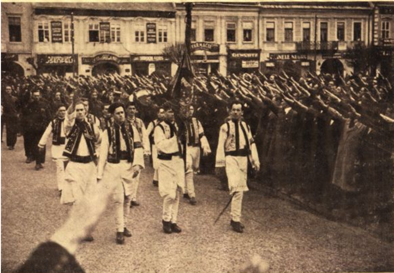
Garda Centrului Iași prezintă drapelul