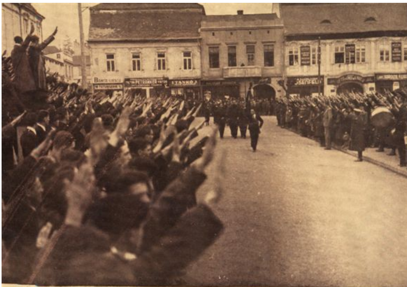
Deșilează Conducătorii Centrelor Studențești