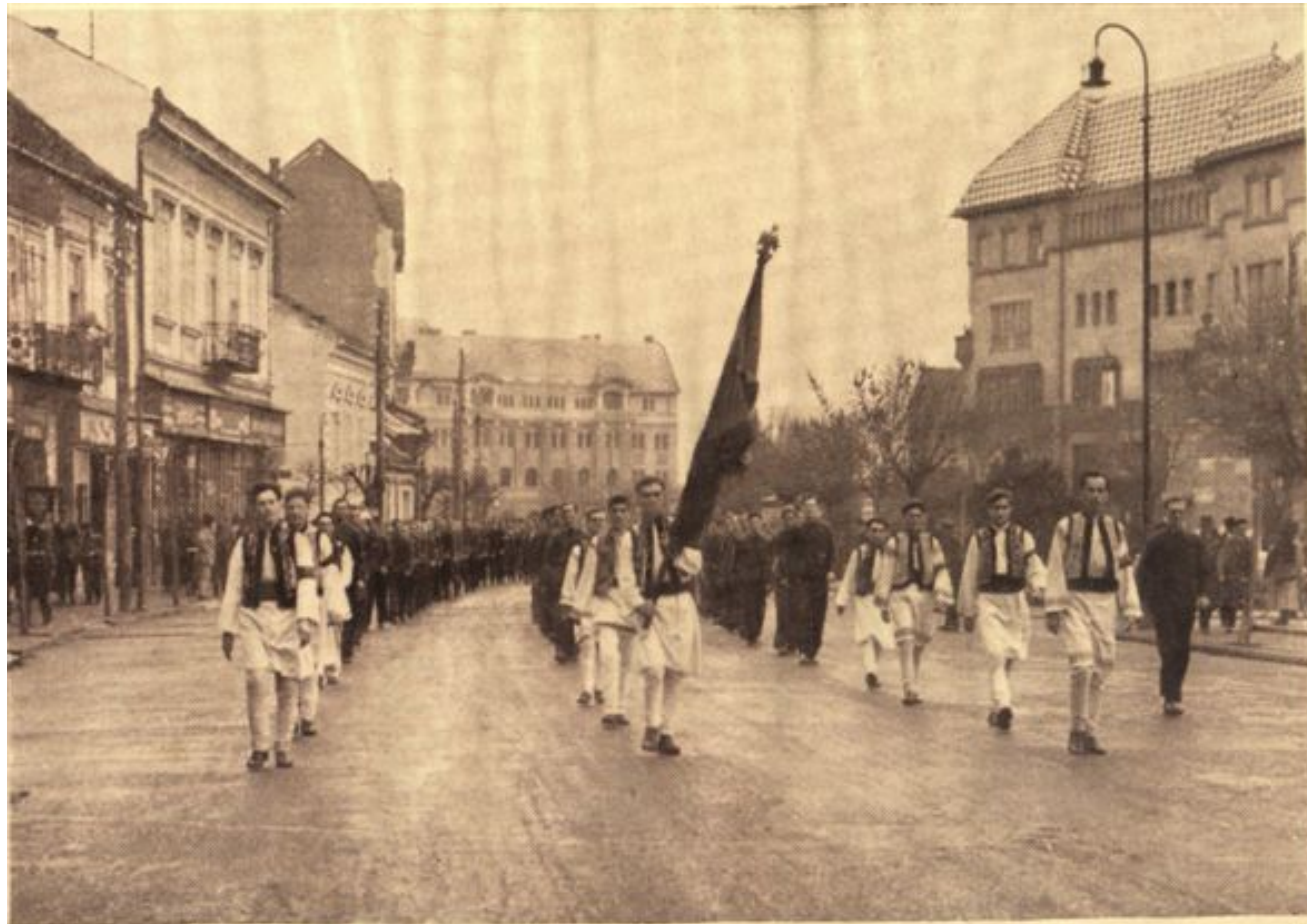
Centrul Iași spre locul defilării