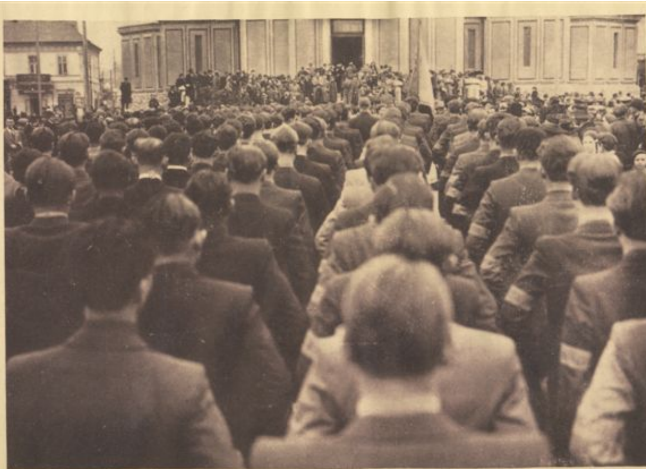
In piața Catedralei, neîncăpătoare, Studențimea țării asistă la Te-Deum