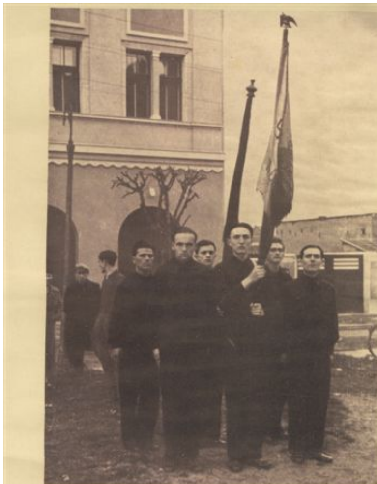
Garda Drapelului Centrului Studențesc „București”