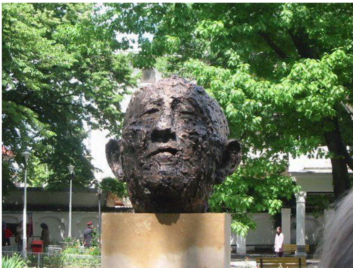
Ultimul patriarh al naționalismului creștin românesc: Petre Țuțea (1902-1991)

Situația postbelică a dus la o eclipsă de vreo două decenii a spiritului național. Apoi, o dată cu debutul epocii ceaușiste, naționalismul a revenit în forță, dar în forme profund viciate: dimensiunea lui moral-spirituală, creștină și ortodoxă, a fost înlocuită cu un soi de demagogie protocronistă, chinuit adaptată ideologiei marxiste (în plasa căreia au căzut, din păcate, și câteva conștiințe naționale autentice). A rezultat, în ansamblu, o caricatură grotescă a naționalismului (sub eticheta “patriotismului” propagandistic), de altfel tot după model moscovit. În slujba acestui naționalism ateu, materialist și gregar s-au pus, pe lângă câțiva naivi de bună-credință, o întreagă armată de politruci abjecți, mai ales din a doua generație comunistă, unii dintre ei activînd și în cadrele Securității, iar Adrian Păunescu și Corneliu Vadim Tudor au fost fruntașii lirici ai șleahtei. Este ceea ce a supraviețuit cu precădere din regimul comunist, după decembrie '89, spurcînd pînă azi scena politică românească.