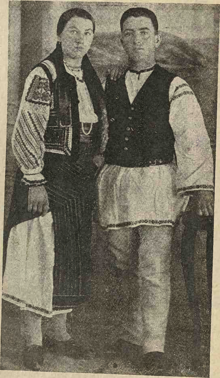
Portul de sărbătoare al sâtenilor români din comuna Toplița, jud. Mureș.

prind între ele cu ceiță , șeiță ( cheiță ), care se face, cu acul sau