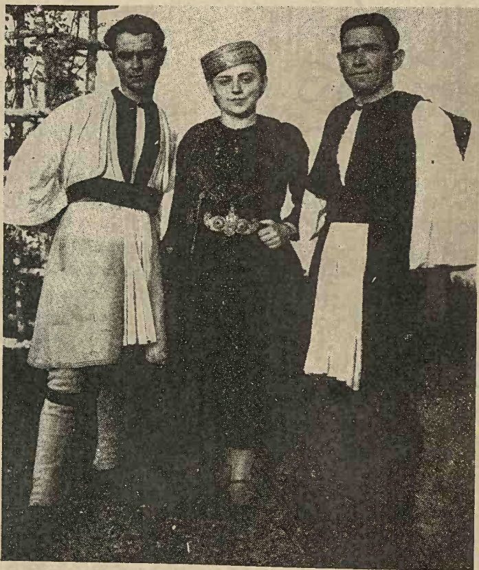
Coloniști aromâni din satul Regina Maria, (la trei kilometri de Silistra), jud. Durostor.

Feciorii (flăcăii) și bărbații tineri, români macedoneni, în picioare poartă lăpudzi numiți și prepozi (ciorapi albi de lână), împlețiți cu colorii și țăruhi (un fel de opinci fără nojițe), cari