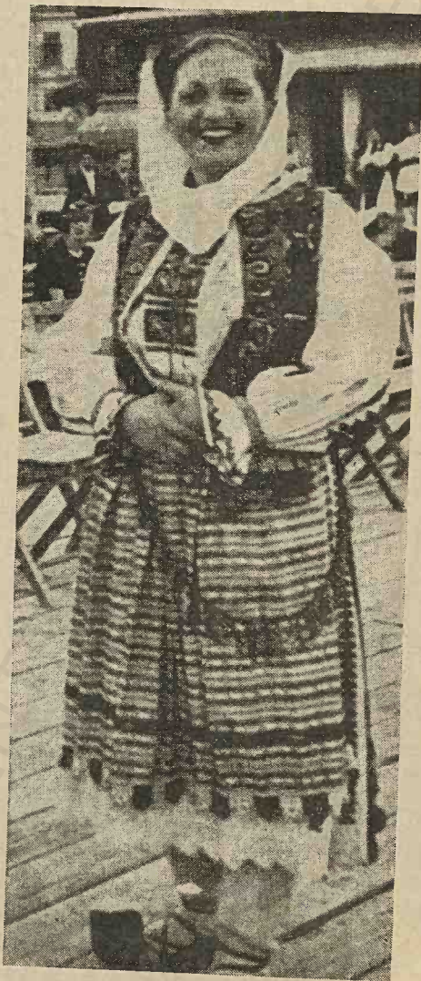
Costum național de sărbătoare al sâtenilor române din comuna Hobița-Uricani, plasa Petroșani, județul Hunedoara. (D-ra Teodora Jurca)

ii, separate de ea și susținute de mijloc cu drăgaie zise hozene (bretele de pânză).