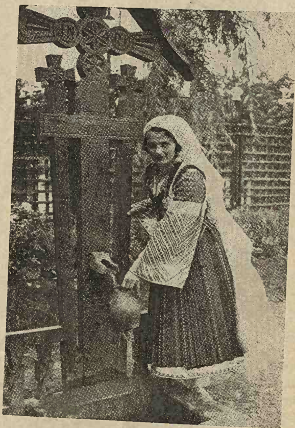
Portul de sărbătoare al sâtenelor române din comuna Tismana, jud. Gorj.

La „strânsură“ (mijloc) fetele și femeile se încing cu brăciri (bete) late de trei-patru degete; fondul roșu contrastează cu diferitele alesături și intercalări de fir.