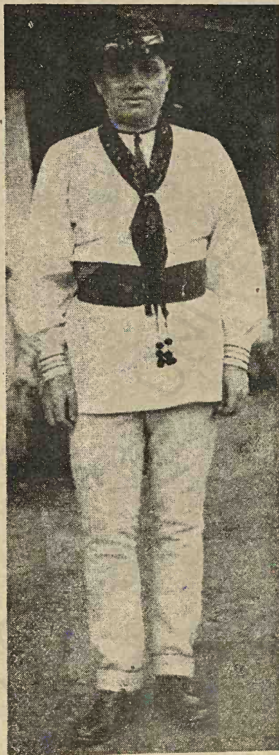
Portul sătenilor români din com. Rupea, jud. Târnava Mare. (Gheorghe Forsea)

la fodorii (volane) micuți, urmează trei șiruri de cusături. La mijloc modelul întreg, iar pe delături, jumătăți din el. „Fodorii“ au cîpcă (dantelă) neagră, care se gată (termină) cu „flu-