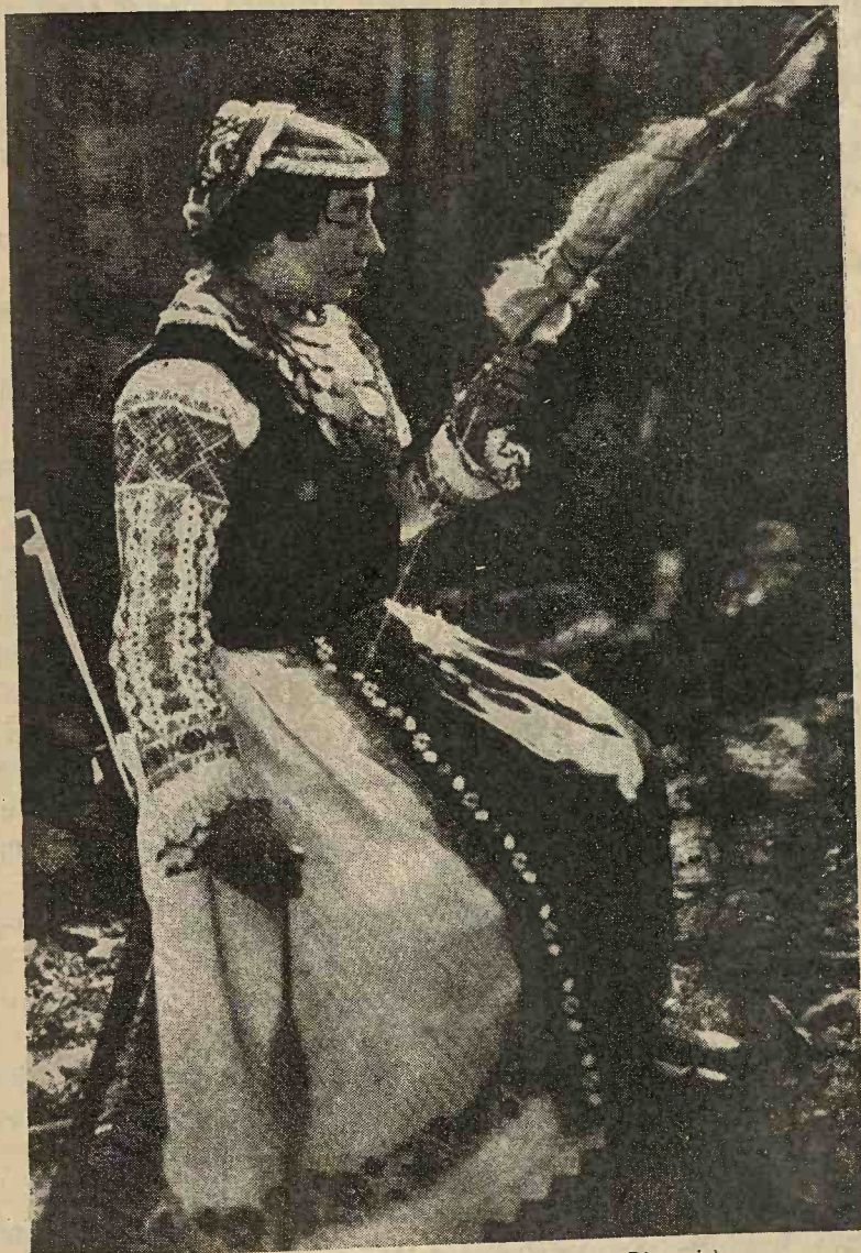
Port național românesc din Banat ( Dacia Ripensis ).

albastru, negru, roșu și verde). După fiecare șase, șapte cm., urmează un ciucure mai gros din bumbac alb.