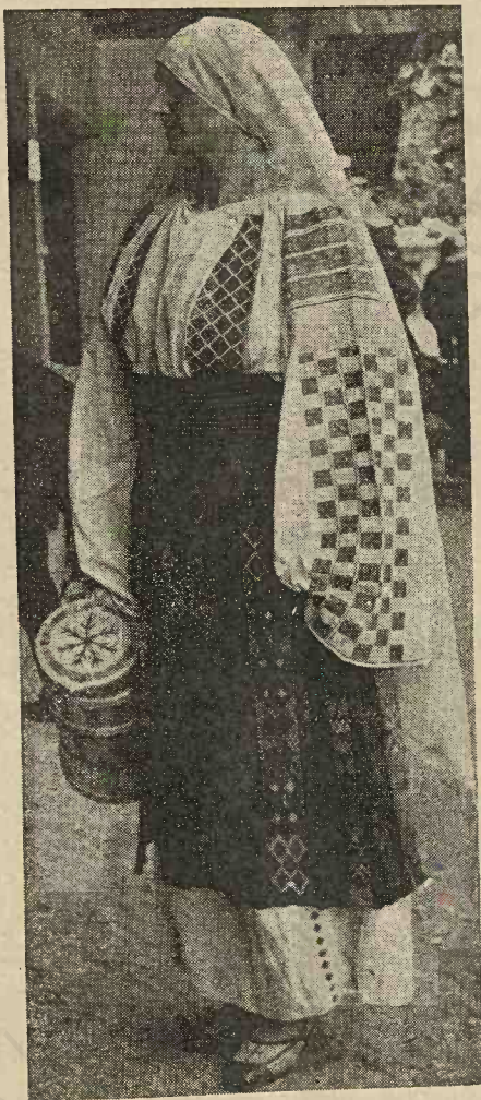
Portul sătencelor române din jud. Mehedinti.

în lat (orizontale) de felurite colori (alb, cafeniu, galben, portocaliu și verde), după plăcerea celeia ce le poartă.