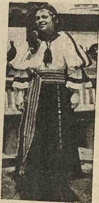
Port țărănesc din comuna Nadășu, plasa Huedin, județul Cluj.

Peste cămeșe îmbracă bondă (cojocel scurt și fără mâneci) care se face din trei piei de ierhă (miel sau piele de oaie tăbă-