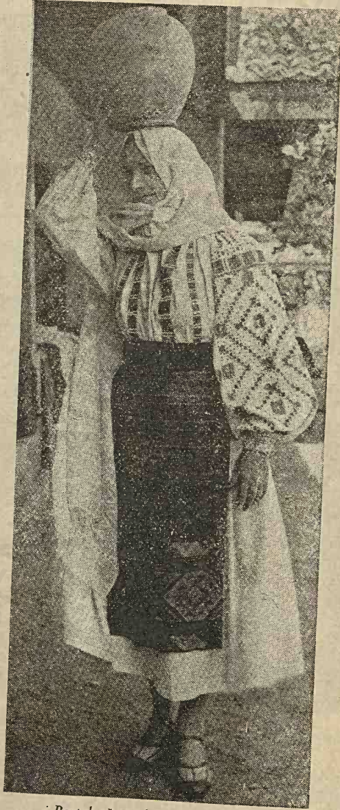
Portul sâtenelor din jud. Olt.

Azi bărbați poartă cămăși de pânză albă cu flori.