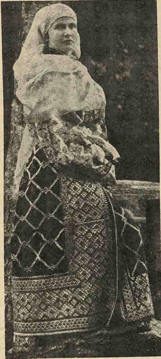
M. S. REGINA ELISABETA în port național românesc din Câmpulung-Muscel.