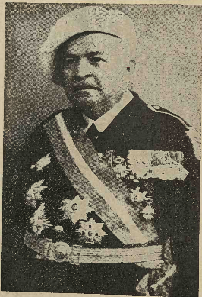
D-l general Ion Manolescu, creatorul „Caselor Naționale“

În acest scop, la 15 Decembrie 1919, centrala Caselor Naționale a înființat în București, calea Moșilor, 41 (la Cooperativele sătești) o expoziție a produselor casnice lucrate în ate-