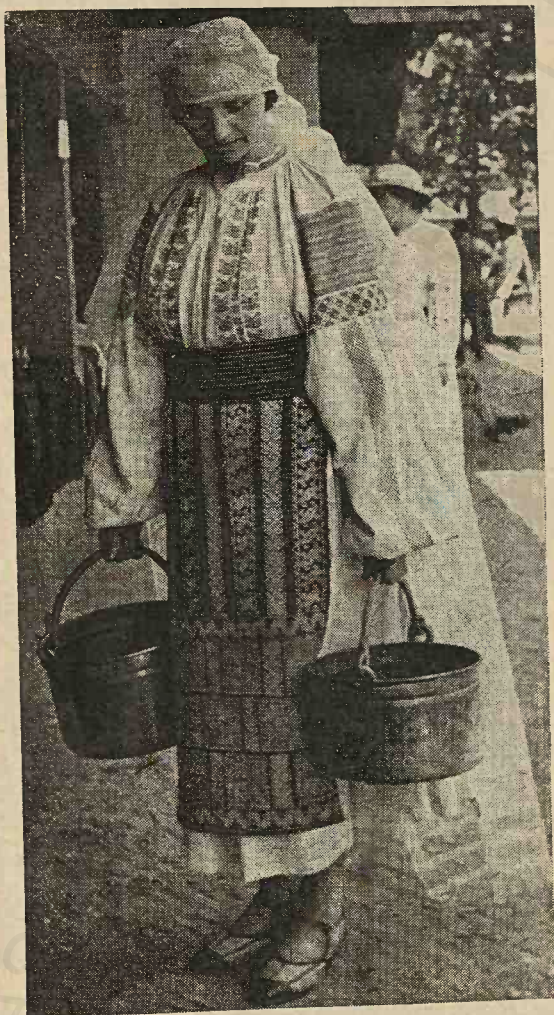
Portul național al sâtenelor române din jud. Vâlcea.

De o parte și de alta a pieptului avea două rânduri de po-doabe cusute cu lână cafenie, care reprezenta figuri de oa-meni ce aveau în mâini câte o măciucă.