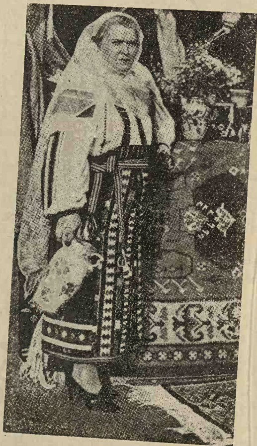
Port țărănesc din jud. Argeș.

Pe piept, guler și manșete au „lucrături“ zise și „flori“ (șabace).