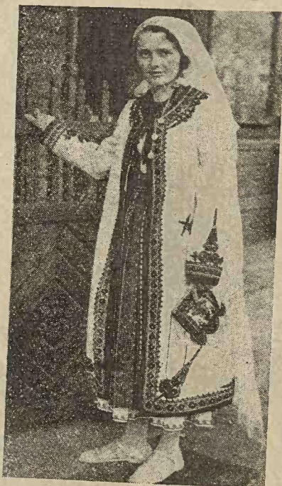
Săteancă română din comuna Tismana, jud. Gorj, îmbrăcată în zeghe din dimie albă, cu împletituri de găitane negre.

În regiunea dealurilor și a șesurilor, primăvara și toamna,