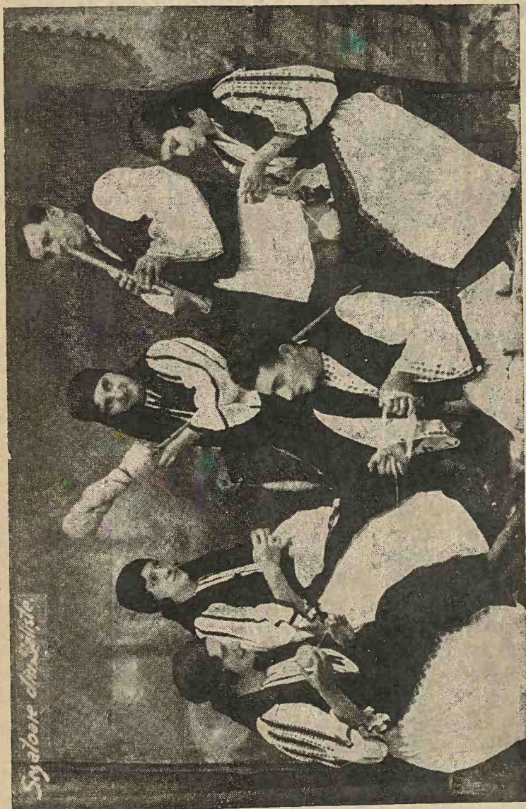
Port național românesc din comuna Săliște, județul Sibiu.

20 ori până la jumătatea fluerului (jumătatea distanței între glesnă și genunchi).