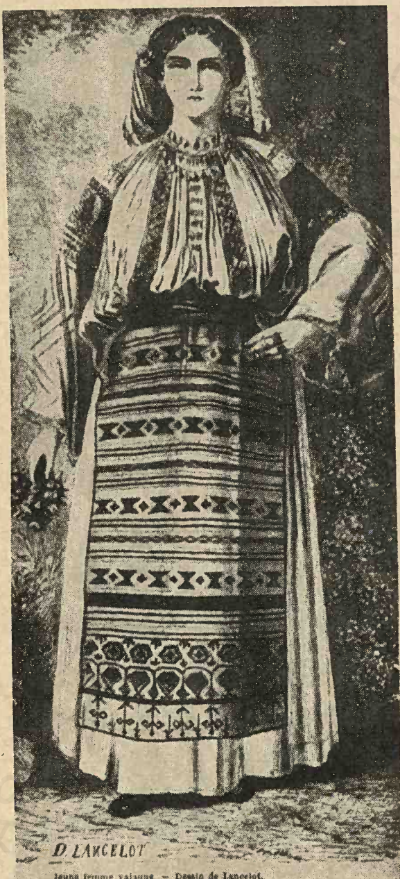
„Tânără femeie valahă” în costum național din județul Muscel. Desemn după natură făcut de Lancelot în 1866.