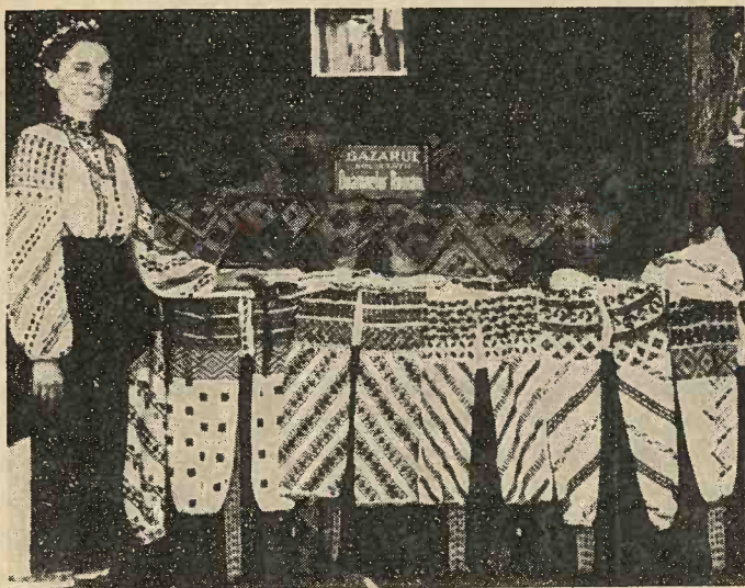
Modele de cusături naționale românești, ce se fac pe mânecile cămeșilor (iiilor) în comuna Putna, plasa Vicovelor, județul Rădăuți (Bucovina).

Pe alțiță și după încrețeală. dealungul mânecilor, se fac