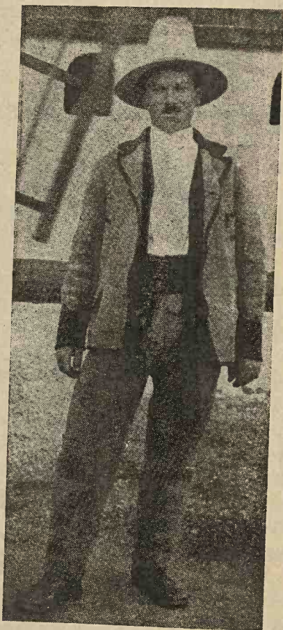
Sătean român din comuna Prislop, plasa Șomcuța Mare, județul Satu Mare.

În comunele Bucium, Buteasa, Ciolt, Gaura, Hovrila și Prislop, situate la S.-S.-Estul acestui județ și aproape de limita județului Someș, sătenii bărbați poartă cămieși din pânză, urzeală de cânepă și bătătură în bumbac. În față, la piept, „cămieșa” are puntie cu pene (cusături albe, mai ales flori). Gulerășul este dublu, pe margini cu pene și se încheie cu trei bumbi (năsturei) de piatră colorați iar „puntia” cu cinci-șase .