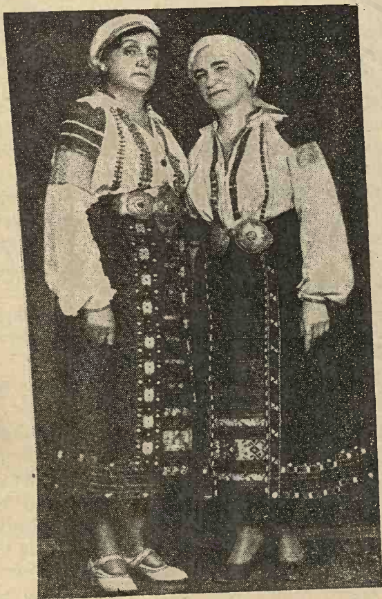
Costum național de sărbătoare al femeilor române din jud. Vâlcea.

Gulerașul, lat de un deget, este strâns pe gât și lodan (gros) sau puțin decoltat, încrețit cu feston (cusătură făcută pe mar-