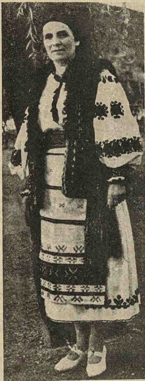
Port național de sărbătoare al sătencilor române din com. Gurani, plasa Vașcău, jud. Bihor

Acum treizeci de ani, mânecile se făceau din trei lați, n'aveau altiță, dar peste cot (în dreptul cotului) se izvodea un rând