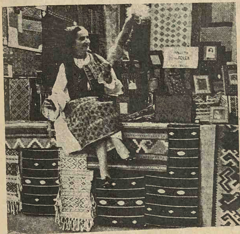
Interior de casă țărănească din comuna Buziaș, jud. Timiș-Torontal.

Peste cămașă îmbracă chintuș sau burdice (veste de lână albă) cu podoabe de cusături naționale în felurite colori. Iarna, peste burdice pun cojoace lungi până la glesne (cum sunt sa-