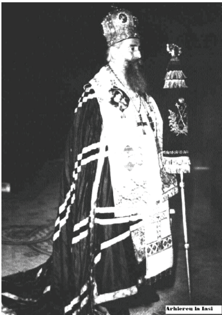
Grigorie Leu arhiepiscop vicar al Mitropoliei Moldovei cu titlul de : Botoșeneanul