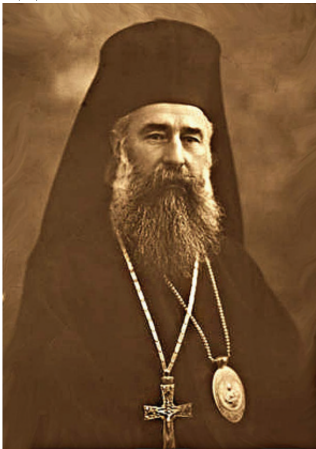
Episcopul Grigorie Leu al Argeșului -ales și întronizat în 1936-

din momentul răpirii lui din lumea liberă. Fapt important pentru noi, astăzi, este adevărul de necontestat că, în sânul Sfântului Sinod al Bisericii Ortodoxe Autocefale Române, a existat un grup puternic de ierarhi care s-au opus cât au putut bolșevizării țării și descreștinării populației, unii până la sacrificiul suprem, alții rămânând cel puțin mărturisitori neabătuți, al căror exemplu s-a continuat la celelalte generații în așa fel încât, chiar sub apăsarea dictaturii atee, conștiința Ortodoxiei ca Biserică Națională a Românilor s-a perpetuat întru salvarea Credinței și a tradiției strămoșești.