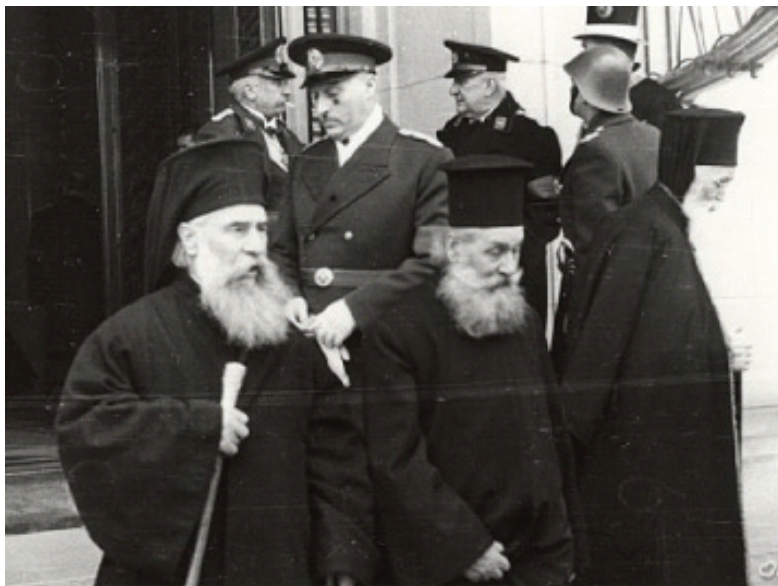
Ca episcop al Argesului, iesind de la palatul regal(1939) - in planul 2 se vad în uniforma FRN Constantin Argetoianu si Al. Vaida-Voievod -