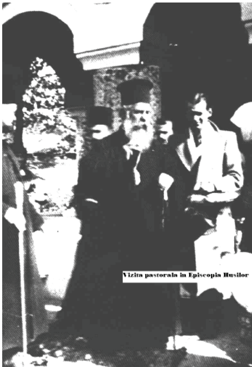
Vizita pastorală în Episcopia Husilor