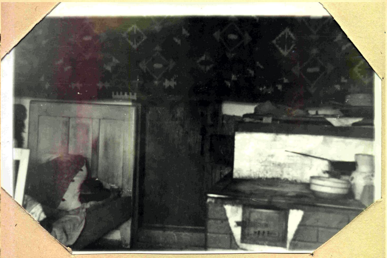
Fotografie reprezentând camera în care a locuit și a fost găsit Vasile Motrescu, în casa din comuna Gălănești, Raionul Rădăuți (ACNSAS, fond Documentar, dosar nr. 22, f. 31B)