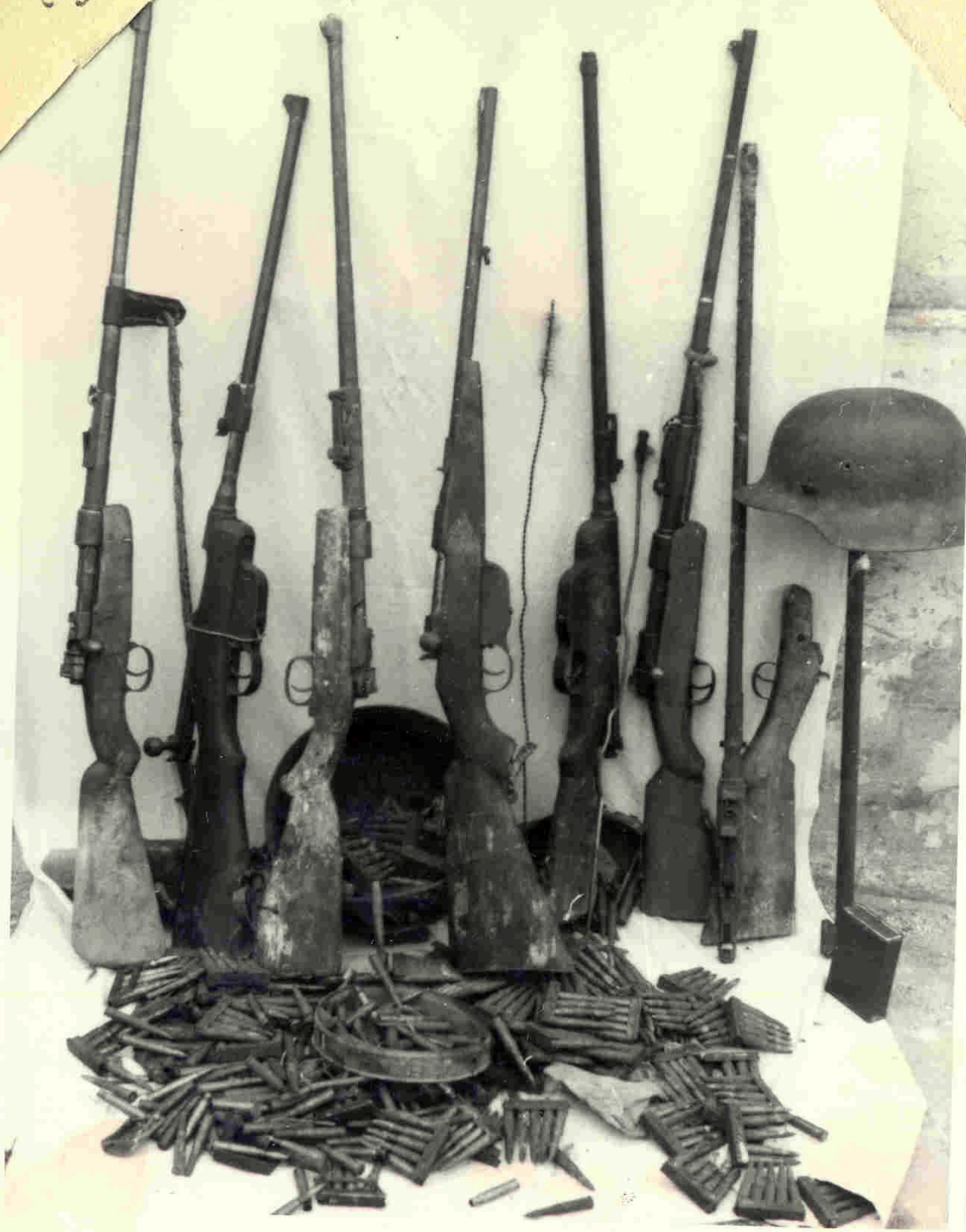
Armament și muniție identificate la membrii organizației conduse de Vasile Motrescu (ACNSAS, fond Documentar, dosar nr. 22, f. 31A)