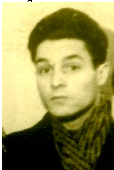
Student – anul II