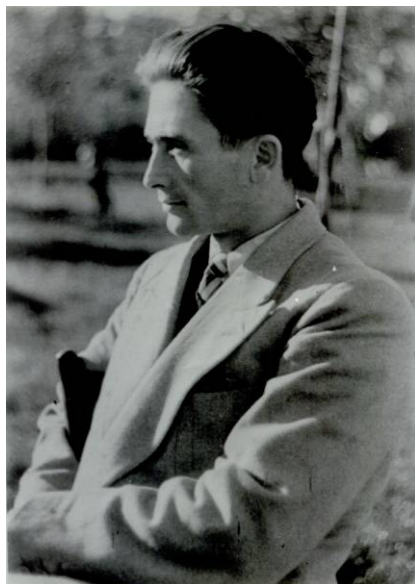
Nelu Golea – erou anticomunist