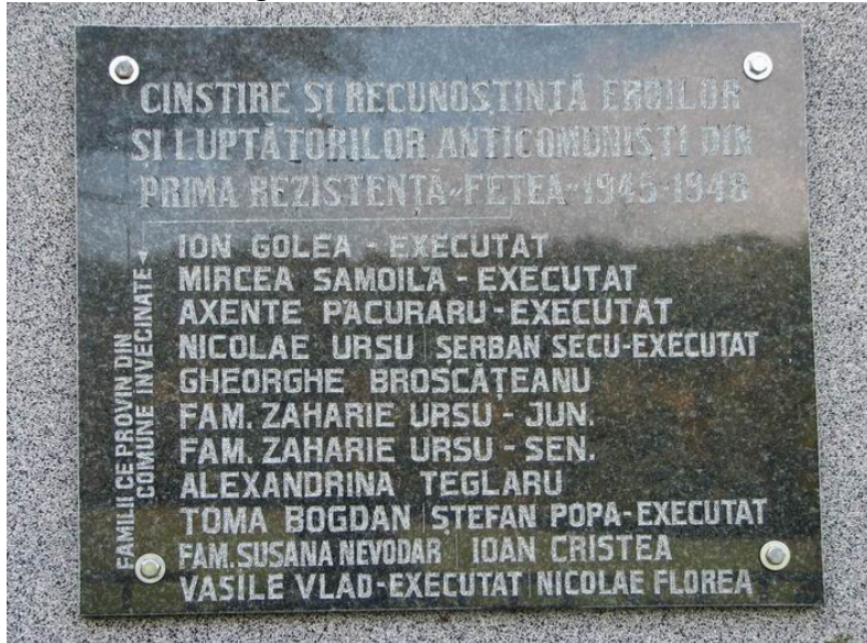
Placa monumentului din Fetea