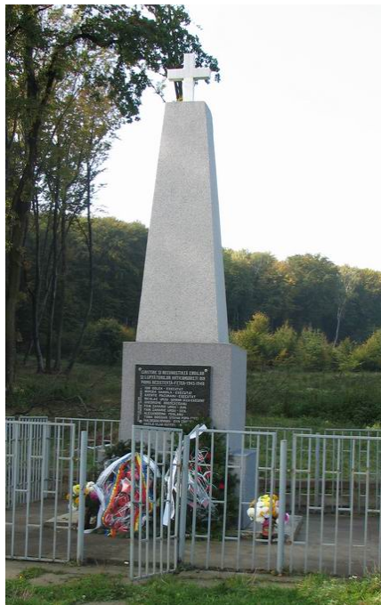
Monumentul din Fetea