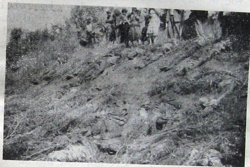
În grădina Consulatului italian, desgroparea celor uciși

au dat foc temniței peste cei închiși acolo; așa la Strășeni unde au fost împușcați doi învățători și câțiva gospodari; așa la Zăicani, la Cobusca nouă, la Răzeni și prin toate părțile. Fiecare localitate are ucișii săi, deportații săi, tot atâtea familii îndoliate și gospodării pustiite, mii de copii orfani de părinți și sute de părinți văduviți de copii. Iată care a fost durerea cumplită a Basarabiei; putea-va fi ea oare cuprinsă în cuvinte?