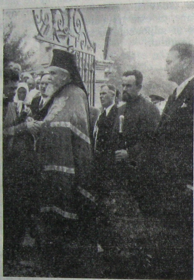
La intrarea bisericii voivodale din Orhei