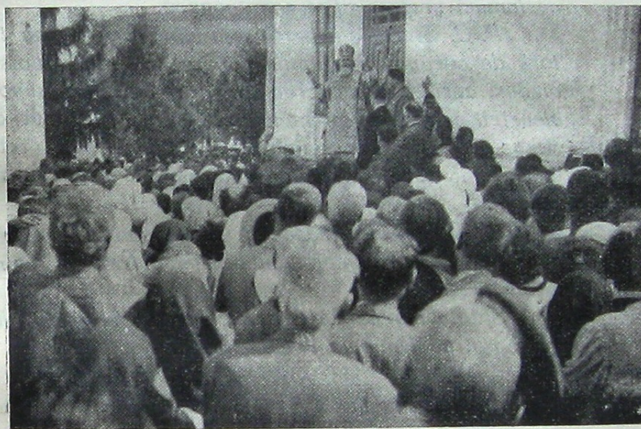
I. P. S. Sa Mitropolitul NICOLAE al Ardealului, vorbind mulțimii la Mănăstirea Curchiu

La mănăstirea Curchiu aflându-ne pe teritoriul județului Orhei, am avut deosebit de plăcuta sur-