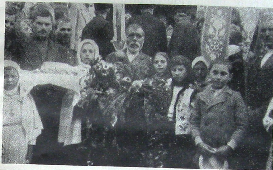
Poporul basarabean a ieșit cu florile bucuriei, cu pâine și sare intru întâmpinarea Înălților Ierarhi din Ardeal

Miercuri 10 Septembrie echipa misionară în frunte cu I. P. S. Sa, cu toată ploaia care nu mai contenea de două zile, se afla în com. Vorniceni. Această așezare de moldoveni de frunte se află la vreo 30 km spre apus de Chișinău, numărând la