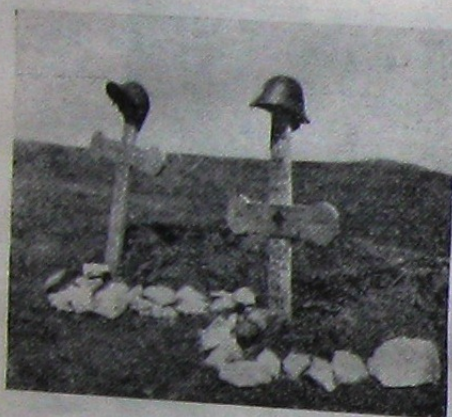
Pe culmea ce străjulește Chișinăul mormintele ostașilor români, căzuți vilejește

multe morminte de ostași eroi, cari au luat cu asalt Chișinăul. Drumul ține vre'o 3 k/m. un plai mănos, iar în marginea drumului tranșeele și diferitele adăposturi, mărturisesc trecătorului că pe aici s'au dat lupte dârze. Iată în stânga o vie mare, loc adăpostit, din care o companie sovietică pândea înaintarea spre Chișinău a coloanelor române spre a le decima.