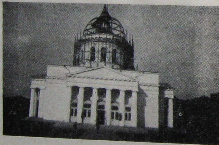
Soborul din Chișinău purtând semnele muceniciei Vezi pag. 17