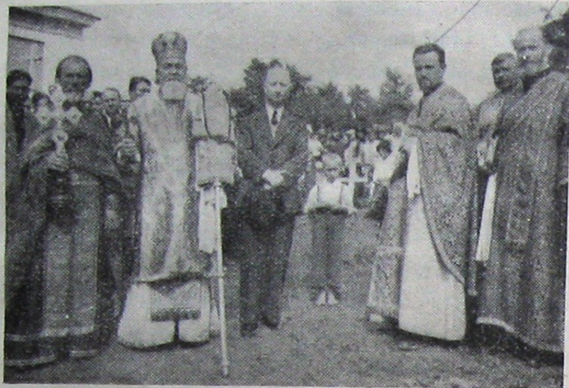
În cimitirul din Răzeni—Lăpușna : parastasul pentru cei 10 răzeși