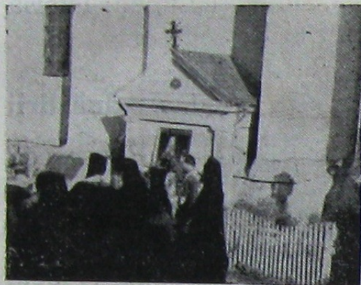
Mormântul lui Gavriil Bănulescu

Doborât de boală Mitropolitul Gavriil se retrage la 1819 căutând liniște în această mănăstire. Vreme