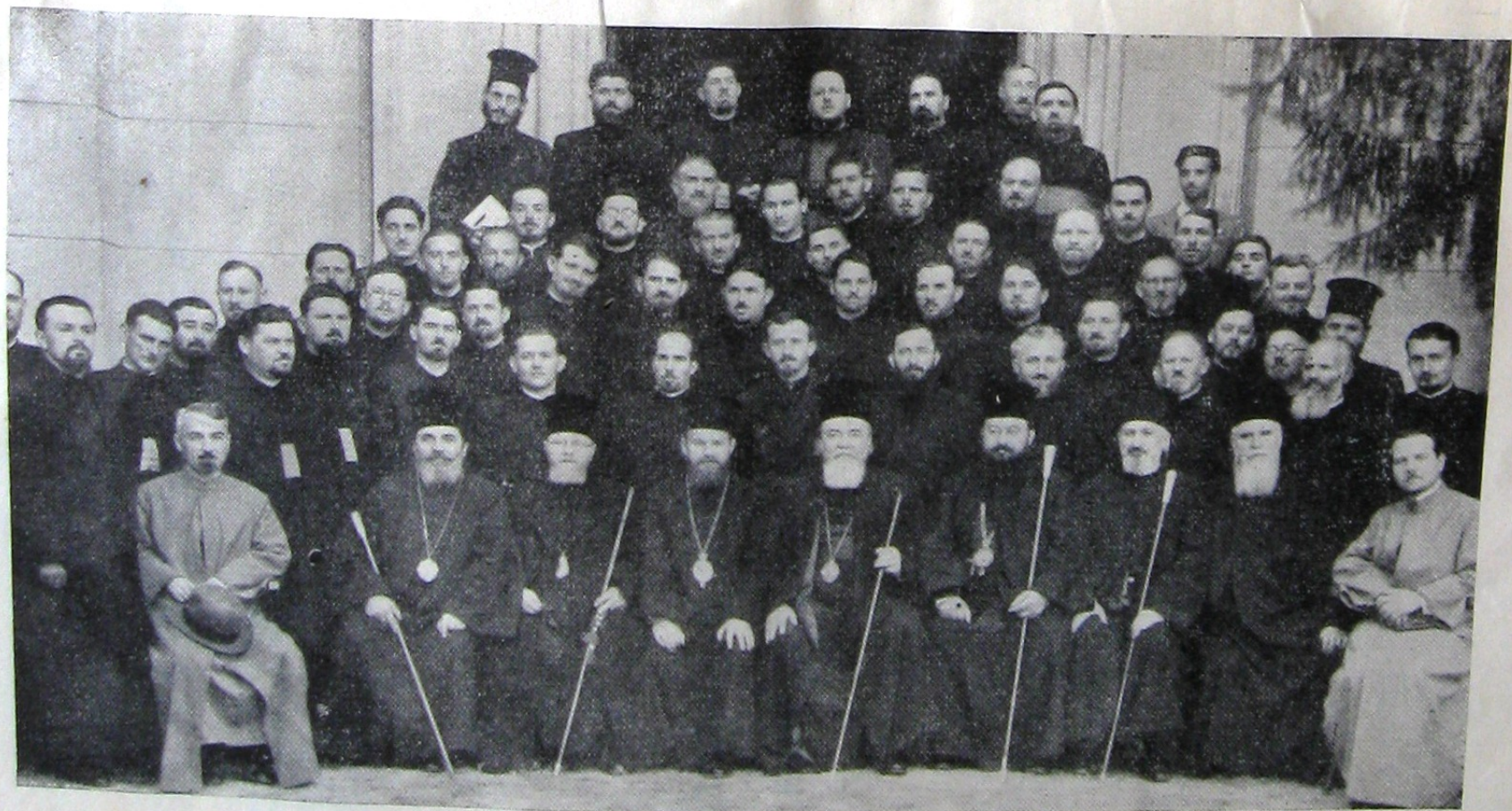
Membrii mistunii ardeleni pentru Basarabia, în popasul din București la biserica Radu-Vodă La mijloc I. P. S. Sa Mitropolitul NICOLAE al Ardealului, înconjurat de PP, SS. Lor Episcopii ardeleni și de preoți misionari