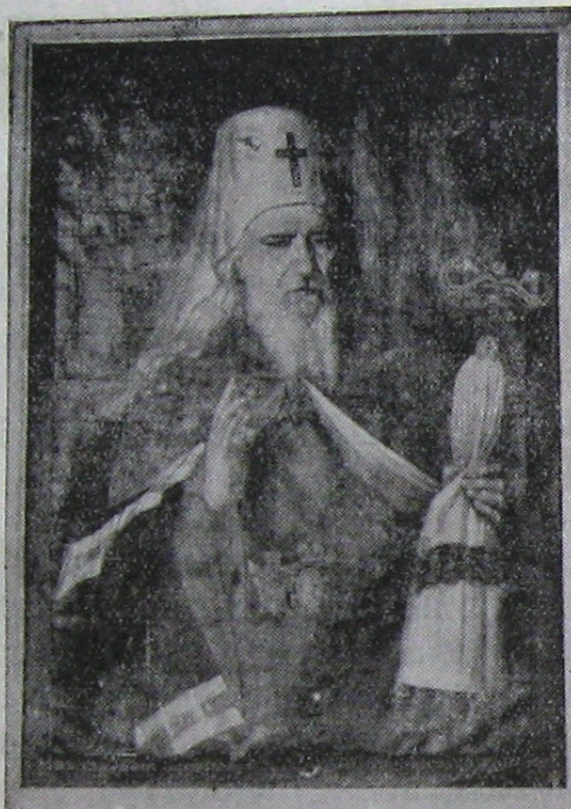
Mitropolitul Gavriil Bănulescu Bodoni

Descendent al unei familii fruntașe din Bistrița Năsăudului, Gavriil Bănulescu a făcut strălucite studii în Rusia, unde prin vrednicie personală a reușit să urce treptele cele mai înalte ale ierarhiei bisericești.