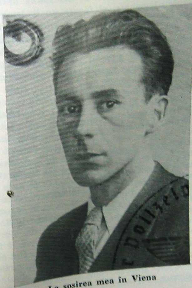
La sosirea mea în Viena