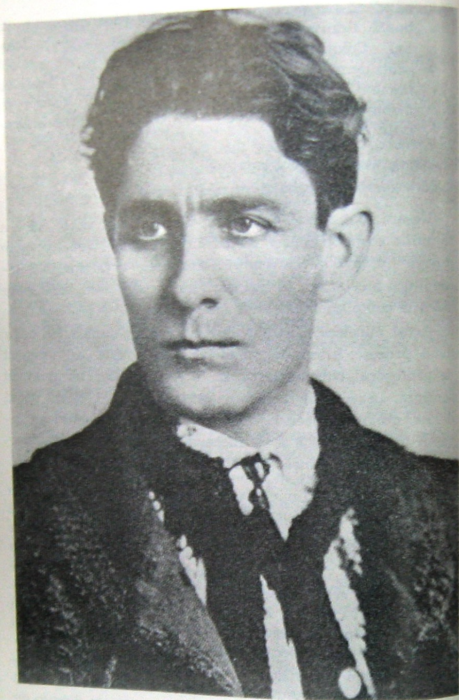
CORNELIU ZELEA CODREANU

cum numai Dumnezeu trimite... Dar pentru noi nu se iveau zorile, ci pocăința... Începutul unei suferinți în cursul căreia trebuia să plătească tot neamul..."