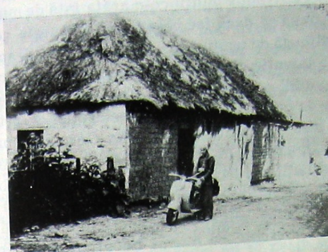
Johannesdorf: Baraca construită de prizonieri fotografie 1950

au făcut parte din companii de lucru și nu din unități combatante de front, situația lor fiind calificată ca atare.