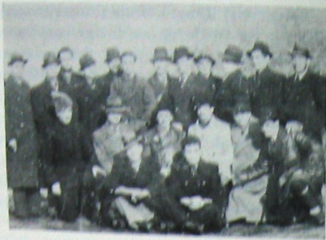
Grupul legionar din Gorna Bania