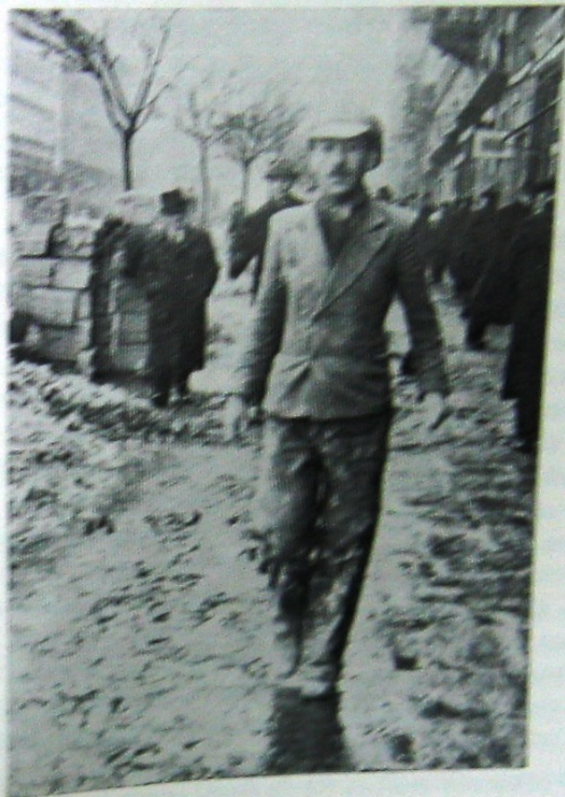
În timpul lucrului