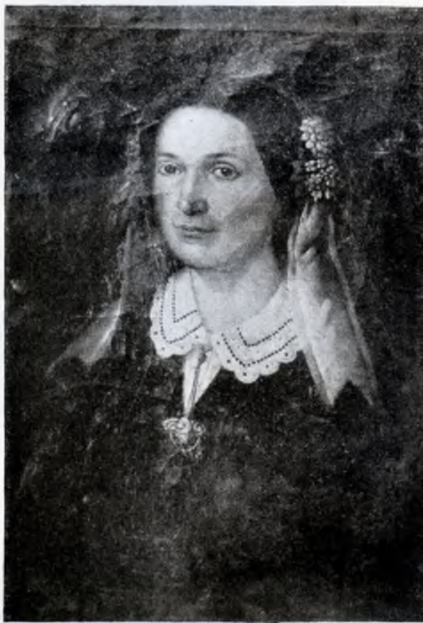
Mama pictorului Ep. Bucevschi, de un pictor necunoscut

În acest decret se arată și veniturile, de care avea să se bucure în noua sa funcție ca paroh: « Orânduita mijlocire a ținerii traiului Cucerniciei Sale după Rangul preotesesc spre Evlavie și Cinste Cinului și a legii să aibă Cucernicia Sa