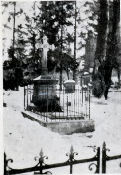
Mormântul lui Ep. Bucevschi în cimitirul dela Cernăuți