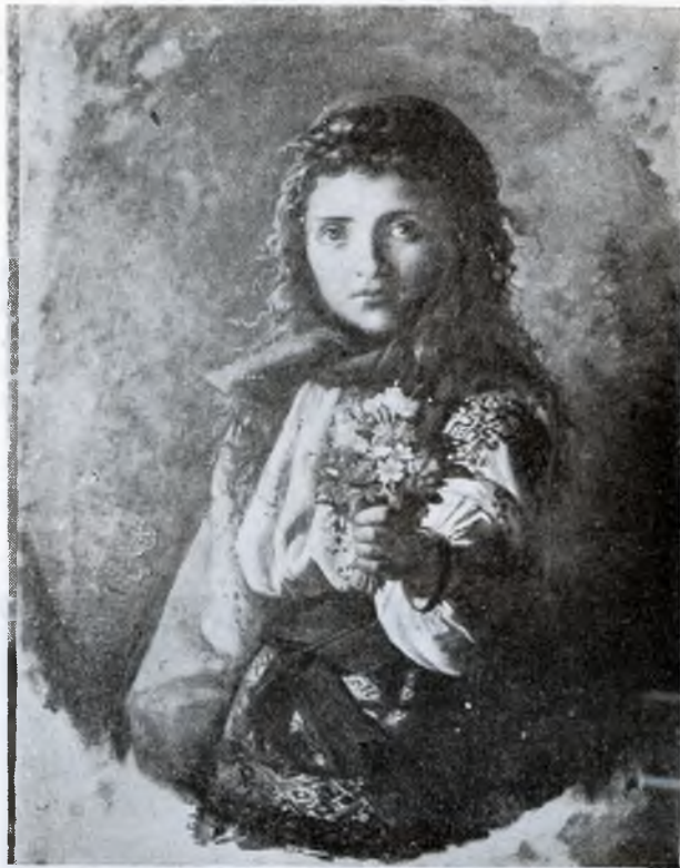
Mica florăreasă de Bucevschi

cipală strălucea marca României libere, dulce simbol al aspirațiilor noastre a tuturor, cum și alte diferite mărci ale țării românești ce compun Dacia, steme datorite penelului distinsului pictor Epaminonda Bucevschi.