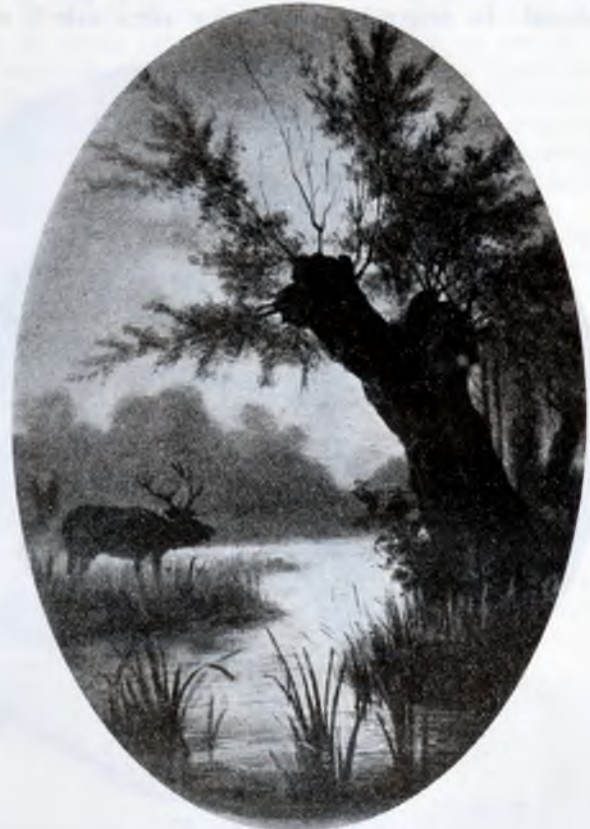
Faianță de Bucevschi

Cu privire la acest fapt trebuie să subliniem că între astfel de eminenți colegi, Bucevschi primește la 25 Iulie 1872 certificatul public al Academiei cesaro-regești de arte frumoase din Viena în care