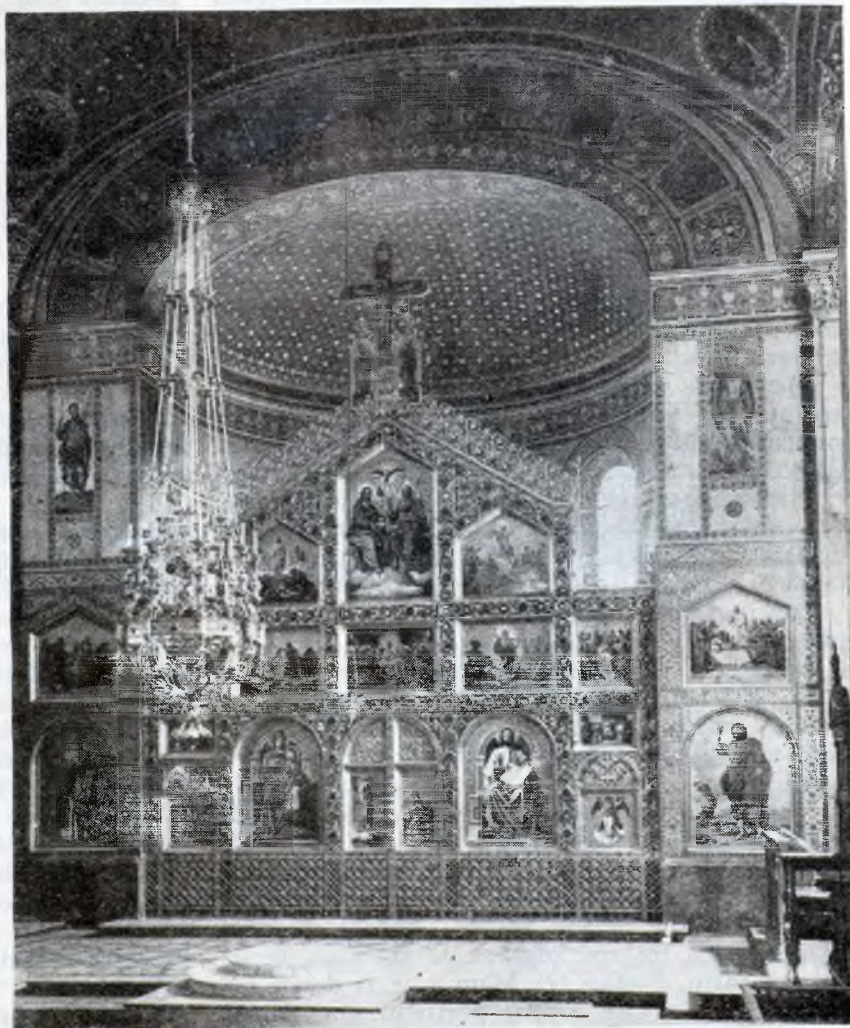
Altarul catedralei dela Zagreb, pictat de Bucevski

În adevăr, în cursul lunei Octomvrie 1881 pic-