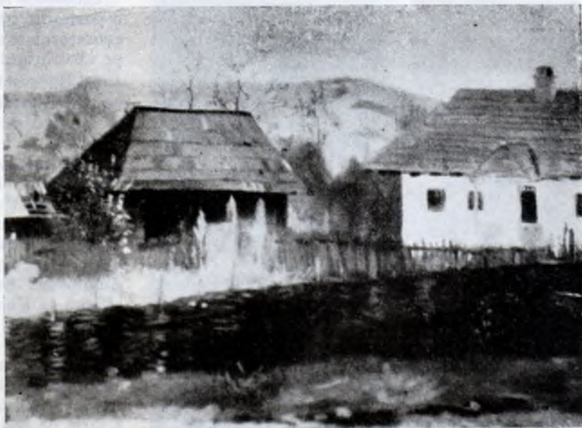
Casa părintească din Ilișești, de Bucevschi