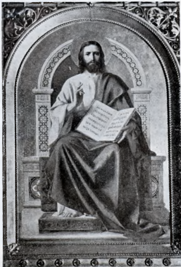
Mântuitorul (din altarul catedralei dela Zagreb) de Bucevschi

La sfârșitul anului 1883 Bucevschi răspunde la scrisorile Comitetului pentru clădirea bisericii din Poiana-Stampi din 9 și 23 Noembrie, arătând că e gata să execute în afară de tablourile din iconostas și celelalte picturi necesare. « În ce privește prețul nu am eu căderea să-l prevăd, fiindcă eu trebuie să mă orientez după devizul d-voastră. Prețul e foarte diferit, dela 1.000 florini până la 6.000 florini și mai mult (și pentru a fixa prețul