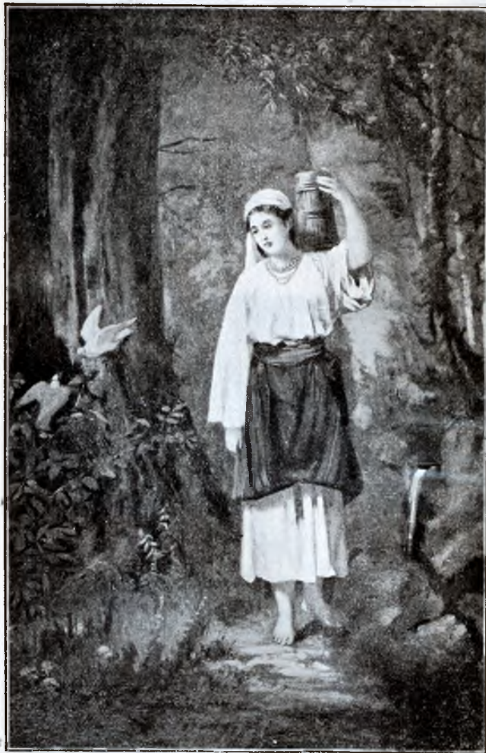
Doina de Bucevschi

Scrisorile sale ne fac a crede că sunt scrise în timpul de față, al șomajului intelectual.