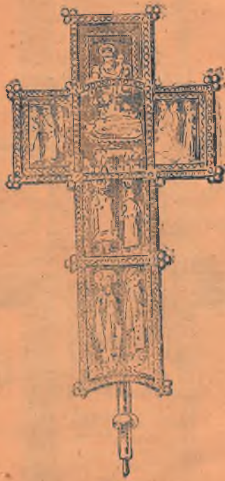
Intâia cruce cu care s'a servit la târnosirea monăstirii la 1695

«Și eți robul lui D-zeu cel mai mic, Mihail Spătaru Cantacuzino am luat pre D-zeu într'ajutor din totă vir-