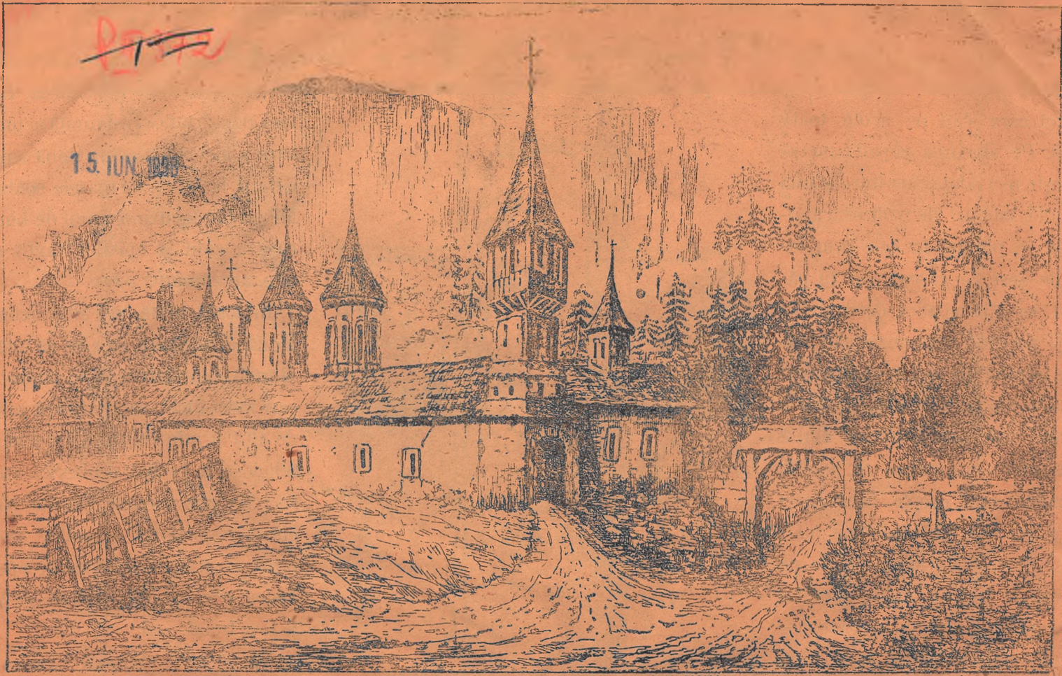
MONASTIREA SINAI A IN ANUL 1895

Tip. GUTENBERG, str. doamnei 23 Bucurasi.