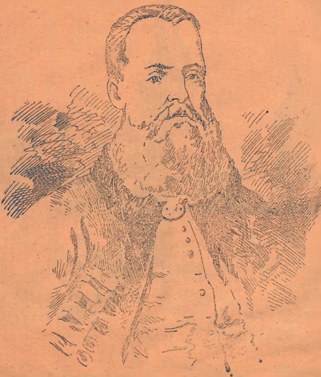
Marele Spătar Mihail Cantacuzino

Tatăl său, postelnicul Constantin, fu sugrumat în 1663 din porunca lui Grigore Ghica în pivnițele Monăstirei Znaovu. Din această pricină Cantacuzineștii, familia lui, după întâia lui domnie — căci Grigore Ghica a domnit de