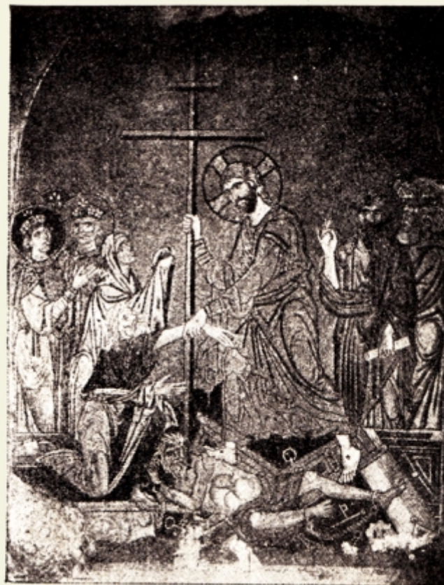
Fig. 12. — Coborirea în Iad. Biserica din Daphni, Man. d'art byzantin de Charles Diehl Vol. II. pag. 499.