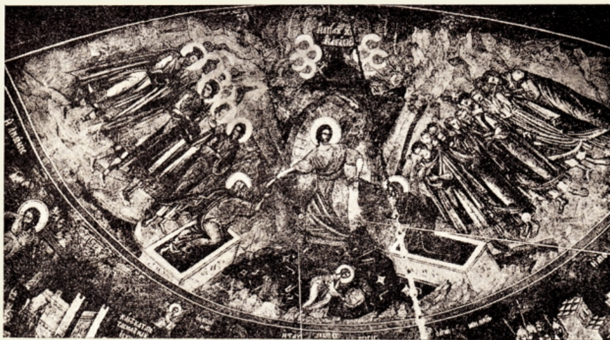
Fig. 15. — Bis. Catolicon din Lavra de la Sf. Munte. I. D. Ștefănescu. Biblia ilustrată, 1936. pl. LXXXII.

Aceiași icoană este lucrată în argint îmbobind legătura Sf. Evanghelii. De pildă pe