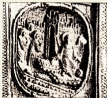
Fig. 19. — Detaliu după o cruce de la Dragomirna, din veac. XVI după I. D. Ștefănescu, op. cit. pl. II.