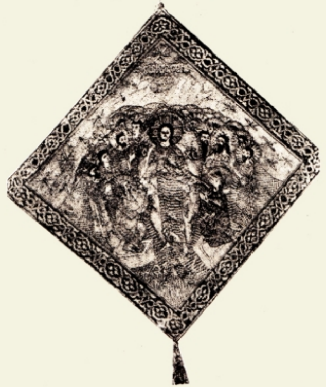
Fig. 21. — Epigonat de la Secu. Coborîrea la iad. Se vede Mântuitorul în aureolă și sfinți mulți în dos — în față Adam și Eva. După I. D. Ștefănescu, op. cit. pl. XVI fig. 2.

Și astăzi se zugrăvesc catedrale, în care