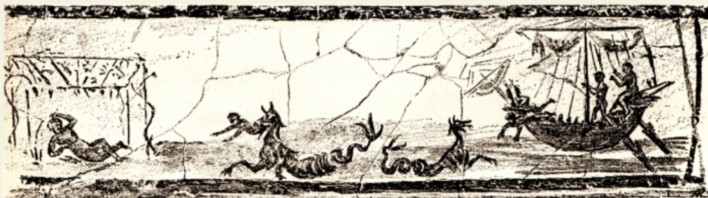
Fig. 1. — Frescă din catacomba Calist, Roma. Aci Iona singur se asvârle în apă. Fiara mării stă gata să-l înghită. Apoi după trei zile îl aruncă la mal. Dictionnaire d'Archeologie chrétienne et de Liturgie par Dom Cabrol et Dom Leclercq vol. VII col. 2581.

Dintre cele mai puternice probleme ce preocupa pe creștini, era problema mântuirii . Fiul lui Dumnezeu a venit în lume și prin jertfa lui ne-a rescumpărat din păcat,