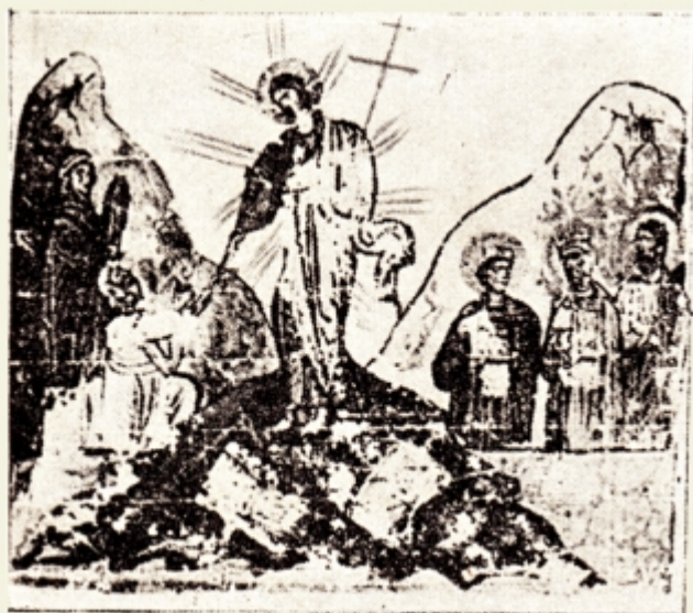
Fig 14 — Coborirea la iad, după evangheliarul Nr. 74 din Bibl. Națională din Paris, după I. D. Ștef. Biblia ilustr. pl. LXXXIII.

vede și cel-lalt chip al învierii Mântuitorul, coborând la iad, cu mâinile și picioarele purtând semnele cuielor, se întoarce la stânga și trage pe Adam din groapă spre sine 1) . La Stănești — Vâlcea, Mântuitorul are în mână un steag cu cruce pe care-l implântă