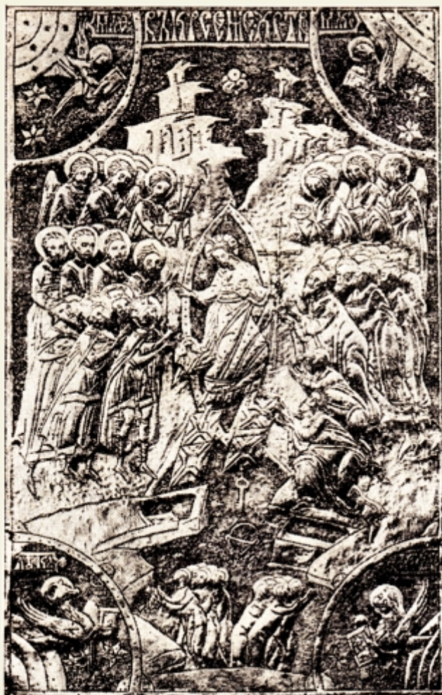
Fig. 18. — Coperta în argint a unei Ev. de la Sucevița din 1607, după I. D. Ștefănescu, L'evolution de la peinture religieuse en Bucovine et en Moldavie , 1928 pl. VI. 2.