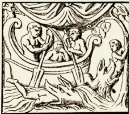
Fig. 2. — Detaliu de pe un sarcofaș dela cimitirul Sf. Agnès Roma. Sus Iona își acoperă fața. La stânga este înghițit de fiara mării și la dreapta este aruncat la mal. Aci Iona se vede tânăr și ceia ce-i curios e că este asvârlit în sus și se prinde de un copac. Dom Cabrol, op cit. Vol. VII, col. 2606.

pânește . De aceia merge plin de curaj mărturisind — făcându-se martor al adevărului creștin „Hristos este fiul lui Dumnezeu“. Cei ce-au înfruntat moartea, martirii, sânt cinștiți și mormintele lor împodobite. Siguranța că aceia — și toți cei care ca aceia vor înfrunta moartea trec în viață, o găesc în însăși învierea Domnului — în acele imagini ce se găesc în V. Test și în minunile din Evanghelie: Noe scapă din moarte prin credință — ca un al doilea Adam, el este strămoșul omenirii. El este un mântuit. Danil în groapa cu lei și tinerii în cuptorul din Babilon; așijderea povostea lui Iona (fig. 1) și trecând peste altele mai mărunte, învierea lui Lazăr . Aceste imagini se văd în catacombe — pe sarcofagii pe o-