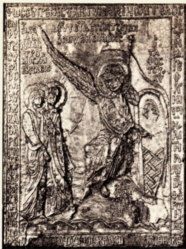
Fig. 7. — Femeile la mormânt. Ingerul arată locul gol unde se vede giulgiul și măhrama. (Matei 28.12) Placă de argint în relief, aurită — muzeul Luvru (Ch. Diehl, op. cit. II. pag. 682).

iar sub picioare moartea înlăntuită — porțile sfărâmate și două chei aruncate 1) ).