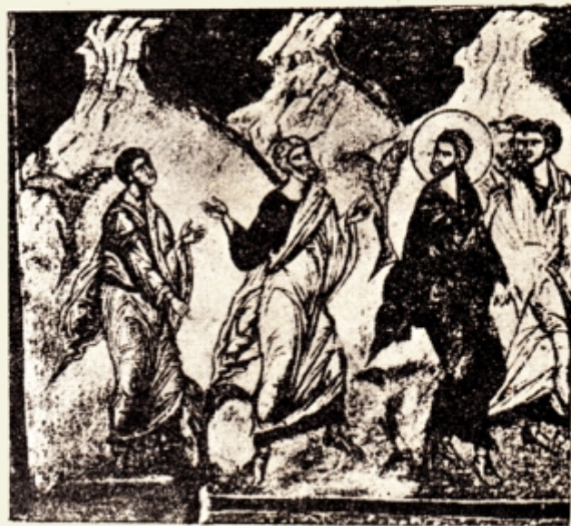
Fig. 9. — Ibidem. Mântuitorul se arată în Galileea. Intreita reașezare a lui Petru în demnitatea de apostol. (Ioan 21 v. 15—23). Bul. Com. Mon. Ist. p. 203 fig. 207.

Scena se amplifică se îmbogățește — cu cât înaintăm în timp — Așa ca la „Catolicon” în Lavra de la Sf. Munte — Mântui-