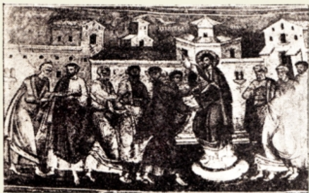
Fig. 11. — Arătarea Mântuitorului Apostolilor și lui Toma. Biserica lui Brâncoveanu din Făgăraș. Sec. XVIII. după I. D. Ștefănescu. La peinture religieuse en Valachie et en Transylvanie, 1936. planșa IX 1.

La Cozea, deși pictura este din veacul al XVIII din vremea lui Brâncoveanu, ea este reproducerea celui vechi din veacul al XIV-lea pentru că scena se vede în același chip tratată ca și la bisericuța bolniței de peste drum. La Țargoviște în bis. domnească, la Hurez, la Văcărești — chiar și la Făgăraș, unde se