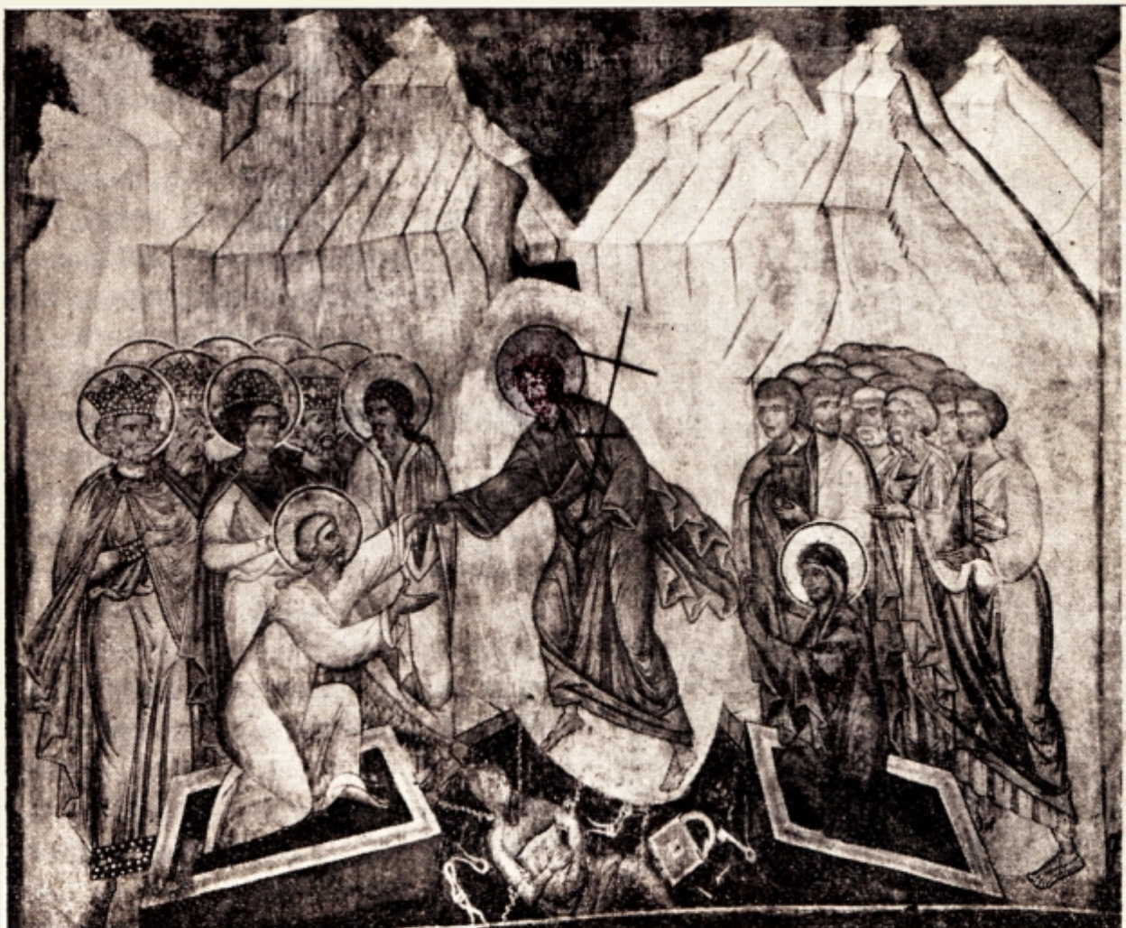
Fig. 16. — Biserica din Popăuți, jud. Botoșani — biserică zidită de Ștefan cel Mare — Pictură din veacul XV.

Și pe cruci se înfățișază învierea în ipostasul acesta. Așa la Dragomirna pe una Mântuitorul ține de mână pe Adam și Eva și calcă moartea în picioare, iar pe alta (1610) Mântuitorul are o cruce în mână cu trei brațe. (Fig. 19 și 20).