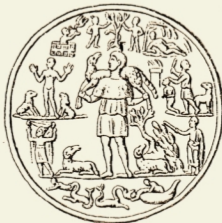
Fig. 3. — Un medalion de bronz din cimit. Pontian (Bibl. Vaticanului) din sec. III. Mântuitorul în ipostasul de Păstorul cel bun, cu oaia pe umeri și alte două la picioare. Sus Adam și Eva. Abel ucis de Cain. În stânga Noe în corabie. Mai jos Daniil în groapa cu lei. În dreapta jertfa lui Avraam și dedesubt Moisi în pustie scoate apă din stâncă. Jos de tot Iona aruncat în gura chitului și aruncat apoi pe mal. Cabrol. op. cit. Vol. VII, Col. 2622).

După edictul de la Milan (313), Biserica