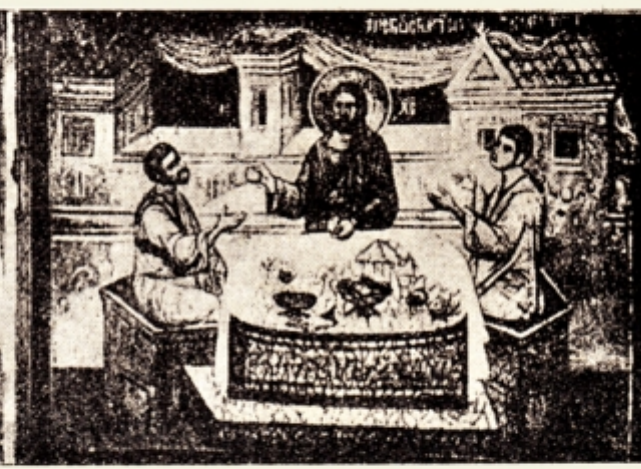
Fig. 10. — Mântuitorul se descoperă lui Luca și Cleopa (Luca 24 v. 31—35).

torul de și are în mână o cruce mare nu se mai sprijine pe ea ca la Daphni; cu dreapta ridică pe Adam, iar Eva stă în picioare în dos având toți dreptii din V. Test. În fața Domnului, Botezătorul cu David și Solomon—