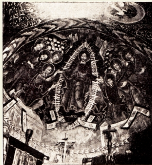
Fig. 17 — Biserică din Hunedoara.

III. Se naște acum o întrebare firească: de ce oare tocmai reprezentarea celei mai impresionante minuni, să nu fie înfățișată