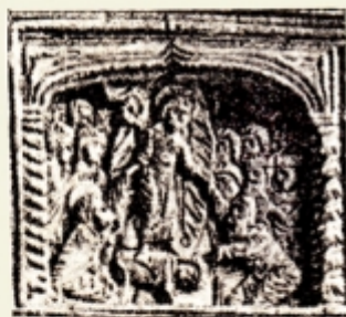
Fig. 20. — Detaliu după o cruce de la Mănăstirea Dragomirna din 1610, după I. D. Ștefănescu, op. cit. pl. I. 1.

aproape de loc până în veacul al VII-lea, iar în biserici până în veacul al IX-lea? Adevărul acesta, ce stârnește entuziasmul apostolilor și al tuturor propovăduitorilor, ce-au înfruntat moartea cu seninătate cum de-a fost înconjurat atâta vreme? Ar fi o explicare faptul că „semnul lui Iona” anunțat de Mântuitorul 1) se întâlnește la tot pasul.