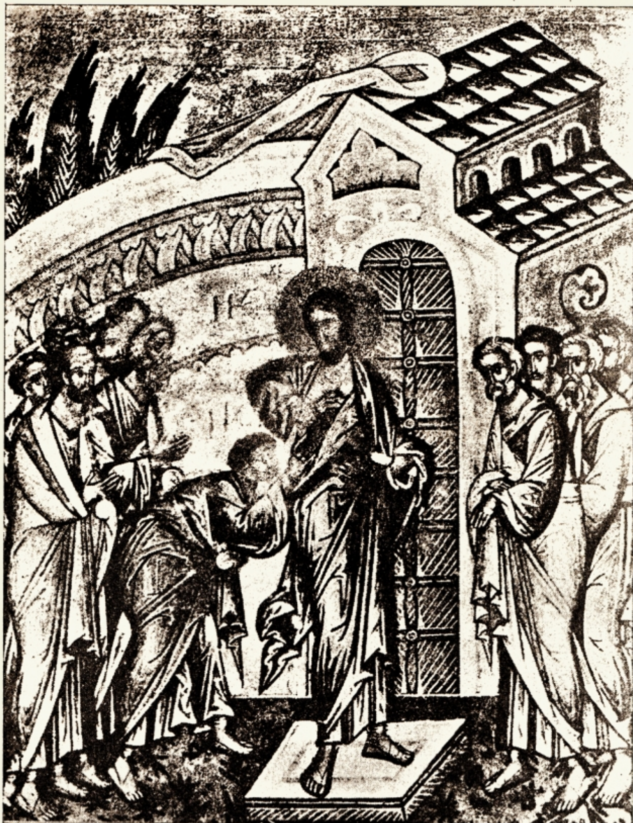
Fig. 6. — Arătarea Mântuitorului lui Toma necredinciosul (Ioan 20 V. 1929). După o icoană rusească din muzeul din Novgord, veac XI, reprodusă după I. D. Ștefănescu. Bibl. ilustrată. pl. LXXXVI.

grabă — La „Sf. Luca” din Focida — deși scena este mai săracă în personaje și nu se vede nici personificarea iadului totuși