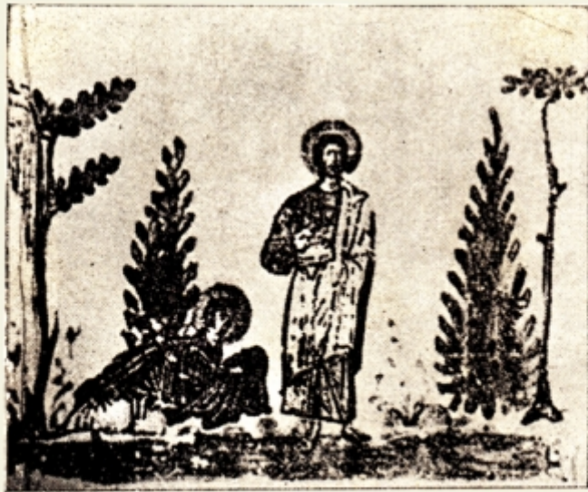
Fig. 75. — Arătarea Mântuitorului, după înviere, Mariei Magdalina (Ioan 20 . VII—18). Miniatură pe pergament din veac. XI-lea, Evangheliarul Nr. 74 din Biblioteca Națională din Paris. (după I. Ștefănescu Biblia ilustrată 1936. Mân. Neamț pl. XXXIII).

disputele teologice — și că de multe ori ajută și el cu ceva la lămurirea problemelor. În ce privește Învierea, e arătată în scene ce se succed înfățișând pe Mântuitorul după scularea din mormânt. O scenă de felul acesta se vede la Biserica Apolinarie cel nou din Ravena (sec. IX). Mozaicul ne înfățișează pe cele două femei mirate că văd mormântul gol. În fața lor Ingerul stând le liniștește: „A înviat nu este aici”— Mormântul stilizat cu coloane și coperiș. La San Marco (veac XI) scena este de-o frumusețe rară—Mântuitorul se arată Mariei Magdalina care la picioarele Lui—este oprită să nu se atingă de el. (Matei 28 v. 9—10; Ioan 22 v. 11—18). Și imediat în continuare în același cadru —