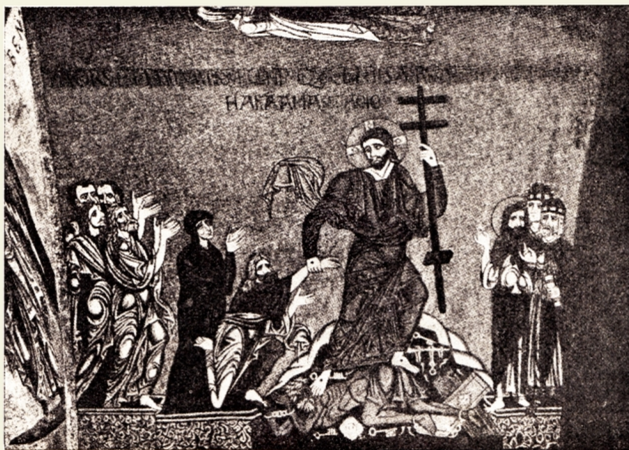
Fig. 13. — San Marco — Veneția — Mozaic din veac. XI, după Ch. Diehl op. cit. pag. 640.