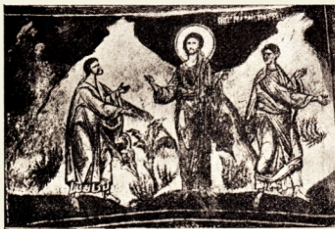
Fig. 8. — Curtea de Argeș. Biserica Domnească. Mântuitorul se arată ucenicilor Luca și Cleopa în drum spre Emmaus. (Marcu 16 v. 13) Bul. Com. Mon. Ist. an X—XVI 1917—1923 p. 200 fig. 204.

torul de și are în mână o cruce mare nu se mai sprijine pe ea ca la Daphni; cu dreapta ridică pe Adam, iar Eva stă în picioare în dos având toți dreptii din V. Test. În fața Domnului, Botezătorul cu David și Solomon—