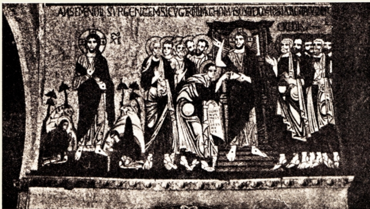
Fig. 4. — Arătările Mântuitorului. Mozaic din San Marco, Veneția. După Manuel d'art Byzantin de Charles Diehl, II pag. 540.

să atace acest subiect. Tocmai târziu de tot în veacul al IX apare scena învierii pe monumente luate desigur din manuscrise 1) . Ea este reprezentată în două chipuri. Sau se ilustrează arătările și momentele mai de samă de după Înviere, cum este relatată de evanghelie, sau se înfățișază actul izbăvirii neamului omenesc din păcat, prin eliberarea „din legăturile morții“ a strămosului Adam și a Evei, adică scoborârea la iad, după cum scrie Sf. Ap. Petru (I Petru 3, v 19. 20).