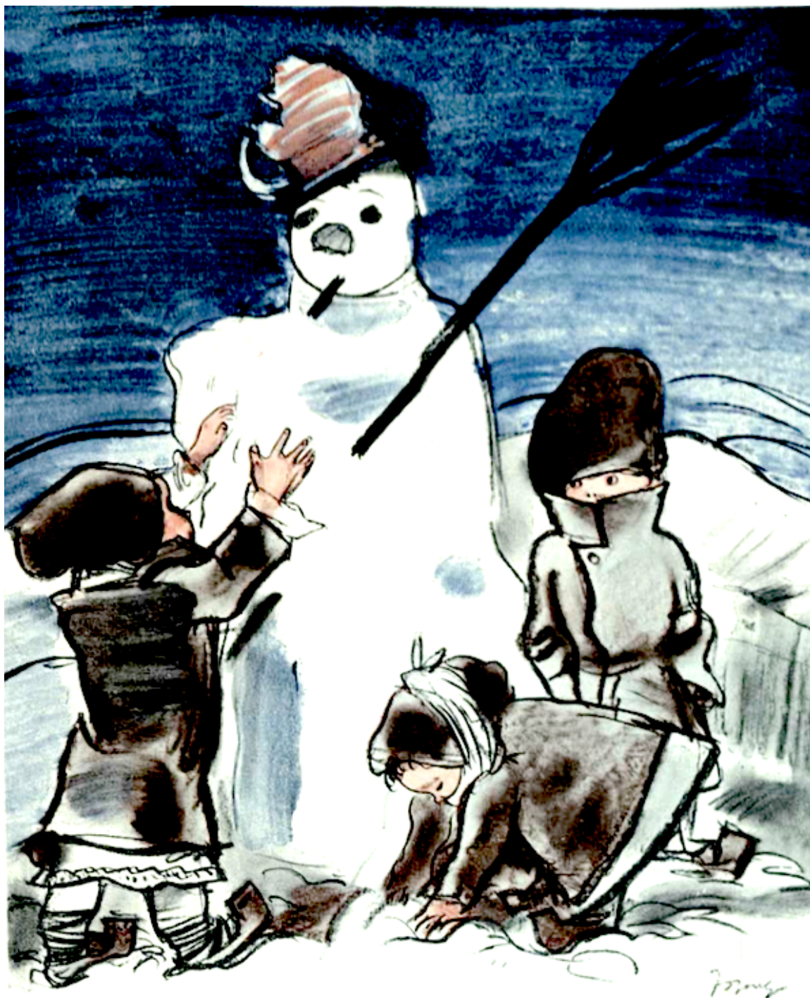
Ilustrația: Aurel Jiquidi. Revista "România" , Anul II, Nr. 2, Februarie 1937