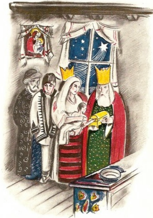
Desenul: Radu Boureanu. Revista " România ", Anul II, Nr. 12, Decembrie 1937

Revista " Solia " (The Herald), Jackson, Decembrie, 1993