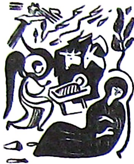
Grafica: Demian. Revista "Dacia", Rio de Janeiro. Anul XIII, Decembrie 1958.

Revista "Luceafărul", Timisoara. Anul I, Nr. 12, Decembrie 1935.