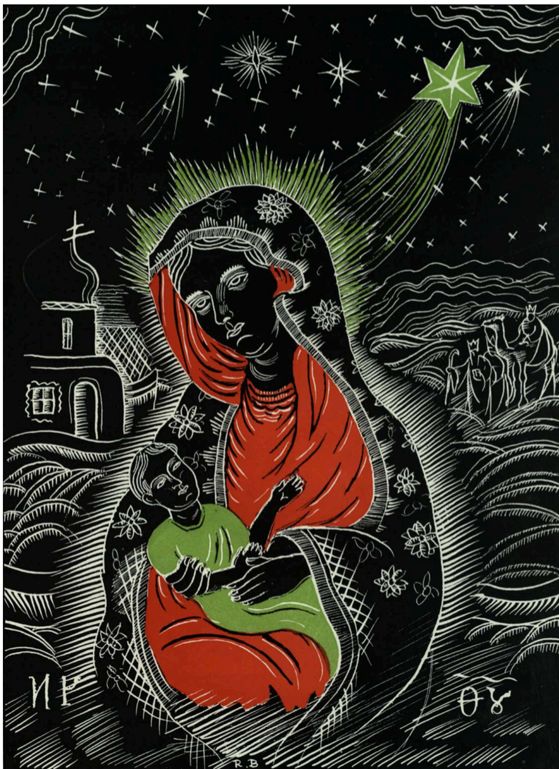
Grafica: Radu Bouréanu. Revista "România" , Anul II, Nr. 12, Decembrie 1937