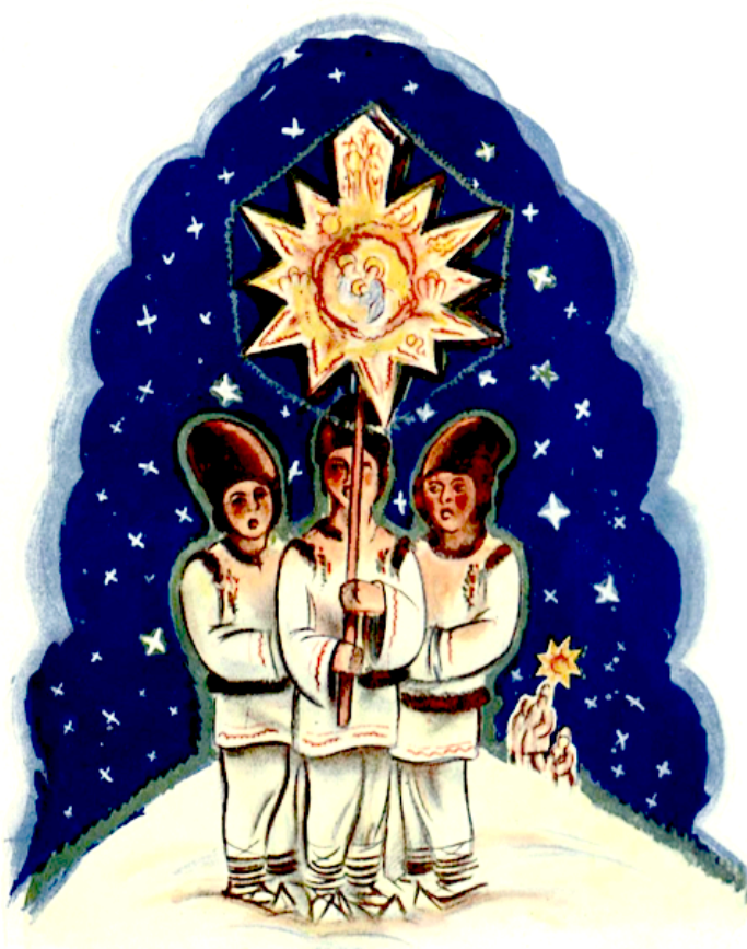
Desenul: Radu Boureanu. Revista " România ", Anul I, Nr. 12, Decembrie, 1936

(Fragment din articolul cu titlul de mai sus apărut în ziarul " Brațul de Fier ", Anul I, Nr. 7, Decembrie 1935)