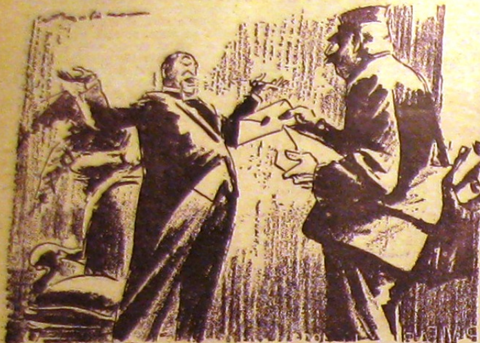
LARGO CABALLERO (poștaşului): Trebuie ca să-ți repet în fiecare zi că scrisorile adresate guvernului din Valencia trebuie trimise mai întâiu la Moscova?! (Bertholdo)