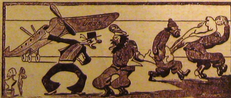
— Tovarășe rus, dar avionul acesta n'are decât o aripă! — Ce vrei mai mult? Statuia voastră nu are numai o singură mână?! (420)