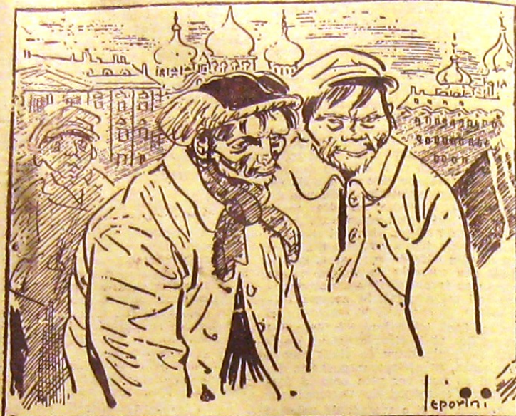
— Este adevărat că nu sunt voluntari ruși în Spania? — Voluntari, nu. Trimși forțat, da.