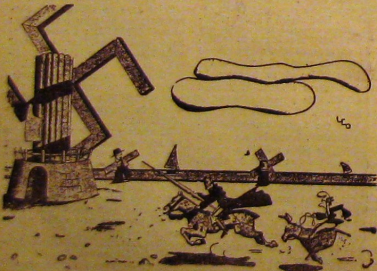
Don Quichotte și morile de vânt