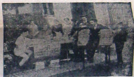
Pe vremea luptelor studentești din 1922, Ionel Moța scrie scrisori către studenți în curtea casei dela Orăștie