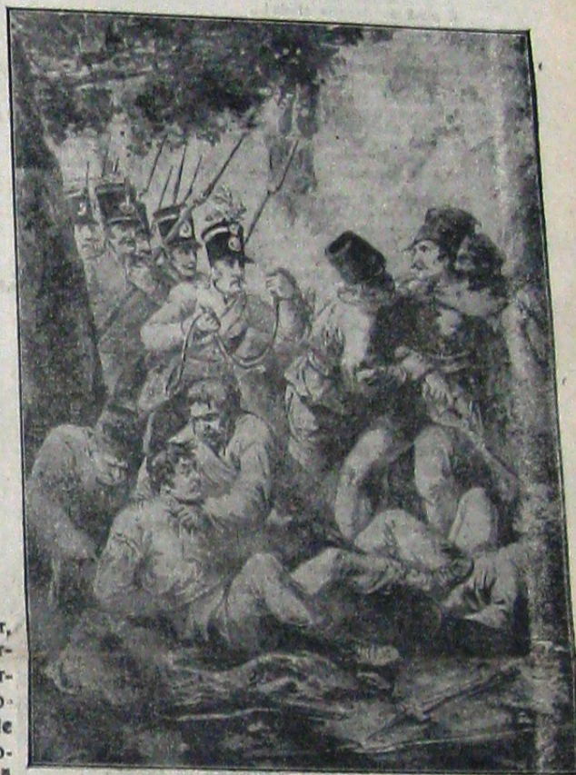
Prinderea lui Horia, Cloșca și Crișan