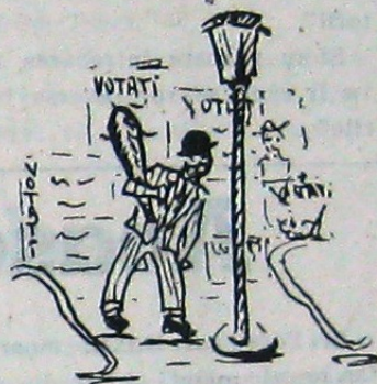
Dăm date statistice din Fran-

Deși vorbim de fapte din anul trecut, nu ne referim la abdicarea regelui Leopold al Belgiei, după ce obținuse majoritate de voturi, nici la farsa din Bolivia, unde doctorul Paz Extensoro, după o lungă opoziție, câștiga în alegeri președinția republicei, dar n'o primea pentru că un grup de militari supuși marilor companii miniere preluau guvernul "ca să salveze democrația"! Nu!