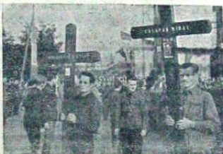
Cruciile verzi spre cimitirul legionar

nu nădăjduia s'o trăiască, dar pe care o vedem profilîndu-se mărș în zarea îndepățăță a viitorului, că stănta lor nebunie n'a murit, că legionarii le-au purtat tortele biruitoare prin cele mai groznicie întunecimi de răutate, de ură, de trădare, de cruzime, de bestialitate satanică. Simțeam și parcă vedeam cum se liniștea somnul strămoșilor,