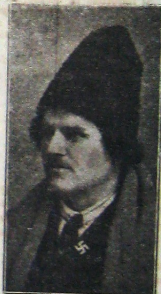
COLONEL ION NICULCEA ales la Suceava