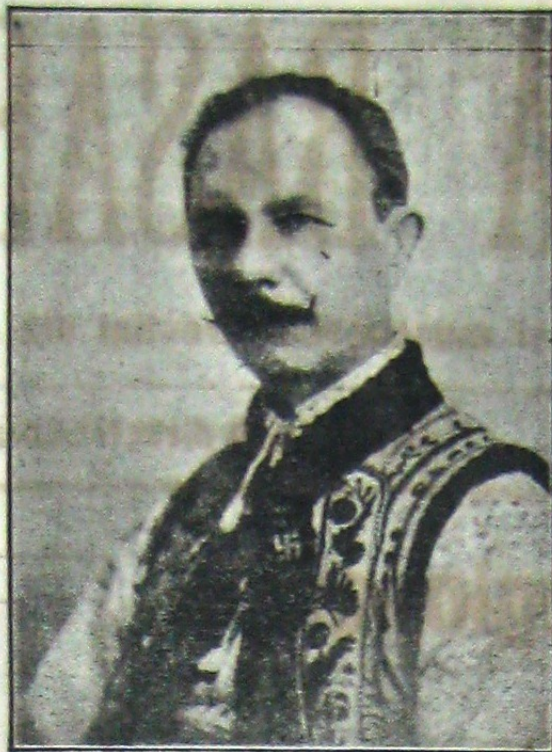
ION ZELEA CODREANU ales la Cövurlui