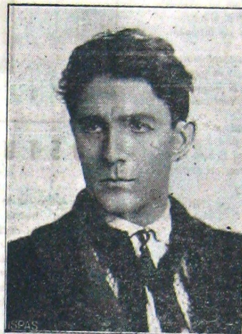
CORNELIU ZELEA CODREANU ales la Neamț, Cahul și Turda