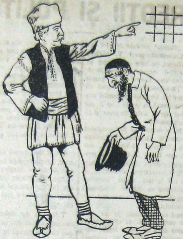
Așa va fi salutat și respectat Țăranul Român în Patria lui, când va învinge semnul nostru.