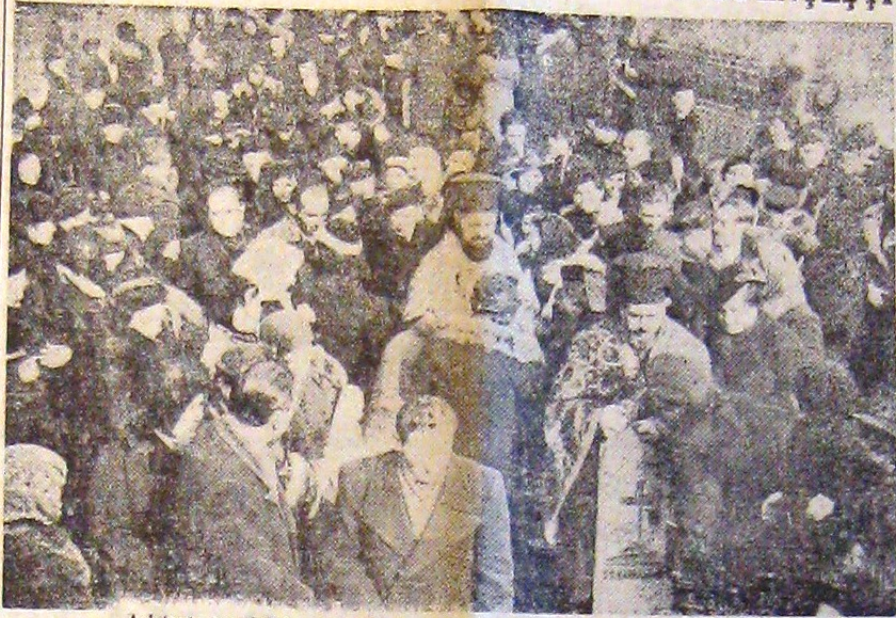
Asistența creștină la serbarea hramului bisericii studențești „Sf. Anton” (Reportajul în corpul ziarului)