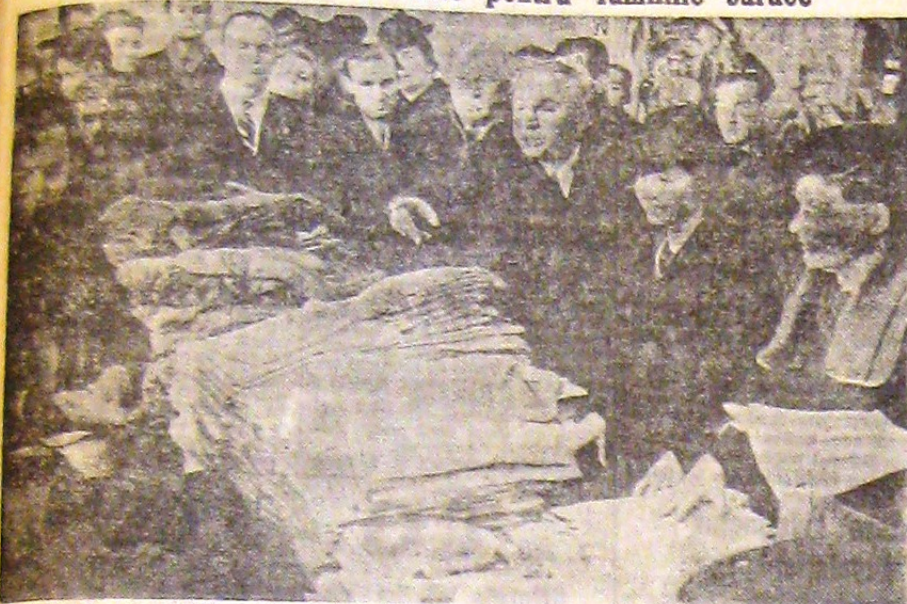
D-na General Antonescu împarte îmbrăcăminte copiilor săraci din comuna Militari

D-sa a distribuit eri în suburbana Militari îmbrăcăminte pentru copii și alimente pentru familiile sărace