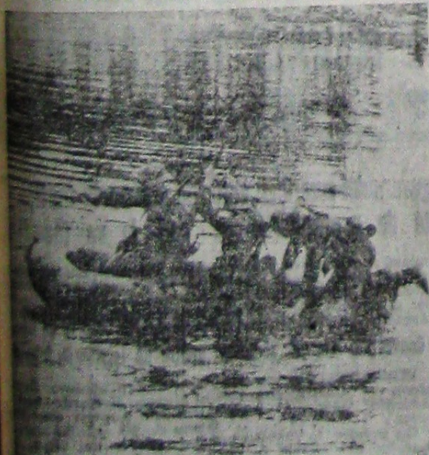
Infanteria germană trecerea marilor fluviu nu este o problemă. Bărcile de cauciuc, ușoare de transportat, se montează în 5 minute