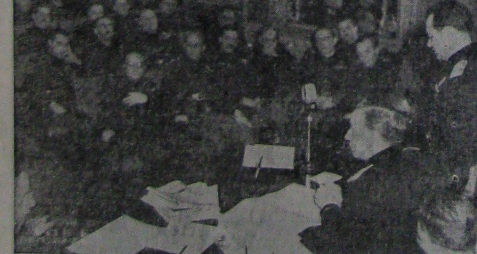
Secretarul Partidului Fascist Italian își citește darea de seamă în fața Consiliului Director al Președinției Provinciali și Institutului Național de Cultură Fascistă