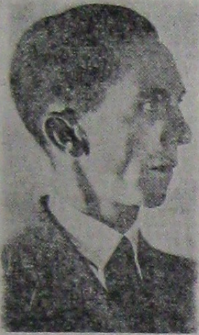
D. Dr. GOEBBELS

Japonia cunoaște astăzi același mișcare de preface, ca și Reichul și datorită acestui fapt, ea se poate substitui Reichului.