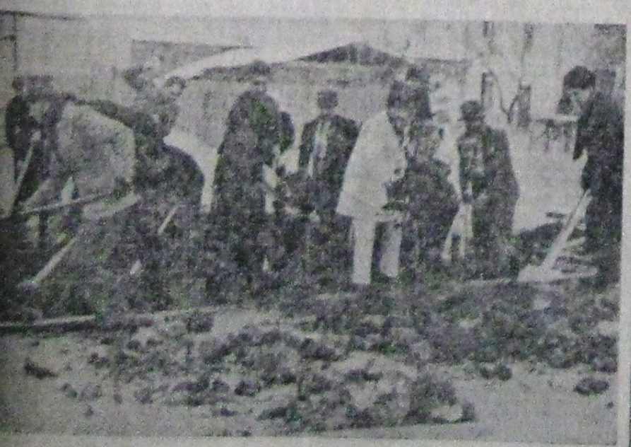
Școlarii și comandanții „Bunzi Vestiri” săpând la Casa Verde...