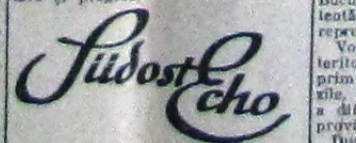
Revista publică în numărul său de...