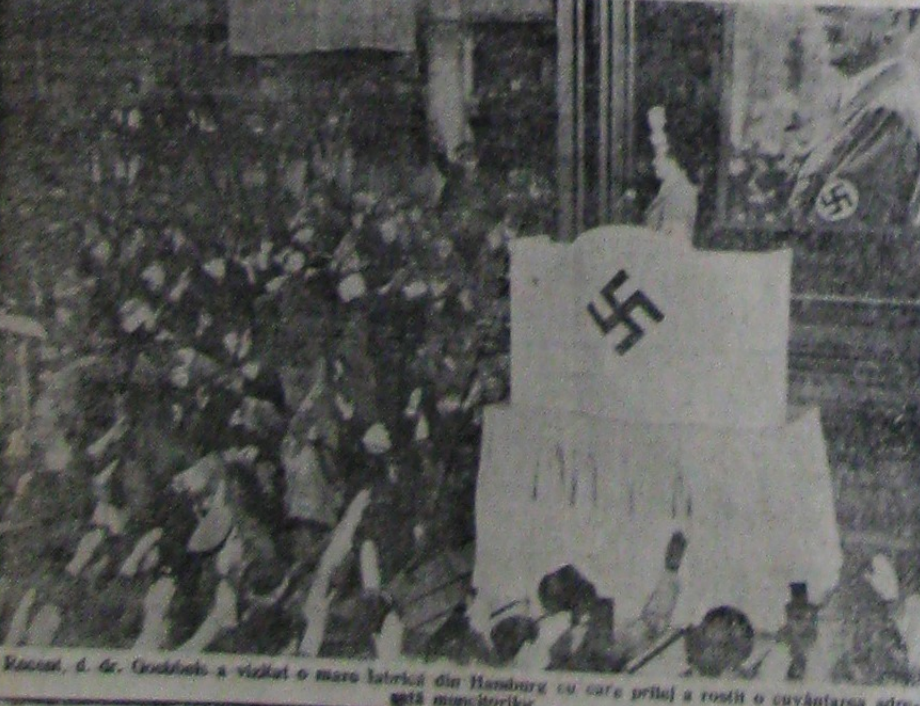
Goebbels, d. dr. Goebbels a vizitat o mare lăcătură din Hamburg cu care primește o cuvântare adresată muncitorilor