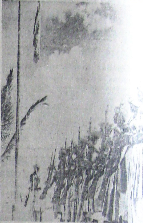
Tropele indigene din armatele italiene care au luptat în orașul Bardia au dat dovadă de mult curaj și de multă vitejie