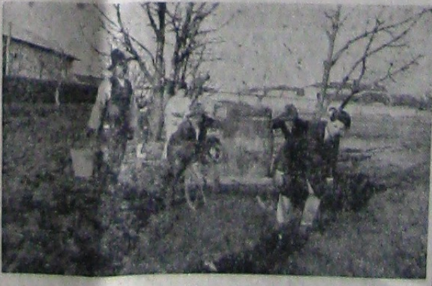
În anul 1924, Capitanul a înființat la Iași, pe locul pus la dispoziție de d-na Ghica, o grădiniță pentru aprovizionarea cămarărilor dela Ungheni