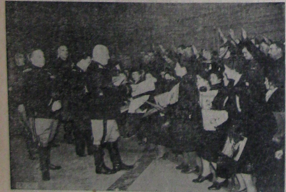
Cu prilejul „Zilei Mamei și a Copilului”, Ducele a primit la Palatul „Venezia” 184 de perechi de căsătorii cu cel mai numeros copii, cărora le-a oferit daruri și diplome

Numele vaporului nu este încă cunoscut. Armatorii cred că nu poate fi vorba de cât de vaporul britanic „Nalgora”, de 8.579 tone, care se afla la 1.000 mile de locul arătat prin mesajul captat și care semnală prezenta în împrejurimi a unui vas suspect.