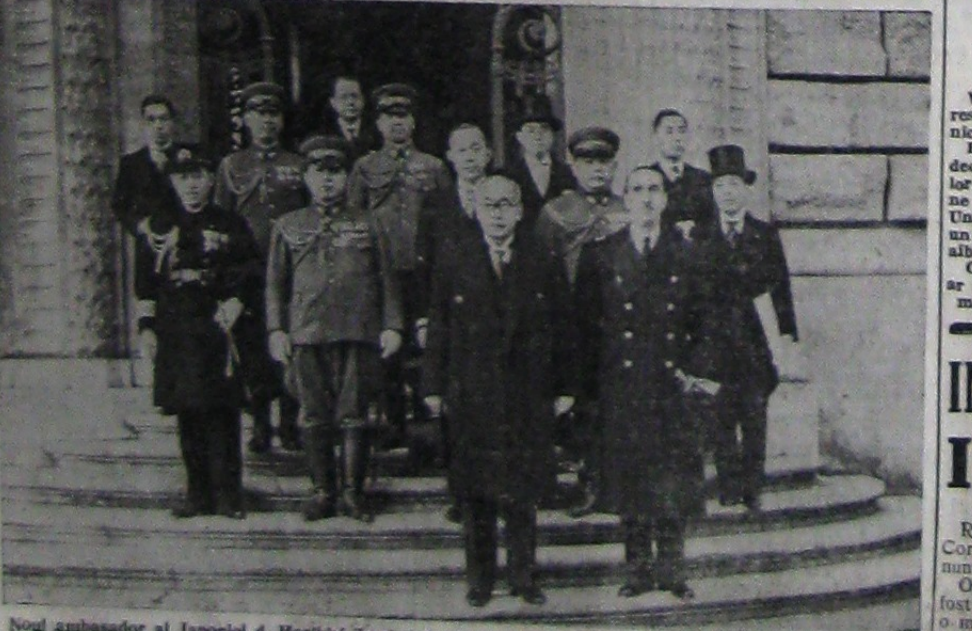
Noul ambasador al Japoniei d. Horikiri Zembai după prezentarea scrisorilor de acreditare Regelui Impărat al Italiei

NEW-YORK, 26 (Rador). — Corespondentul agenției „Herald Tribune” transmite: După cum este știut, zilele de Crăciun au dus la un număr de morți înscăpat. Se semnalează 137 persoane și-au pierdut viața în mod tragic în timpul sărbătorilor de Crăciun, carel 115 din cauza accidentelor circulației.