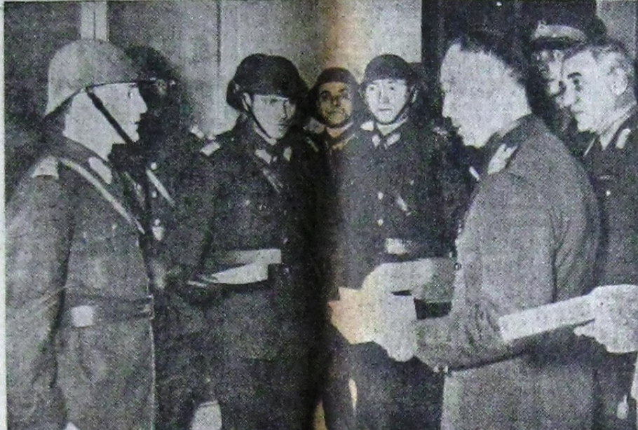
D. general Antonescu împărțind daruri ostașilor, de sărbători