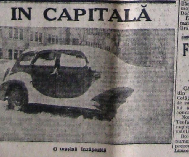
O mașină înzăpezită