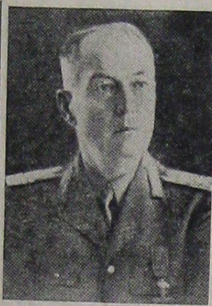
D. GENERAL ANTONESCU

In ziua de 20 Decembrie 1940, s'a ținut un Consiliu de Cabinet, prezidat de d. Generalul Antonescu, în desbaterea cărora s'au luat următoarele hotărâri: