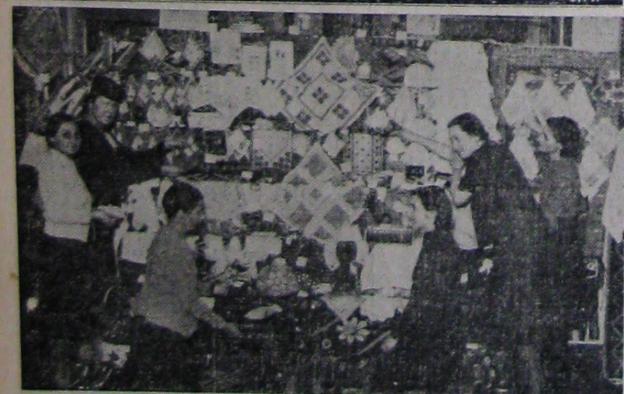
Unul din standurile Călușoșilor de zi care s'a inaugurat ieri la sala Dalles din Capitală