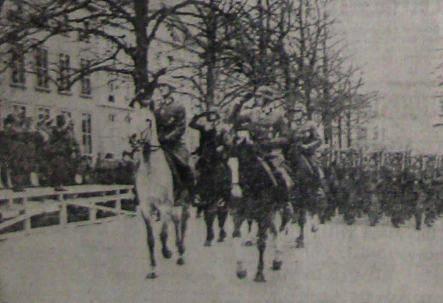
În prezența generalului de infanterie von Briesen s'a desfășurat zilele trecute o paradă militară germană la Haga