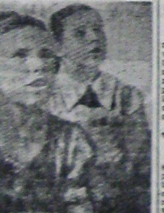
La serbarea din Miercuri, elevii pe care îi însoțește la o serbarea închinată la aniversarea marelui mareșal.