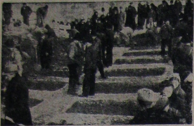
Au fost săpate zeci de gropi

LUPENI, 16. — Casa Centrală a Asigurărilor Sociale a pus la dispoziția operii de ajutorare a familiilor victimelor dela Lupeni, suma de 500.000 lei.