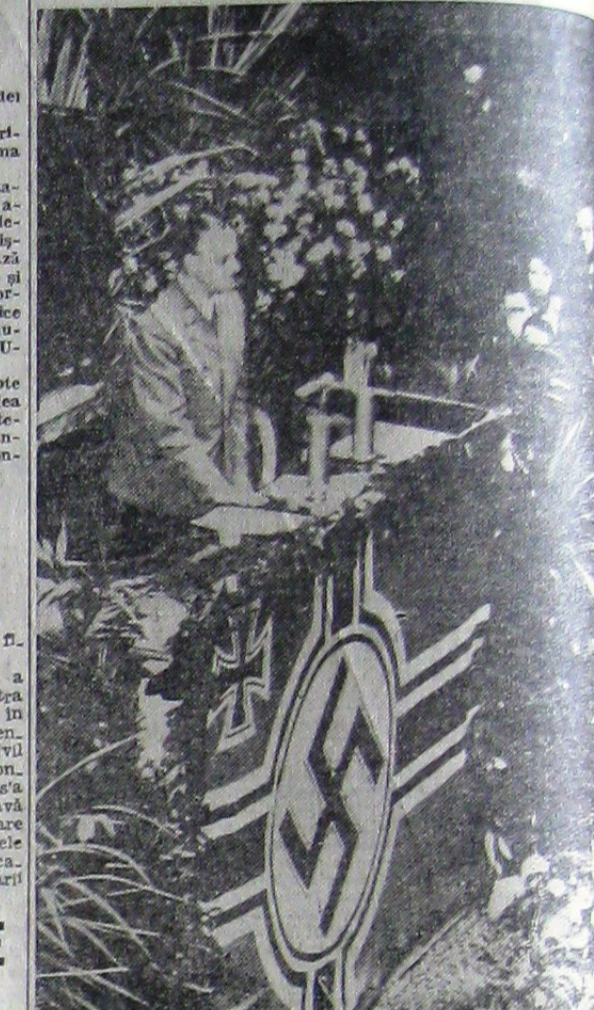
Reichsleiterul Alfred Rosenberg a vorbit zilele trecute în sala de ședințe a Camerei deputaților din Paris