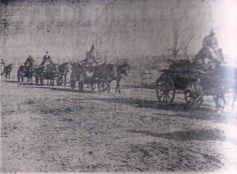
Locuitorii bulgari din comuna Baschioiu de lângă Tulcea își transportă în noua lor patrie până și loc de joc din ogradă