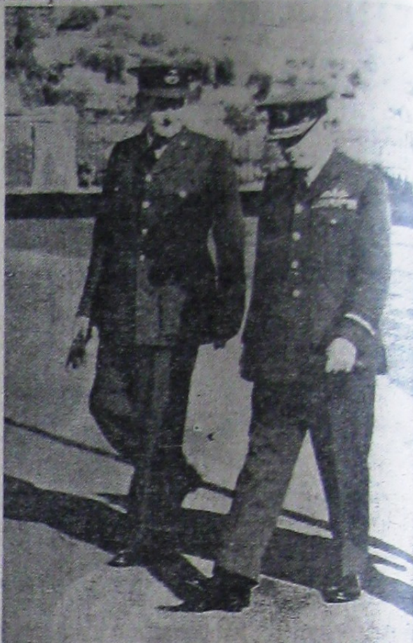
Mareșalul aerului englez Boyd, prizonier în Italia.