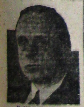
D. VON RIBBENTROP

WIENA, 3. — După o ședere de o săptămână la castelul