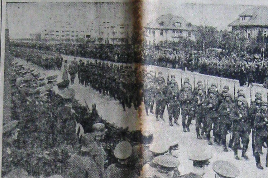
Un aspect al paradei organizate de misiunea militară germană din România, în onoarea M. S. Regelui și a d-lui general Ion Antonescu, Conducătorul Statului