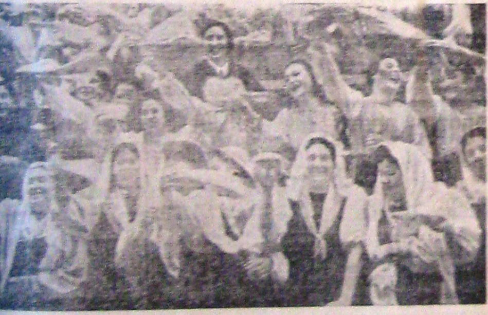
Fotografie luată cu ocazia serbărilor din cadrul detașamentului de la Făureș