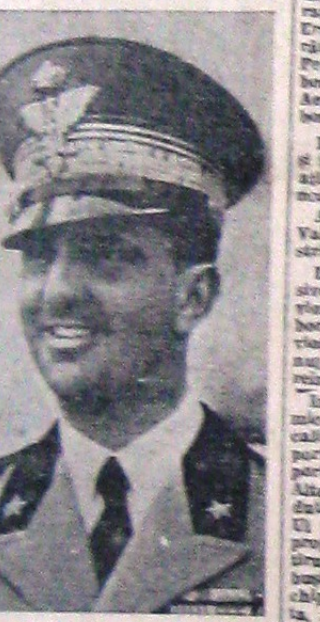
ROMA, 26 (Rp.). — Prințul de Piemont a inspectat ieri unitățile de trupe din regiunea Solzano, Brice și Meran.