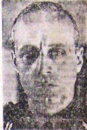
D. VON RIBBENTROP

TELEGRAMA D-LUI STURZA TRIMISĂ D-LUI VON RIBBENTROP BERLIN, 26 (Radior). — D. Mi-