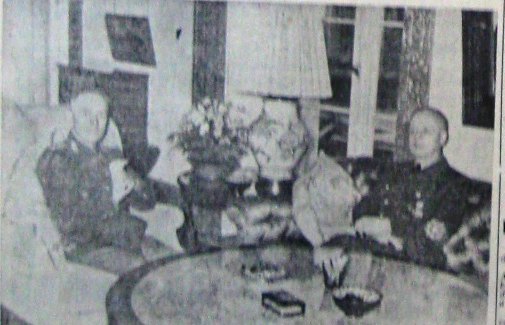
D. General Ion Antonescu într-o discuție cu d. Reichmar von Ribbentrop, în palatul ministerului de Ex-terne al Reichului