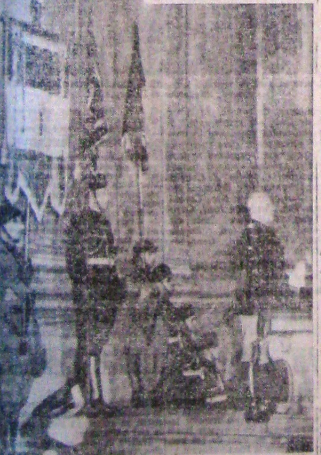
Cu ocazia aniversării sancțiunilor, Ducele a ținut un mare discurs, precizând răspunderile războiului.