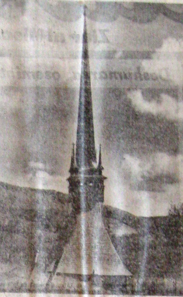
Biserica de lemn din Fieștii de Sus, în Munții Apuseni, arată același îndemănare a țărânului român de a-și crea arhitectură proprie, adaptată vieții simple populare.