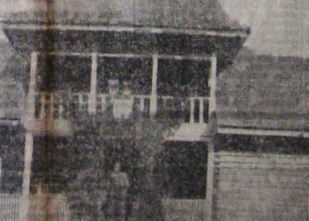
Clădirea clubului sportiv „Colțea” în muntele Susai

Clubul sportiv „Colțea” își preia cabana construită pe muntele Susai