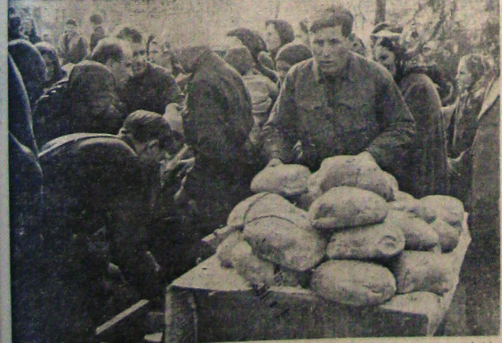
În cadrul activității „Ajutorului Legionar”, cantinele organizate pentru a se veni în ajutorul populației nevoiașe sau nepăzite...