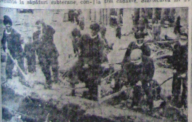
De abia sosiți legionarii dela Avrig au început lucrul, greu alături de camarazii lor din Capitală.

Dacă în această parte, ultima de explorat se va vedea că totul este prăbușit ca și în celelalte 5 părți explorate până acum, se va renunța la săpături subterane, con-