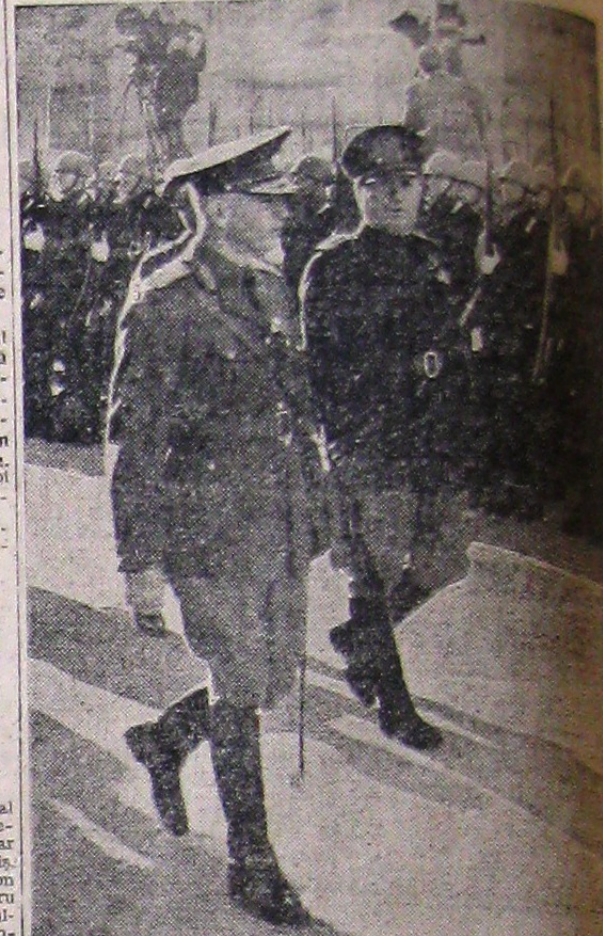
D. general Antonescu și Ducele Mussolini trecând în revistă compania de onoare pe peronul gării Termini

Mii de cămăși verzi și de cetățeni în frunte cu reprezentanții autorităților au primit cu urale și flori pe Conducătorul Statului la Jimbolia și Timișoara