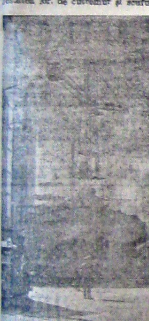
Macaraua instalată la șantierul Carlton în timpul lucrului