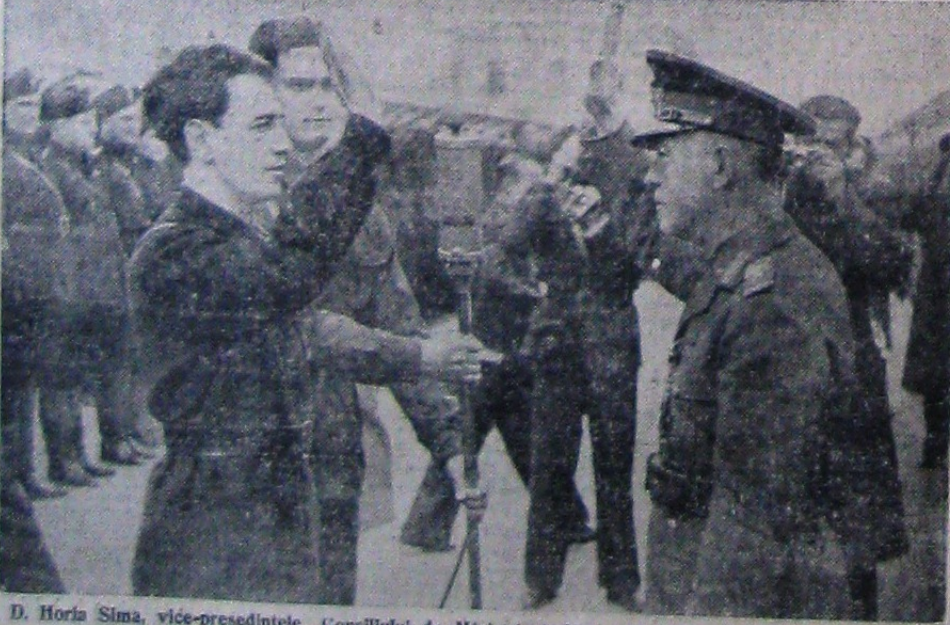
D. Horia Sima, vice-președintele Consiliului de Miniștri și Comandant al Mișcării Legionare dând raportul d-lui general Antonescu, Conducătorul Statului la însoțirea dela Roma