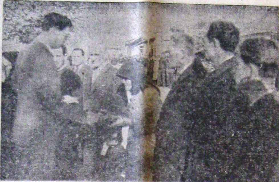
Dupa ce a vizitat rajnele orasului Panciu, Majestatea Sa Regele a împartit personal ajutoare alinastrilor