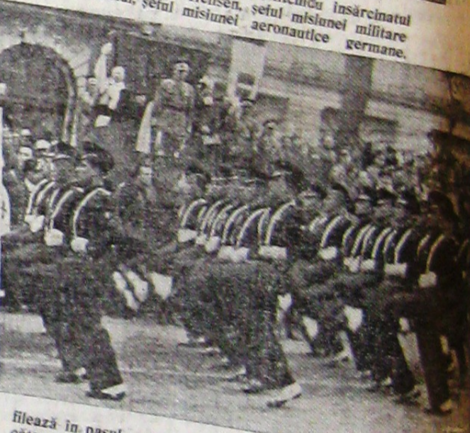
filează în pasul român. — 6) D. general Ion Antonescu, Comandantul Statului, înmânează sabia vechilor Domnitori, M. S. Regina Elena. — 7) Detașamentele organizației Hitlerjugend. — 8) Defilarea cămașilor verzi prîn fața tribunei regale.