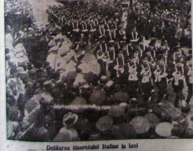
Defilarea tinereții Italiane la lăsi