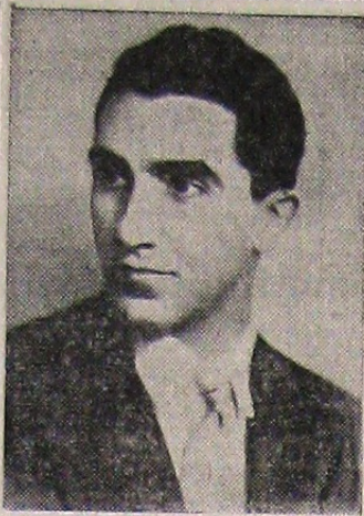
Sunt eu o fire ciudată... (Text from article)