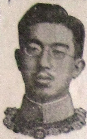
IMPARATUL HIRO HIYO