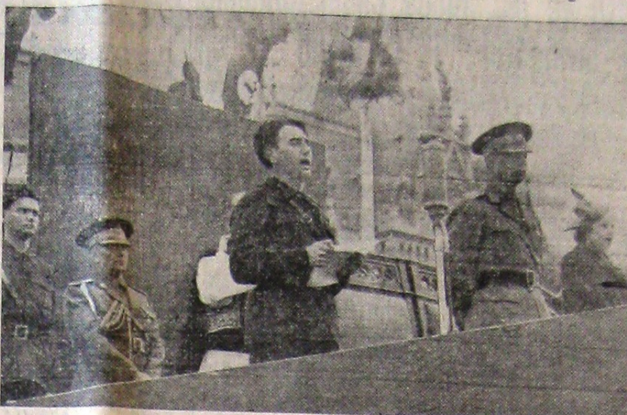
D. Horia Sima, Conducătorul Mișcării Legionare, rostindu-și cuvântarea

pe reprezentanții tineretului fascist și național-socialist și prin ei să ureze marilor conducători biruința deplină. Prin genul lor Europa să ajungă clipa în care toate mișcările naționaliste să sărbătorească împreună ziua marii victorii, apoteoză glorioasă a celei mai îndrăznețe lupte din istoria omenirii. Trăiască Majestatea Sa Regele Mihai II (Ovațiuni prelungește). Trăiască Regina Mamă Elena! (Ovațiuni prelungește). Trăiască generalul Ion Antonescu! (Ovațiuni prelungește). Trăiască delegațiile tineretului fascist și național-socialist! (Urale). Trăiască România Legionară! (Urale prelungește).