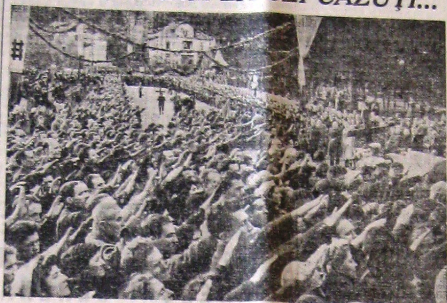
Otor dat camarazilor căzuți