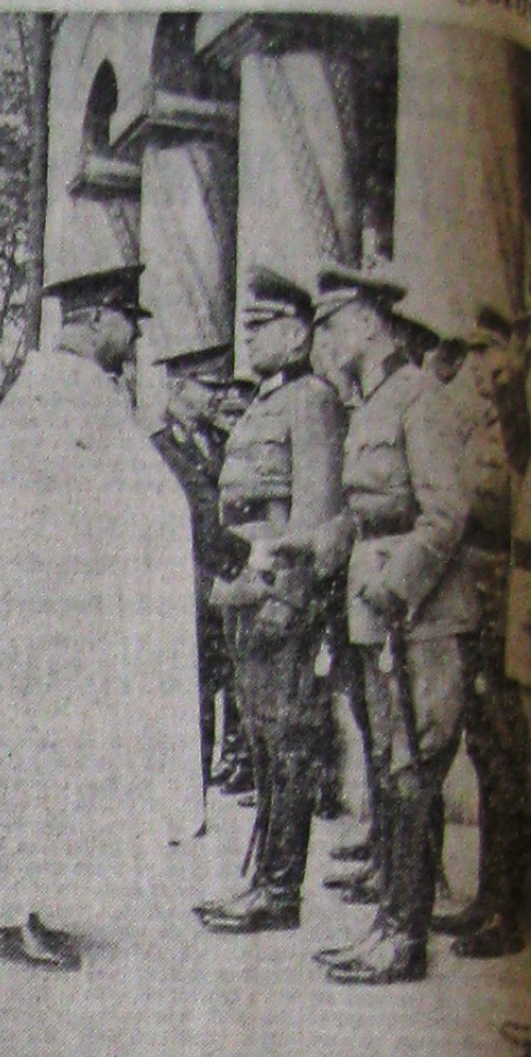
Membrii delegației militare germane sînt prezentați ofițerilor români