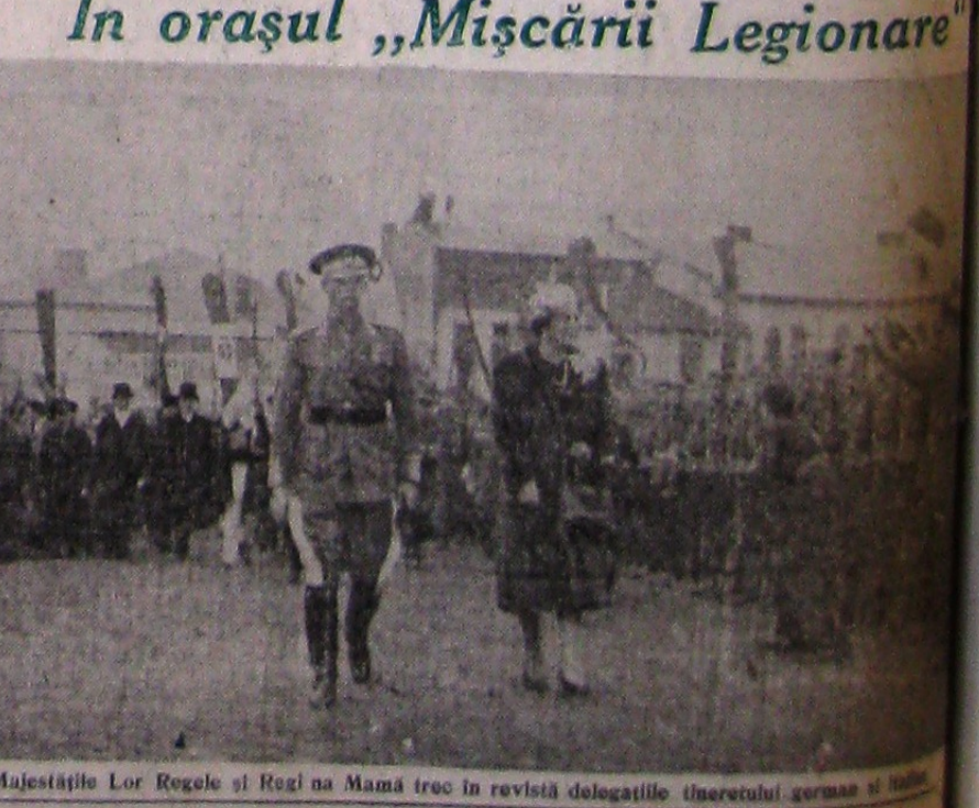
Majestatele Lor Regele și Regi na Mama trec în revistă delegațiile thurecului german și...