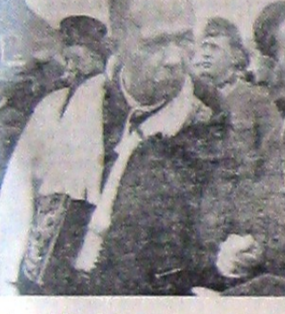
D-nii prof. Ion Zelea Codreanu și Horia Sima, Conducătorul Mișcării Legionare

Măria Ta Regina noastră, nu-ți închinăm cât Te-a dorit poporul românesc, cu ce dor și cu ce lacrimi