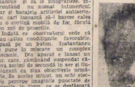
O frumusețe din Africa Centrală