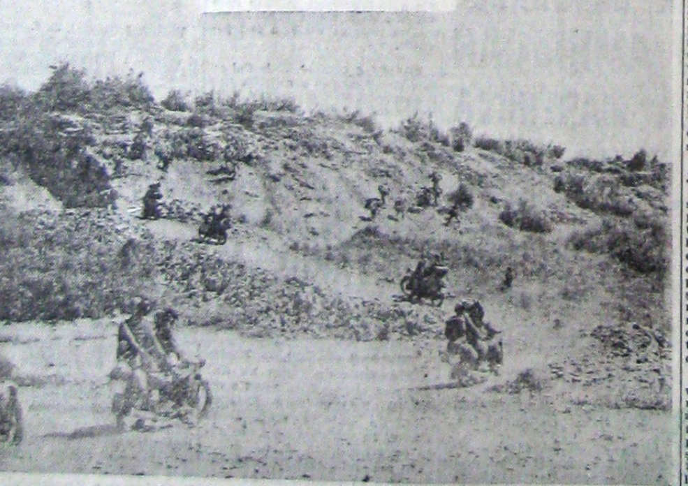
O unitate motorizată italiană trece frontiera greacă