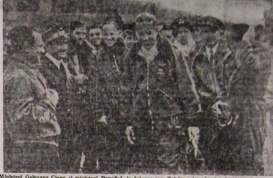
Ministrul Galeazzo Ciano și ministrul Pavolul, la întoarcerea dintr'un sobor de bombardament asupra Corsicel