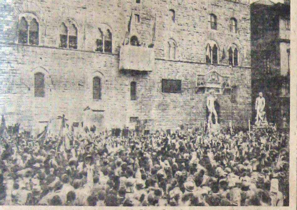
Alt aspect al mulțimilor fascist care au salutat în Piazza Signoria pe Führer-ul Hitler și Ducele Mussolini care le-au răspuns din Palazzo Vecchio