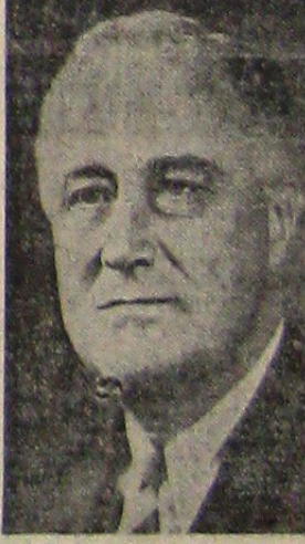
D. Wilkie are sprijinul statelor din Middle-West. Până acum, victoria pare a fi de partea d-lui Roosevelt cu coeficientul de 5 contra 4.

NEW YORK, 3 (Rador). — Corespondentul agenției Havas transmite: Campagna electorală pentru alegerile prezidențiale a atins astăzi punctul său culminant. Președintele Roosevelt pare a dispune încă de un număr suficient de partizani pentru a obține sufragiile unui număr de 261 delegați electorali ce reprezintă majoritatea colegiului electoral compus din 521 delegați electorali votanți.