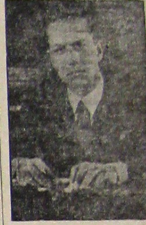
ROMA, 2 (Rador). - Ultimul buletin al ministerului Aerului anunță înaintarea gradului de locotenent colonel de aviație a conelui Galeazzo Ciano...