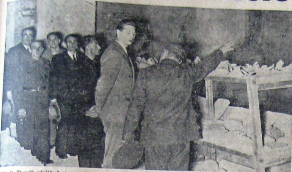
M. S. Regele vizitând muzeul dela Hunedoara, în care sunt păstrate numeroase inscripții, vase și statui descoperite la Sarmisegetuza

Malestătea Sa Regele, în a cărui obținută intră cunoașterea fiicărei părțile de pământ românesc și a cărui dragoste de popor este nefermărită, fiind să cunoască în de-aproape meleagurile unde odinioară a bățut inima Regatului Dacic a făcut o călătorie de studii în județul Hunedoara.