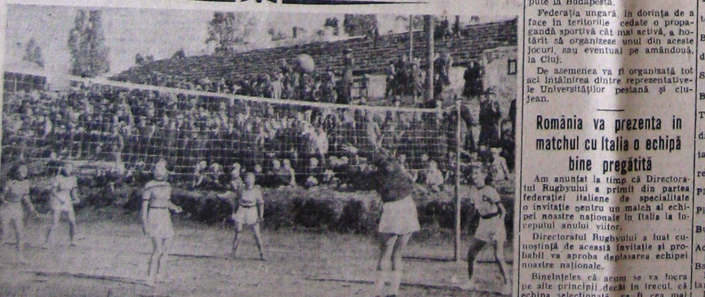
O fază din meciurile de voleibol doamne disputate cu ocazia jubileului clubului Vilor Dacia

Trenul personal 5004, venind din spre Săbăoani, în apropiere de stația Mircești s'a ciocnit violent cu un vagon de marfă scâpat dela un tren de marfă ce manevra în stația Mircești. Din cauza violentei ciocnirii, vagonul a fost aruncat de pe linie iar locomotiva trenului personal și vagonul postal au deralat.