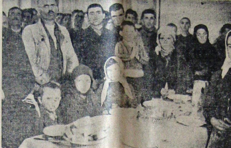
„Ajutorul Legionar” a inaugurat ieri a doua cantina pentru refugiații ardeleni. Cîșeul nostru reprezintă refugiații în timpul răzăclunii pentru binecuvîntarea bucatelor. (Reportajul complet în corpul ziarului)