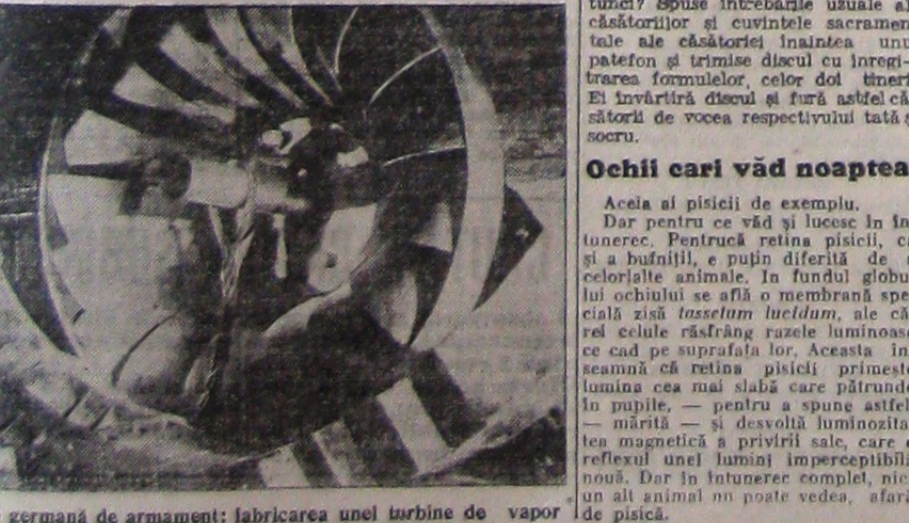
Un uzină germană de armament: fabricarea unei turbine de vapor