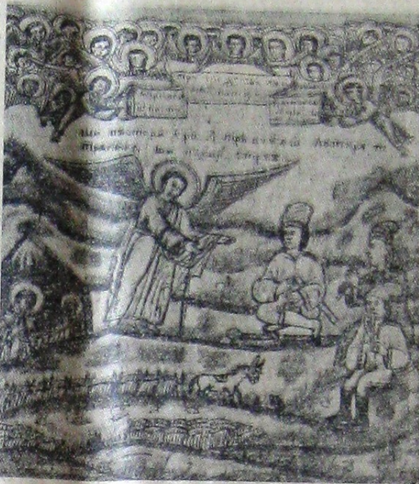
Pihu Mihul, 1842: motiv de colindă