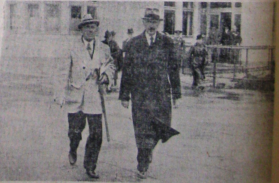
D. von Papen (în stînga), ambasadorul Reichului la Ankara însoțit de d. Fabricius, ministrul de Externe. La București pe aeroportul Băneasa, ieri dimineață înainte de plecare (Reportaj în pagina 9-a)