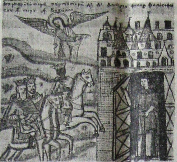
Sosirea Mașilor la Ierusalim