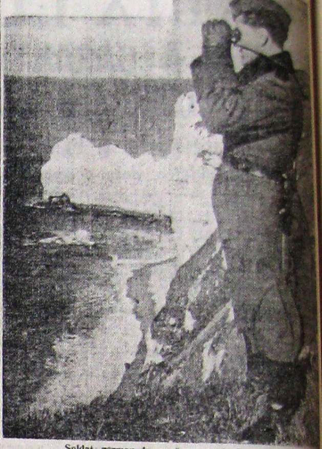
Soldat german de pază pe coasta franceză