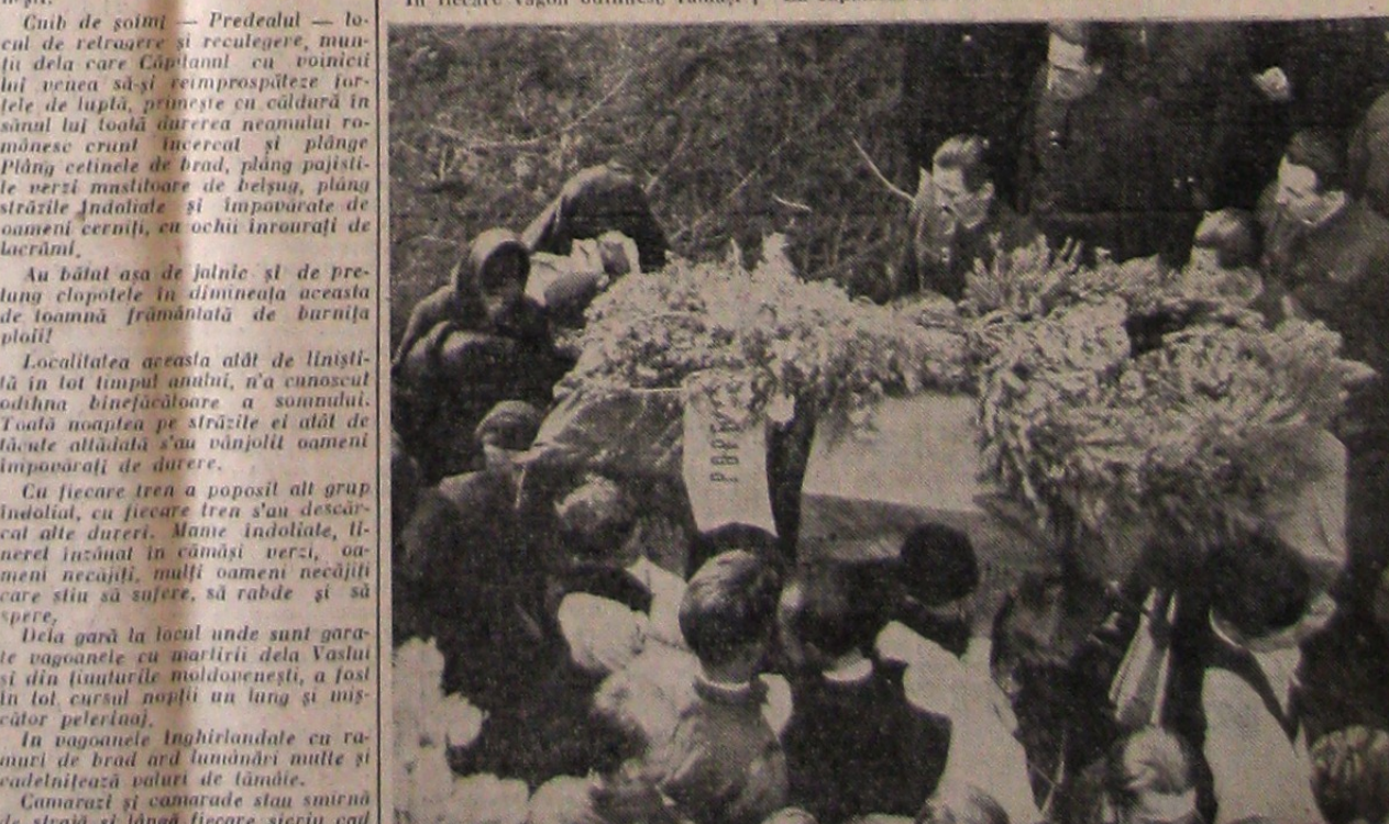
Plâng mamele, surorile.