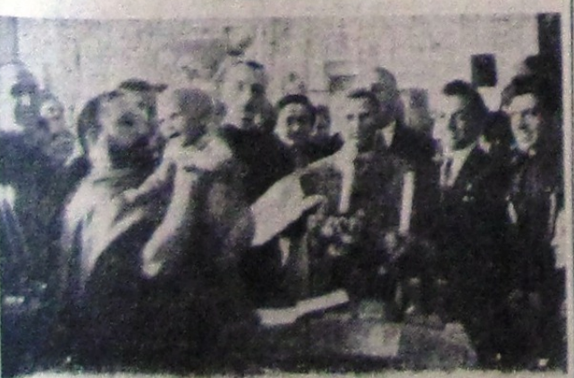
Ajutorul Legionar a botezat la biserica „Asezămăgutul S-a Elena” un copil

Solemnitatea a luat sfârșit la ora 12.30. Grupul de legionari din Corpul Muncitoresc, subsecția I-a Malaxa, așteptat pe două coloane, din fața altarului și până în stradă a dat onoruri salutând legionarele, dăruț formând un acoperământ de brațe întinse pe sub care au trecut cei 13 ai Cuibului „Cei 7 feciori ai Vrâncioaiei”, cu prunci noui primiți în legea creștinească.