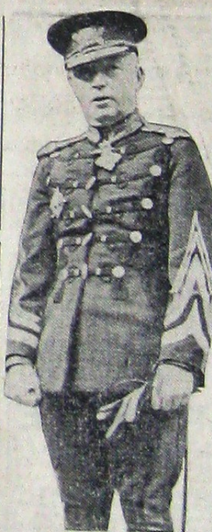
D. GENERAL I. ANTONESCU