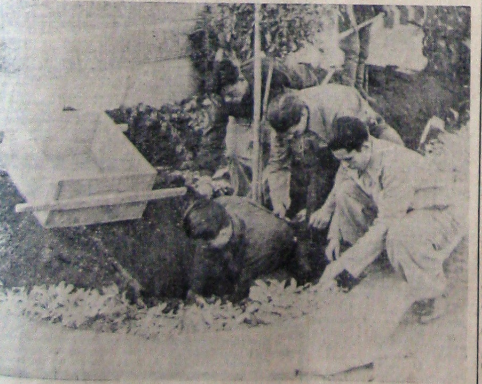
Legionari strângând cenușa din groapă