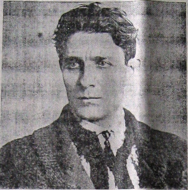
CORNELIU ZELEA CODREANU

VIOLAREA DREPTULUI DE APĂRARE GREȘITĂ STABILIRE A FAPTELOR GREȘITĂ APLICARE A LEGII