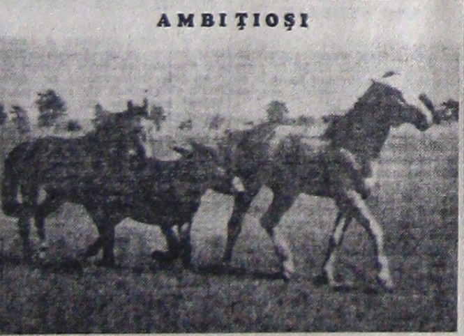
Reputația de incăpățânați a măgarii seamă alte, să le zicem, insurși. De surprins pe acest ambițios măgăruș pas cu tovarășii cai. Nu va izbuti și va rămâne in urmă