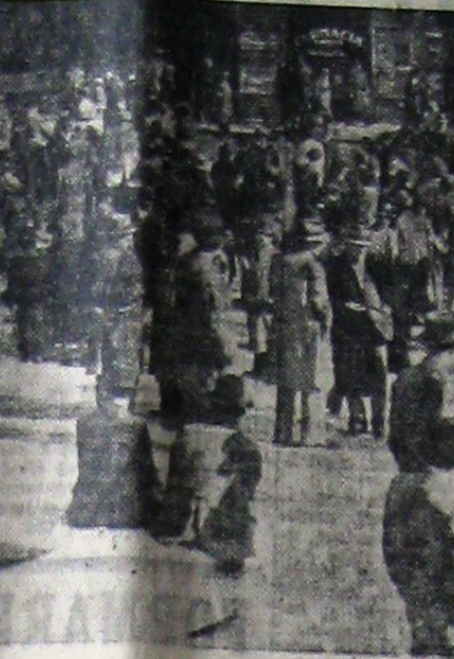
Mulțimea stând pe strazi de teama cutremurului