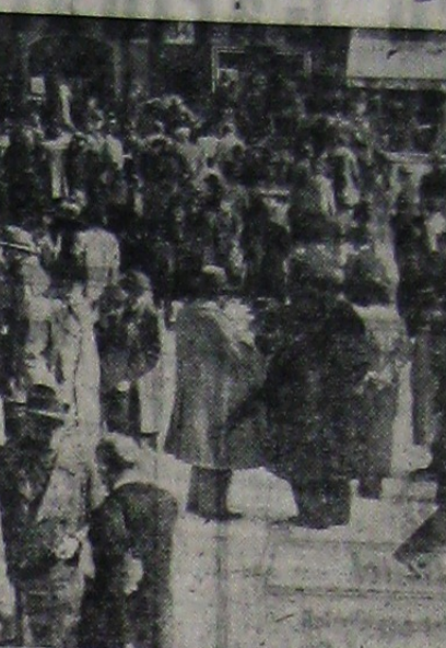
Mulțimea stând pe strazi de teama cutremurului