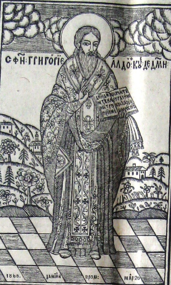
Gravura in lemn dela manastirea Neamt, reprezentand pe sfantul Grigore Pialogul

dracu dintr-ansu, cu urlet de leu, iar tinerii isi rupeau carnea cu dinza si mainile cu neasemula forta. Pe acestia i-a vindecat sfantul, certandu-i dururile.