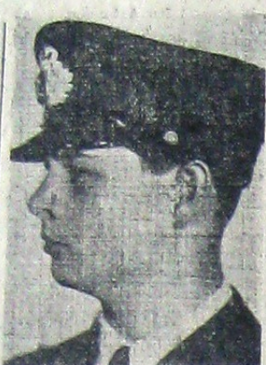
tul Mișunei militare germane în România.