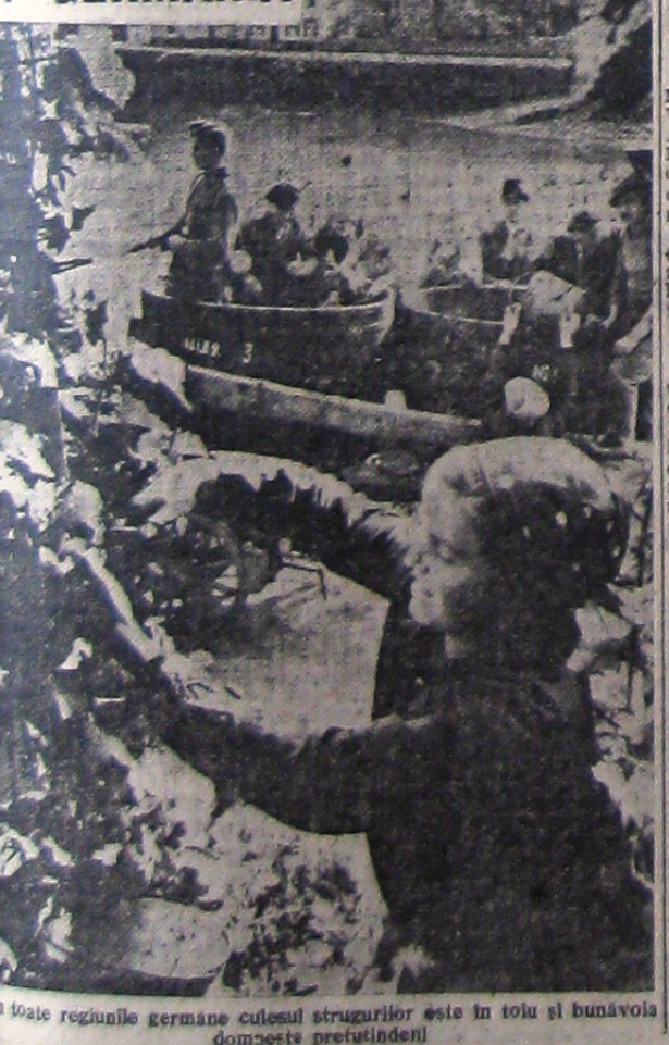
In toate regiunile germane culesul strugurilor este în tolu și bunăvoia domoșteșii prețioșii