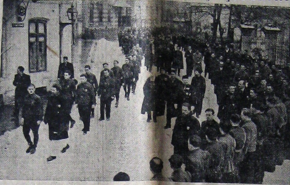
La 13 Ianuarie 1937, Ion I. Moța și Vasile Marin au căzut în prima linie a frontului, în luptele dela Majadahonda. Fotografia noastră înfățișează unul din aspectele dela înmormântarea celor doi eroi legionari. Cortegiul este deschis de Căpitan, având alături pe generalul Zizi Cantacuzino și pe Pray y Soutzo, ministrul Spaniei. Urmează apoi grupul legionarilor cari au luptat în Spania după care vin nesfârșitele coloane de cămași verzi.