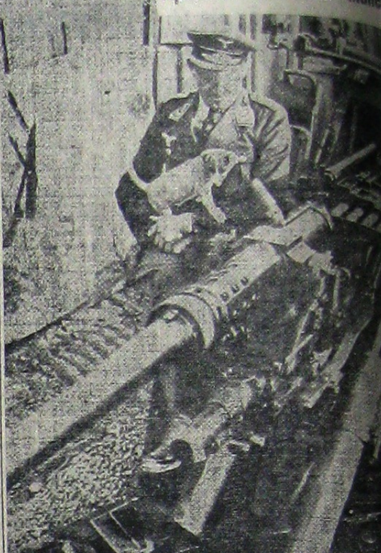
Comandantul unei baterii germane însoțit de prietenul său patruped, spectează piesele pe poziții