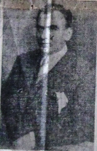
zeu însuși și trist...