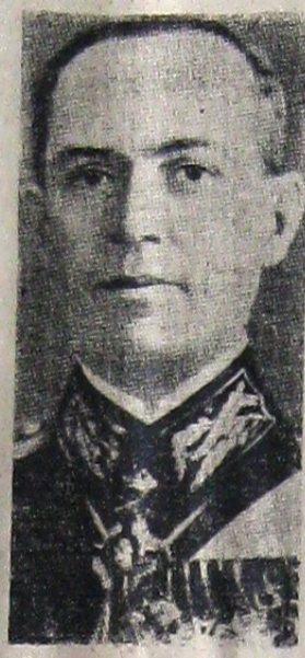
D. General Ion Antonescu

chestiuni locale fără însemnătate. 4) S'a hotărît: Să fie repuși în drepturile lor foștii proprietari ai terenurilor îndiguite din regiunea Spantov-Mânăstirea, județul Ialomița, care au fost cedate în trecut Casei Regale. 5) Să se facă un control mai sever și mai eficace al prețurilor de vânzare a articolelor de mare consum. 6) Ca, în vederea viitoarei campanii de construcții de șosele, să se studieze amănunțit chestiunea exploatarea carierelor de piatră. D. ministru al Justiției, de acord cu d. ministru al Lucrărilor Publice și Comunicațiilor, va întocmi un Decret cu privire la exploatarea și punerea în valoare a unor bunuri lăsate în nelucrare. 7) S'a aprobat Decretul prezentat de d. Mihail Antonescu, ministrul Justiției, cu privire la reglementarea drepturilor avocaților evrei. 8) D. General Antonescu a dat directive cu caracter economic, cari vor fi publicate.