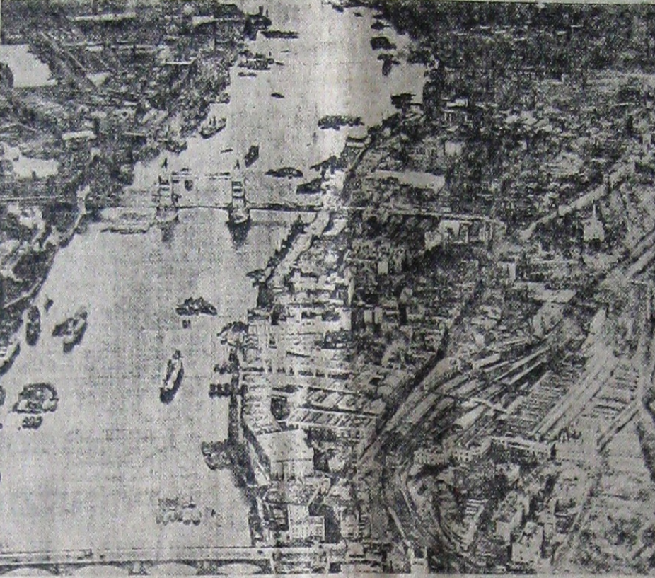
Regiunea estică a orașului Londra care a suferit mai mult în urma bombardamentelor efectuate în ultimele zile de către aviația germană

BERLIN, 12 (Rador). — Generalul Gloise-Horstensau face următoarele constatări în raportul militar săptămânal al agenției DNB: Atacurile de represalii ale armatei aeriene germane împotriva Angliei constituie cea mai impresionantă acțiune a acestui război. Elementul de o hotărâtoare însemnată, care se evidențiază în primul rând, este că bătălia împotriva Angliei, începută acum cinci săptămâni, continuă cu aceeași putere. Nimeni nu mai cotează să pună serios la îndoială că englezii sunt într'o defenșivă absolută și că, lipsiți de toate izvoarele continentale, ei nu se mai pot bizui decât pe poziția lor insulară, extrem de favorizată de natură, ca o ultimă posibilitate de apărare. Noile raiduri executate deasupra teritoriului Reichului, făcute, ca și în trecut, numai noaptea, și cu