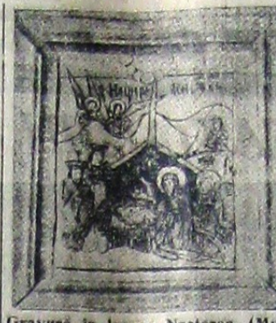
Gravură în lemn: Nașterea. (Muzeul Asociației Astra-Sibiu)