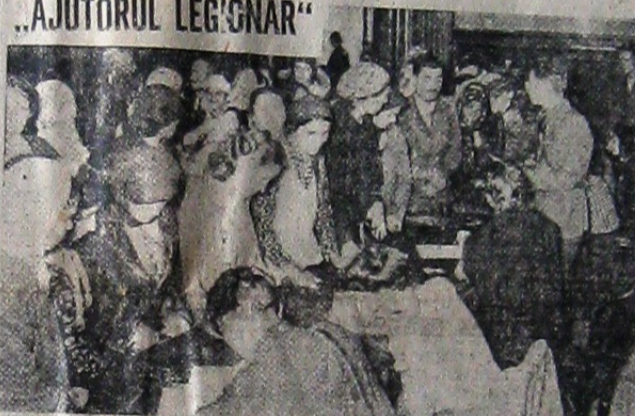
Mulțimea nevoiașilor se înscrie la „Ajutorul Legionar”

din luna aceasta, am luat hotărârea de a da pentru „Ajutorul Legionar” solda mea pe o zi. „Prima rată am depus-o azi la Cec. „Numele meu nu interesează, sunt un Român pe care-l dor rânile neamului”. UN CAPITAN DIN ACTIVITATE