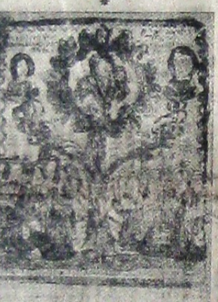
Gravură în lemn, aparținând colecției M. L. Mustea (Cluj)

ROMANIA AERIANA este o revistă care de 14 ani caută să trezească interesul publicului pentru aviație. În ultimul număr (7-8) XIV prima pagină ocupată de editoriale: România Stat Legionar.