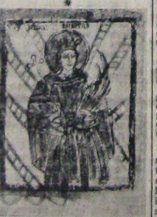
Gravură în lemn: Sfânta Paraschiva.

ROMANIA AERIANA este o revistă care de 14 ani caută să trezească interesul publicului pentru aviație. În ultimul număr (7-8) XIV prima pagină ocupată de editoriale: România Stat Legionar.