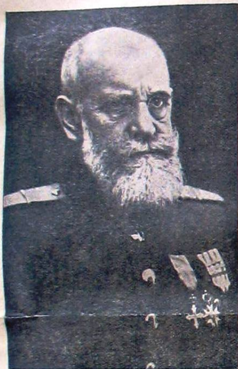
d. General Gheorghe Cantacuzino Grănicerul Seful Partidului „Totul pentru Țară”

s'au ridicat ca munții, s'au întins ca pecinginea, s'au ascuțit ca armele de război; te înțapă mereu din toate părțile și nu-ți dai seama din cotro să te aperi.