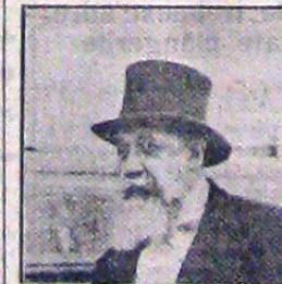
NICOLAE IORGA, „APOSTOLUL NEAMULUI PRIMUL OM CARE A LOVIT CU PIATRA IN GENERAȚIA TANARA ȘI IN CAPITAN, DECLANSAREA PRIGOANEI II APARTINE IL AȘTEAPTA ETERNITATEA INOVARIL.