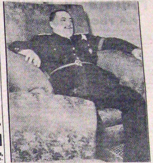
Iată omul care a trimis la moarte mij de tineri. Gavrilă Marinescu, Irodul Neamului românesc, în stare de ebrietate, a poruncit masacrele dela Râmnic, Vaslui, Miercurea-Ciuc, Brașov și cele săvârșite de agenții lui în fiecare județ al țării. PRIVITUL: DUPA O NOAPTE DE CHEF SI DE ORGII, TOLANIT ANIMALIC INTRUN JILT, PARE CA VREA SA SCAPE DE TORTURA COSMARULUI CRIMELOR CE-I APASA CONȘTIINȚA.