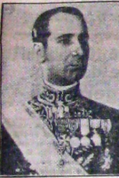
FOST MARE ȘAMBE-LAN AL PALATULUI, BINE INIȚIAT IN TAINELI DE ALCOV CARE AU CONDUS POLITICA DE MARE CRIMA A ROMANIEI.

A EXECUTAT INALTE PORUNCI DE SUPRIMARE A LEGIONARILOR ȘI A FOST INTERPRETUL „DORINTELOR” D-NEI ELENA LUPESCU-GRUMBERG, PIAZA REA A ROMANIEI.