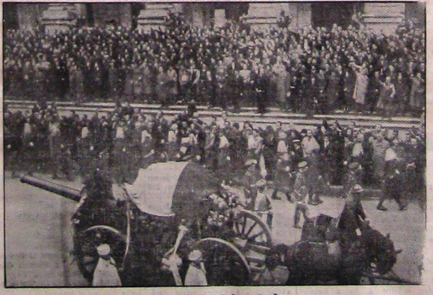
În fața Poștei centrale

BERLIN, 12 (Bodipress). — Agenția Stefani comunică din Roma: Marșele raport care se va ține la 28 Octombrie în Forum Mussolini, cu prilejul împlinirii a 15 ani dela marșul asupra Romei, va avea caracterul unei manifestații grandioase. Peste o sută de mii de persoane, reprezentând toate țările vit ale națiunii, vor lua parte la raport. Între alții vor fi prezenți primarii din 9000 comune, directorii șarrelor fasciste, șefii sindcațelor, șefii organizațiilor partidului fascist și șefii autorităților militare, politice și civile. Numărul drapelilor va fi de 15.000. Raportul care are scopul de a stabili liniile și directivele pentru al 28-lea an al erii fasciste, se va îndepărta potrivit tradiției severe a fascismului. El va preceda celălalt mare raport al tuturor forțelor producției naționale, cu prilejul împlinirii a doi ani dela aplicarea sancțiunilor economice împotriva Italiei.