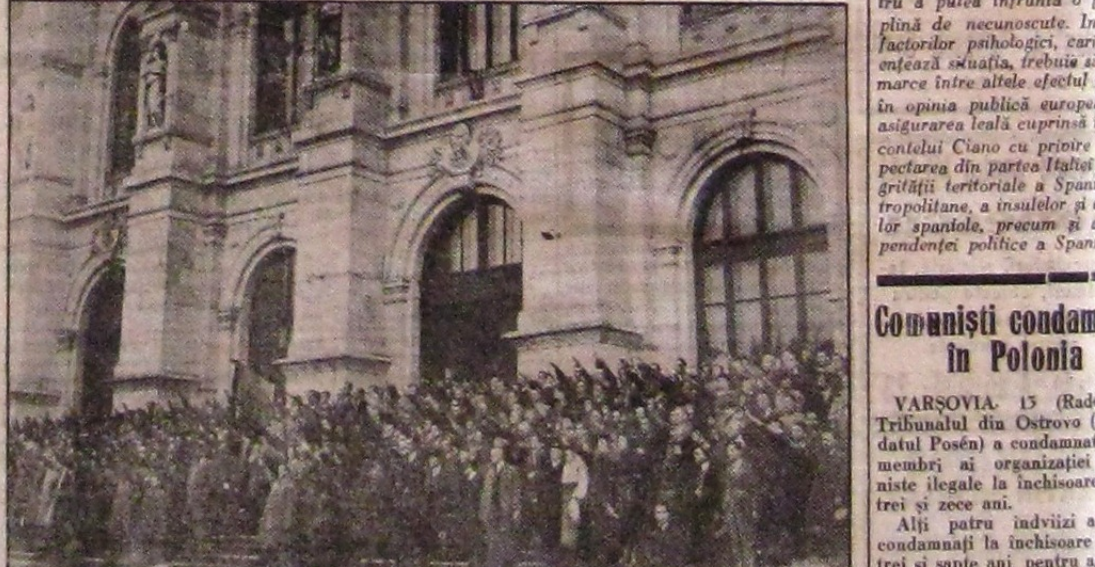
La Palatul de Justiție, A. R. C.-ul pleacă drapelul îndoliaț în fața ramăniștelor pământestii ale Generalului Cantacuzino-Grănicerul.