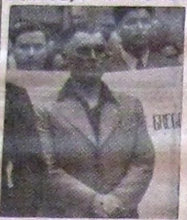
D. ING. CLIME

cercurile politice. Raporturile între Partidul Totul pentru Țară și oficialitățile se vor face