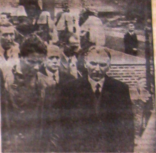
D. Corneliu Z. Codreanu ține din Biserica Mihai Vodă. Alături, d. prof. Nae Ionescu.