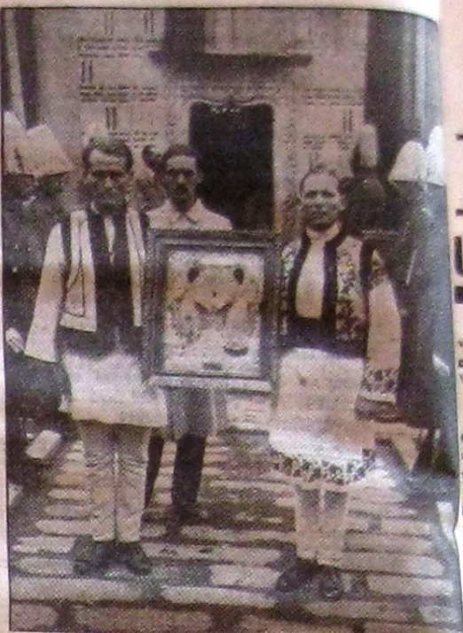
Icona purta tă de legionari

că speculații asupra Soveranității sale. SALAMANCA, 13 (Rador). — Corespondentul Agenției Havas transmite: Mai multe avioane guvernamentale au înscercat ieri dimineață și a seară să arunce bombe asupra orașului Saragoșă, însă avioanele naționaliste le-au înfruntat, doborând 24 aparate. Se crede că alte 9 avioane au fost doborâte, căzând dincolo de liniile naționaliste. SAINT JEAN DE LUZ 13 (Rador). — Corespondentul Agenției Havas anunță: Știrile primite dela frontieră semnalează mari pregătiri pe care le fac forțele naționaliste pe frontul Aragon. Autoritățile naționaliste procedează în importante concentrații de trupe și material de război între Jura și Teruel. Aceste concentrații s'ar face în vederea unei mari ofensive decisive. BILBAO, 13 (Rador). — Corespondentul Agenției Havas transmite: Postul de radio din Bilbao anunță că d. Companys a demisionat din funcțiunea de președinte al Generalității catalane și că demisia sa ar fi acum oficială.