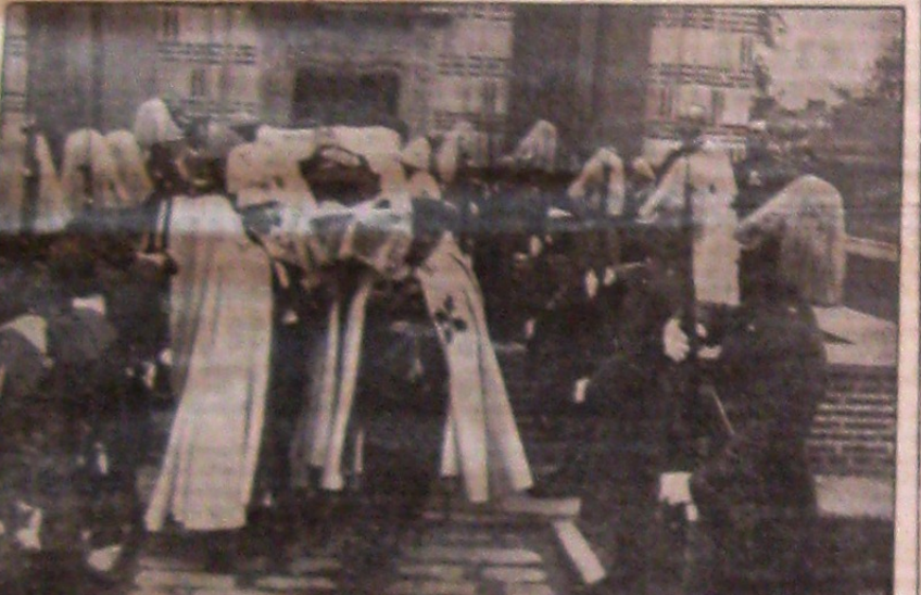
La Biserica Mihai Vodă. Scurtul este coborât pe umeri de cavalerii Ordinului Mihai Viteaz